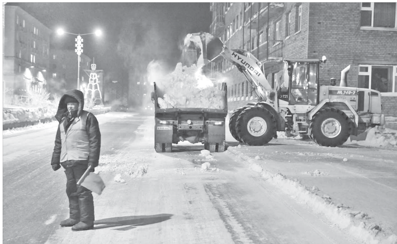
Работы ведутся круглосуточно