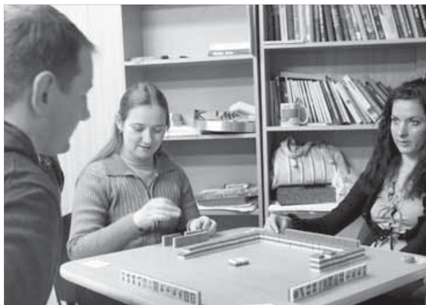
Между покером и домино

В новогодние каникулы в домике "Необычных людей" прошел турнир по маджонгу.