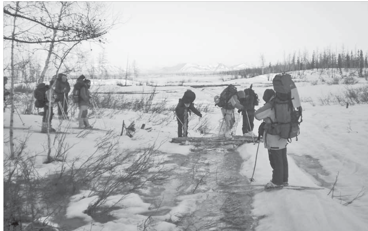
Настоящему исследователю и ручьи в тундре не помеха

Члены Таймырского отделения Союза радиолобителей России в течение дня проведут сеансы связи. А туристы из Татарстана познакомят норильчан с фотовыставкой и фильмом, снятым в походах по Таймыру. Правда, члены клуба “Казанская экспедиция” в наш город не прилетят, их участие в собрании краеведов будет заочным. Может быть, в следующий раз мы встретимся лицом к лицу. И не только с казанскими путешественниками. Вполне возможно, что норильский КИТ получит статус всероссийской конференции исследователей территории.