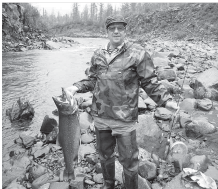
Он знаменит успехами и на этом поприще

В 2011 году на Талнахской обогатительной фабрике и руднике “Комсомольский” реализован совместный проект фирмы Engineering Dobersek GmbH “Использование отвальных породных хвостов ТОФ для закладки выработанного пространства рудников Талнаха”. В