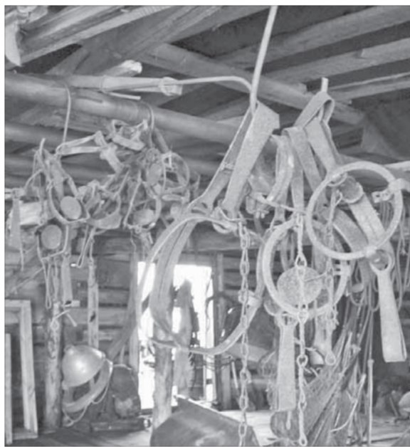
Из экспедиции привезли немало артефактов