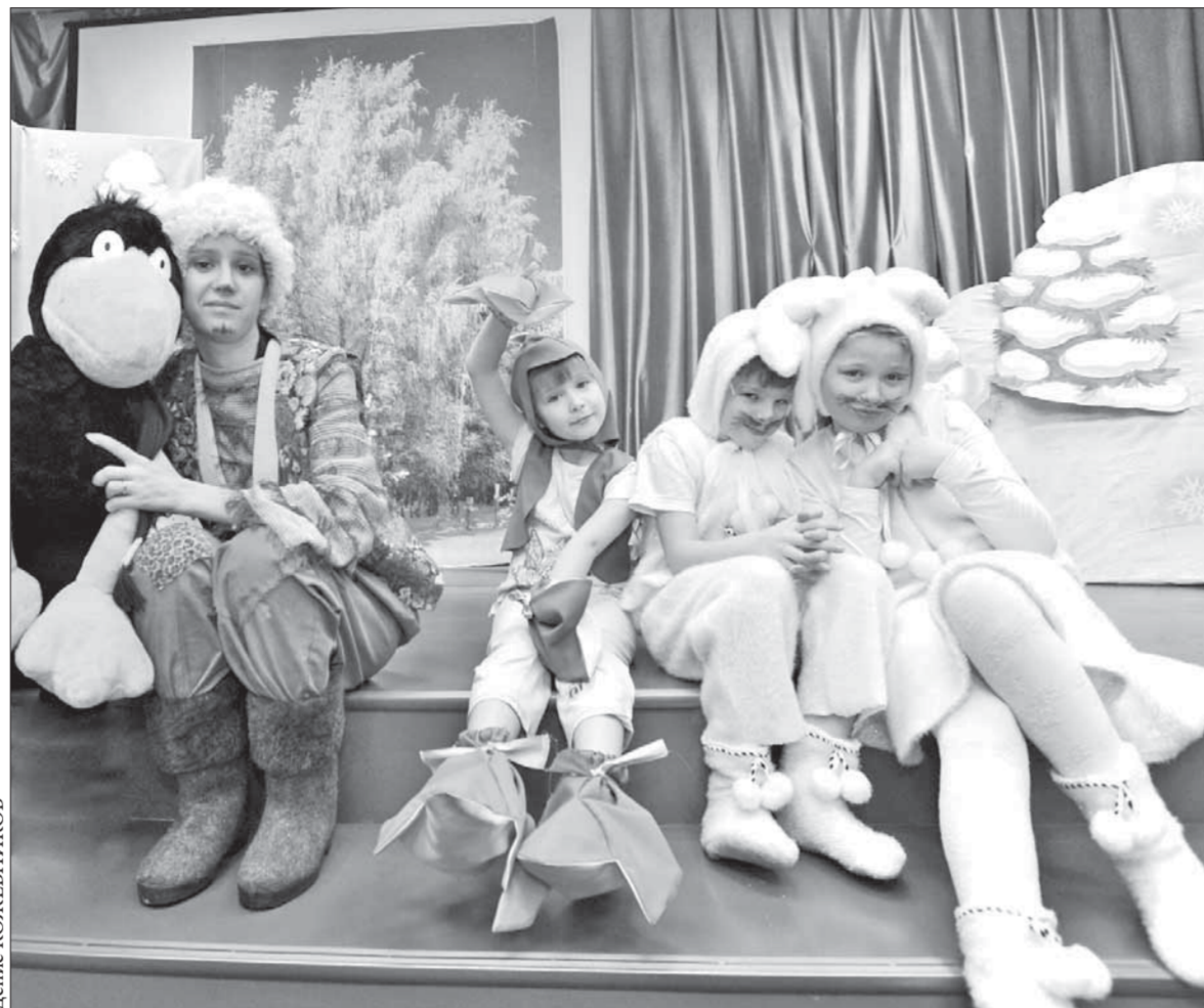
Новогодние герои порадовали первых зрителей

С 1 января будущего года начнется прием заявлений от выпускников прошлых лет на участие в Едином госэкзамене. Выпускники прошлых лет, имеющие документ гособразца о среднем (полном) общем, начальном профессиональном и среднем профобразовании, в том числе те, у кого срок действия ранее полученного свидетельства о результатах ЕГЭ не истек, могут сдать ЕГЭ в 2012 году. В УОИДО сообщили, что сдать ЕГЭ можно будет по математике, русскому и иностранному языкам (английскому, немецкому, французскому), по литературе, биологии, информатике и ИКТ, химии, географии, общественному знанию, физике, истории. Для этого до 25 февраля необходимо подать заявление на участие в ЕГЭ на имя руководителя управления общего и дошкольного образования администрации города Норильска. Учащиеся учреждений начального и среднего профобразования, освоившие федеральный госстандарт среднего (полного) общего образования в пределах основных программ, подают заявление на имя руководителя своего образовательного учреждения. Проект расписания проведения ЕГЭ расположен на сайте УОИДО (nordiuocoz.ru).