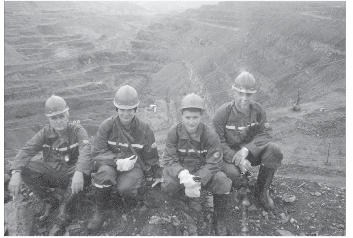
Изверху видно все. Сотрудники УГЭ в курсе всех перемен, происходящих на площадках НПП