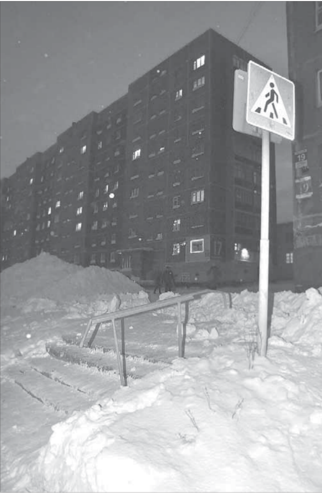
Ступеньки у перехода всегда должны быть чистыми