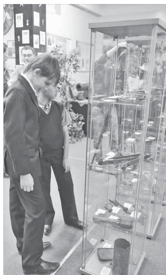
Новые витрины пришлось очень кстати

Финал экспедиции – стоянка на фактории Введенское, что в 25 км от истока Пясины из одноименного озера. Возможно, это самое старое из пясинских поселений, считают исследователи из Норильска. Упоминания о нем как об уже сложившемся центре православного прихода были датированы 1822 го-