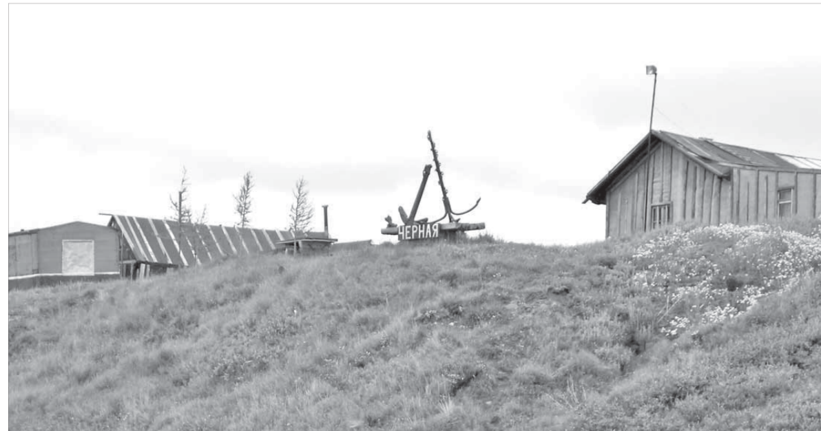
Промысловая точка Черная стала первой опорной базой у норильчан

Среди наиболее заметных находок участники экспедиции назвали два старых якоря на деревянном основании. Сейчас они выполняют на промысловую точку роль памятников, а молодых исследователей заинтересовала история появления якорей в этих местах. Пообщавшись со специалистами, норильчане собрали сразу несколько версий. О каждой из них можно узнать, посетив музей школы №41.