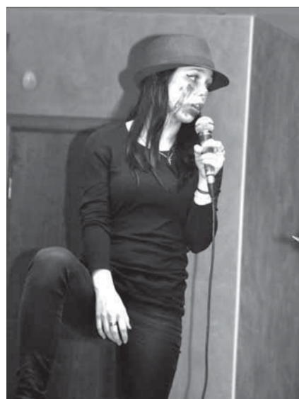
А вы от чего сходите с ума?

Под таким названием в публичной библиотеке прошел молодежный творческий вечер. "Против, конечно, образно, – поясняют организаторы мероприятия, представители творческого объединения "Сцена". – На деле музыка и слово – это оружие из одного арсенала".