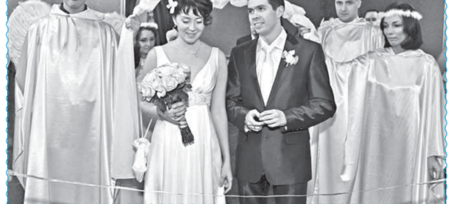
...ангелы на земле следят за тем...

По легенде, ангелы спустились с небес не просто так. Сопровождая новобрачных в новую семейную жизнь, они должны были убедиться в том, как влюбленные справятся со своей новой ролью. Для этого во время праздника они незаметно "украли" невесту... и жениха (ангельский ответ традиционной прощальной невесты). Гости и родственники доказывали хранителям, смогут ли они поддержать пару морально, дружески или финансово. Надо сказать, смугл. За это новобрачные подарили присутствующим нежный танец под песню "Лучше не будет никогда".