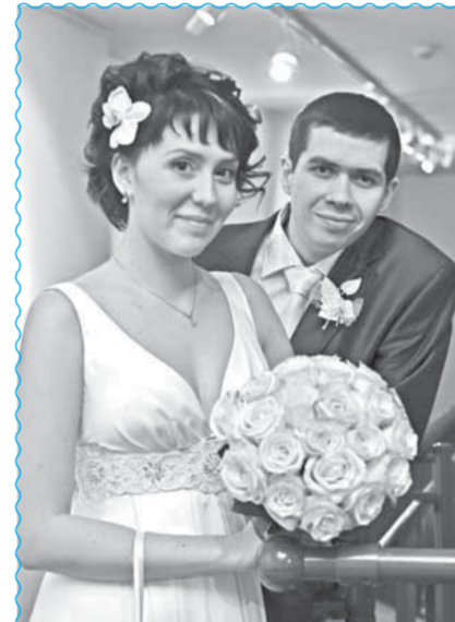
...чтобы молодожены были счастливы