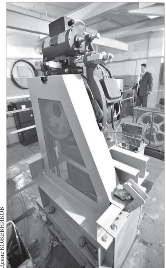
Безредукторная лебедка компактная, а максимальный уровень шума в машинном помещении на 11% ниже допустимых требований