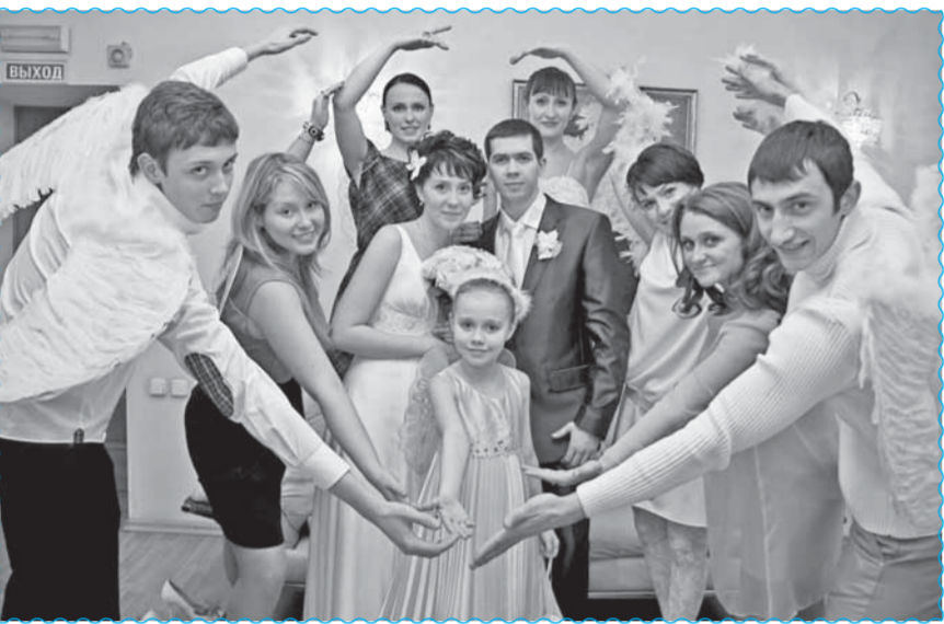
Если браки заключаются на небесах...

Рассказ о вашем романе появится на страницах газеты, а свадебное фото станет отличным украшением семейного альбома.