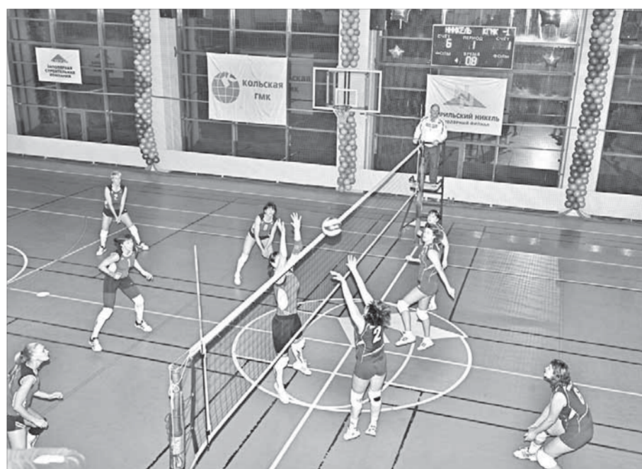
Матчи были сложные, но наши

Куда бы еще заметнее! Помимо главной награды турнира командную копилку пополняют еще и трофеи