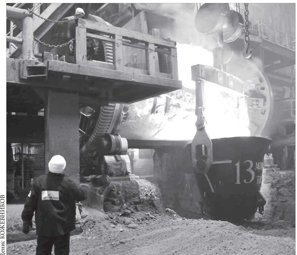
Работа у конвертеров кипит