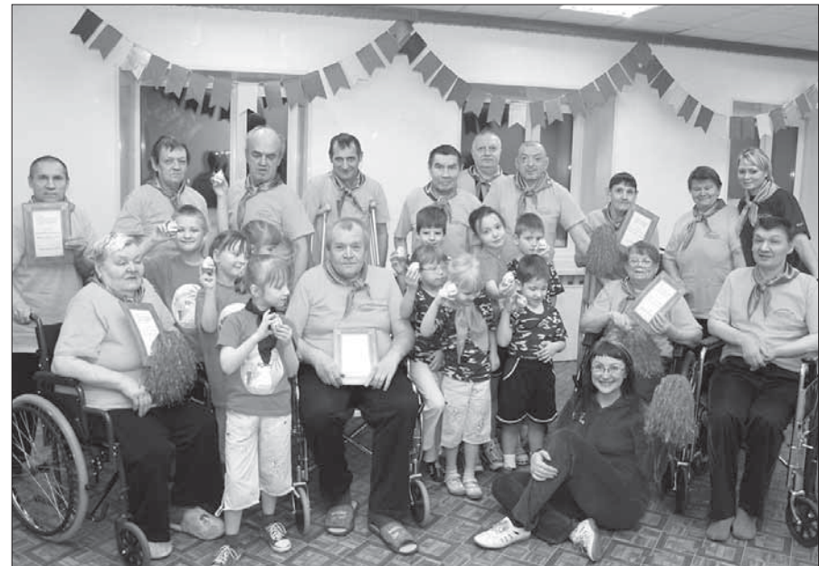
Все почувствовали себя единой командой