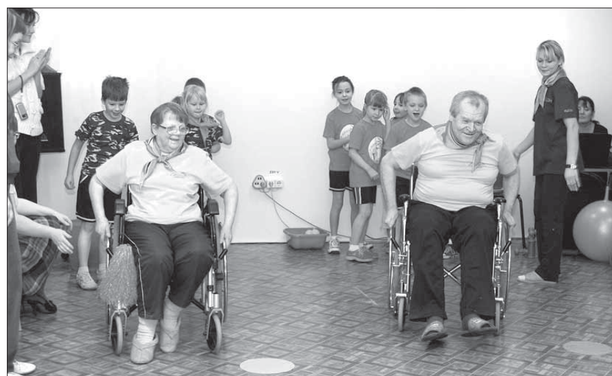
Вперед, к цели!

можностями, проживающие в центре. Цель совместного мероприятия – активизация физических резервов у инвалидов, адаптация их к нормальной социальной среде. Для детей подобный опыт