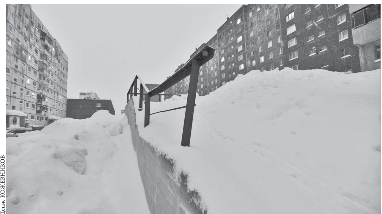
Здесь не ходи, туда не ходи