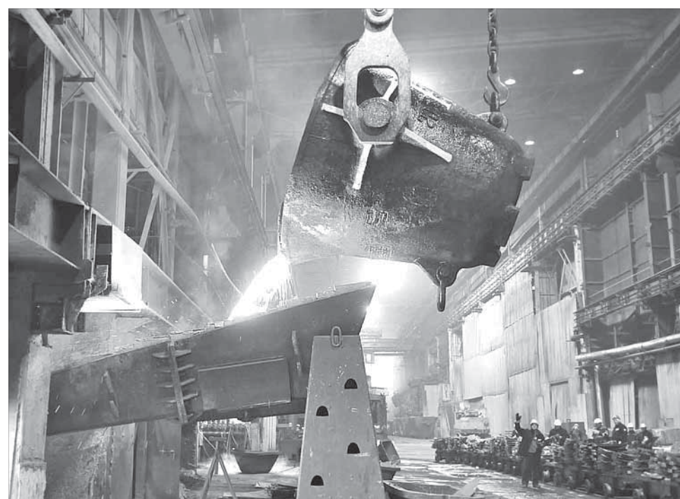
Залог успешной плавки – в слаженных действиях