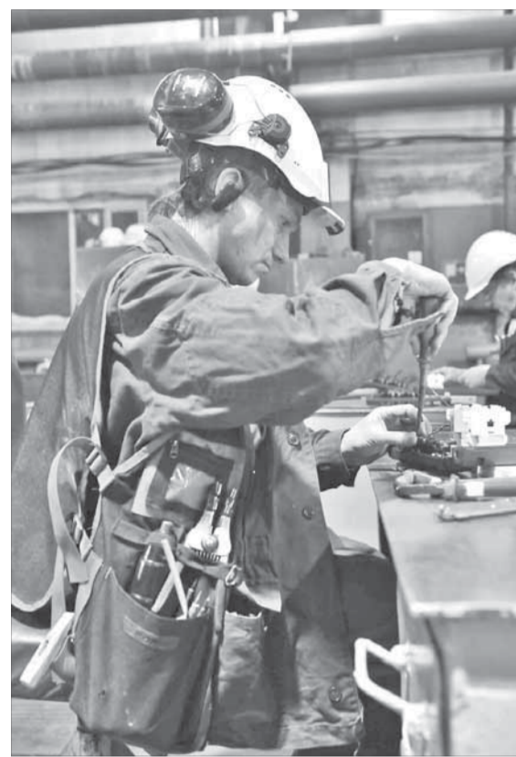
50 минут сконцентрированного труда

В электромонтажном цеху мы насчитываем 26 конкурсантов. Судя по сосредоточенным лицам, намерения у претендентов абсолютно серьезные. Делиться между собой опытом специалисты будут позже, когда оценочная комиссия удалится на совещание, сейчас же внимание сконцентрировано