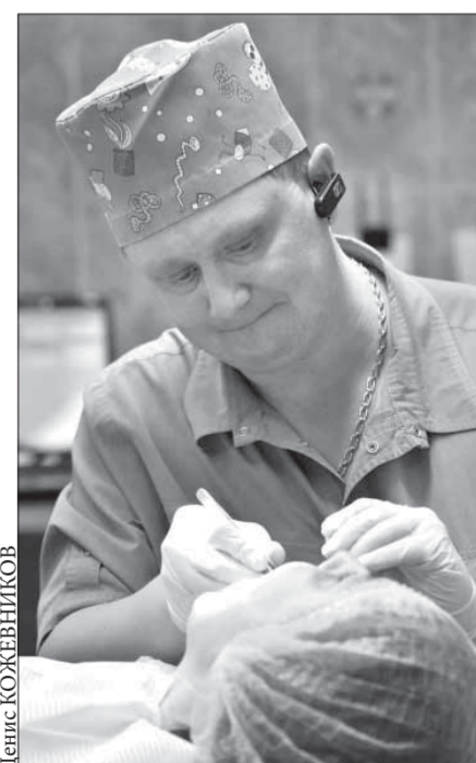
Продолжение на 4-й странице ▶

– Прожив здесь определенное время, что-то создав, хочется не останавливаться на достигнутом уровне, а двигаться далее. Ситуация сегодня такова, что дальнейшего профессионального роста я могу добиться уже только на материке. Хотя Норильск в силу своей специфики, безусловно, многое мне дал как специалисту. Закончив в 1995 году Красноярский медицинский институт, я приехал сюда на интернатуру. После службы в армии, в 1997 году, устроился в городскую больницу. До реорганизации, с 1999 года по 2000-й, я возглавлял в Оганере челюстно-лицевое отделение. В клинике полярной медицины работаю с 2004 года. Начинаясь здесь все когда-то с одного-единственного стоматологического кабинета, а со временем нечеловеческими усилиями мне все-таки удалось создать то, что мы на сегодня имеем. На мой взгляд, в “Полярке” сейчас лучшая стоматология в Норильске по уровню оказания помощи больным.