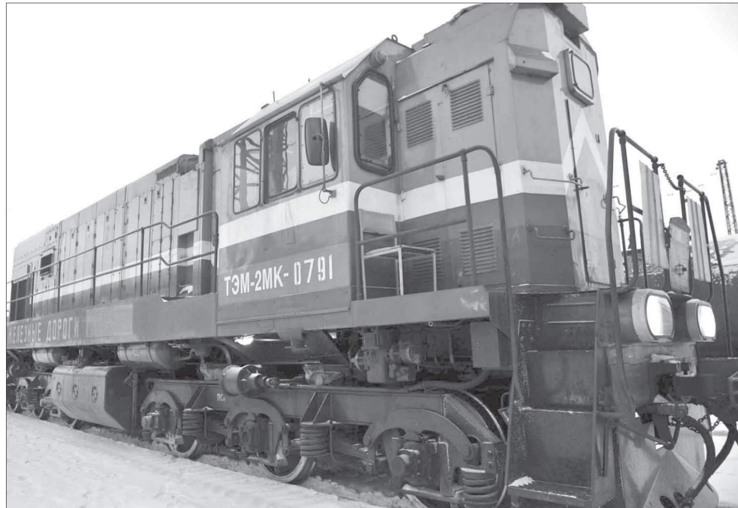
Своих собратьев тепловоз посылнее