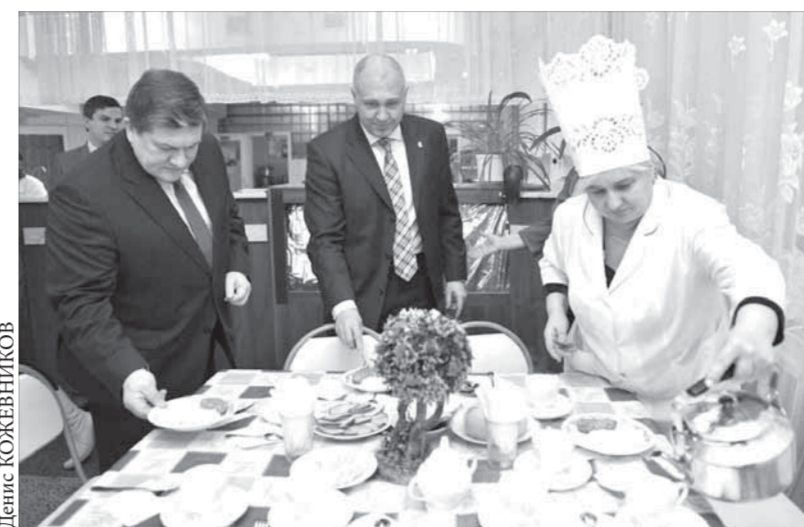
Руководители города проверили, как кормят школьников