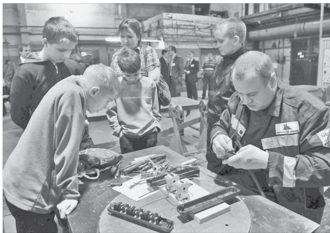
Дети проявили большой интерес к практической части

Опытным специалистам на сборку потребовался в среднем час, что превышает определенное условиями конкурса время. В норматив уложились три человека, но двоим из них, как выяснилось на месте, далось это в ущерб качеству – механизм оказался неисправен. Чтобы определить второй и тре-