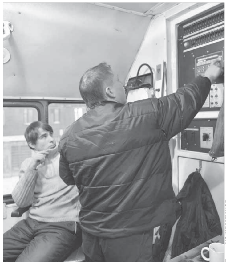
Кабинка в стене – бортовой компьютер

Американцы модернизировали ТЭМ-2 на Уссурийском локомотиворемонтном заводе. На отечественную раму с ходовой