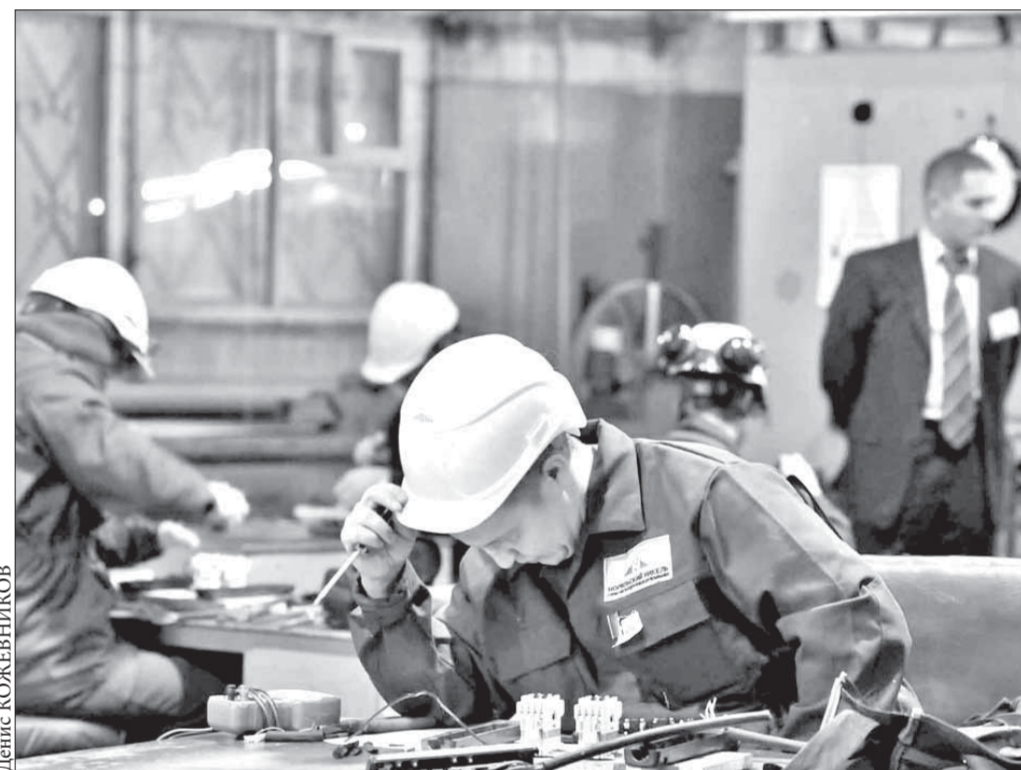
Главное – разобраться в схеме, остальное – ловкость рук