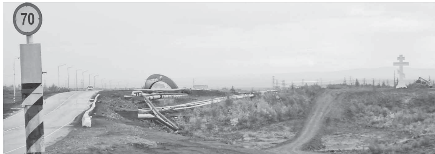
Въездной знак в Норильск расположится неподалеку от поклонного креста