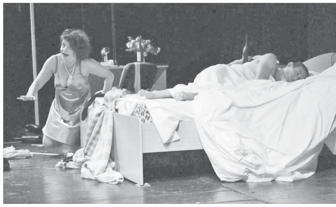
Таких спектаклей, как «Жалость», на сценах европейских театров очень много

Я предложила бы устроителям следующих «Параллелей» организовать фестиваль не городов, а северных стран мира, пересекающих 69-ю параллель. В этом случае и сама культура будет представлена шире, и программа плотнее.