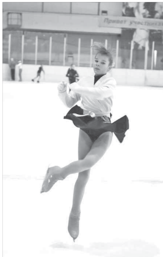
Сложные элементы по плечу только самым способным