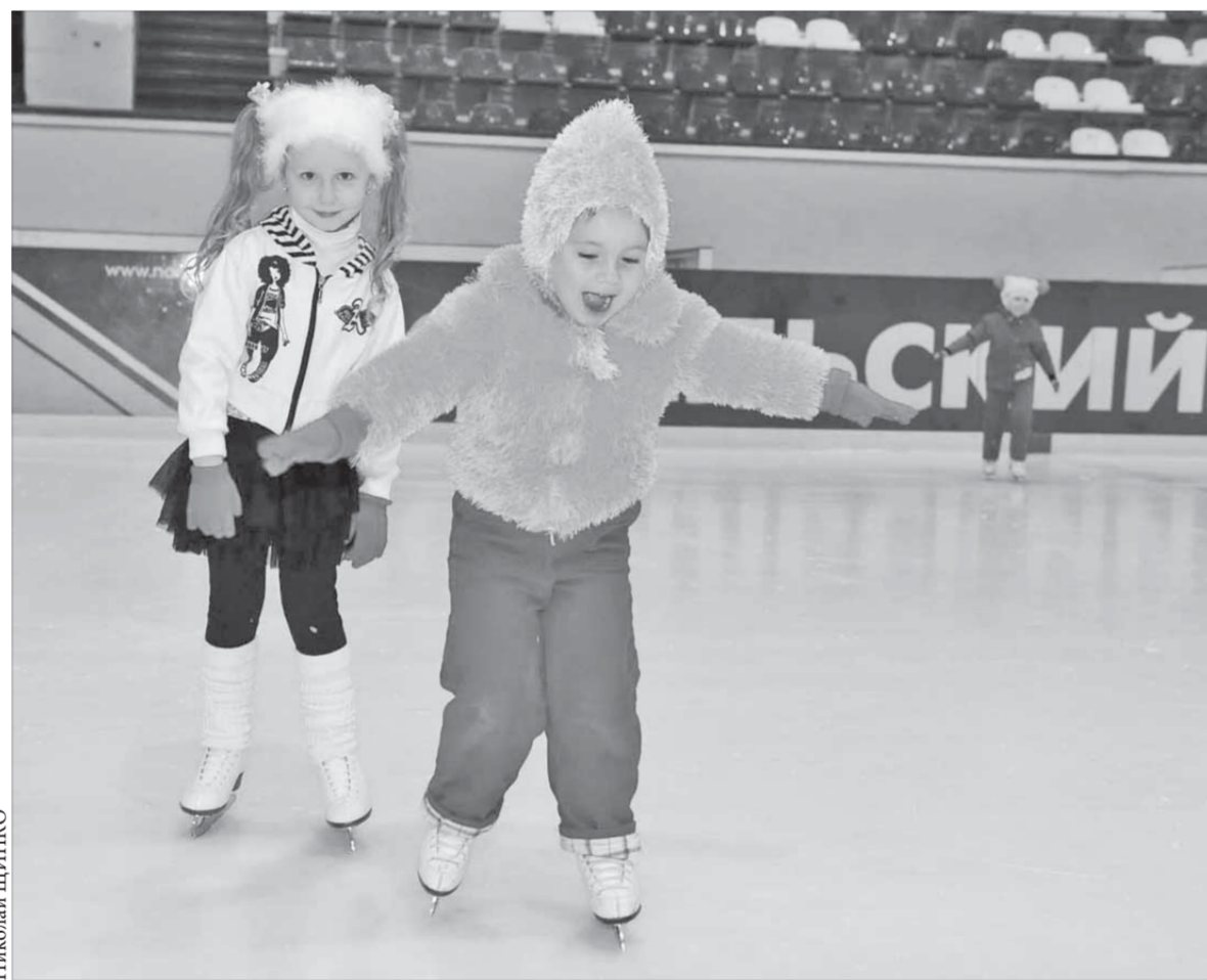
Первые шаги на льду

Родителям на время тренировки сюда вход запрещен. Однако они каким-то волшебным образом просачиваются на трибуны. И вот уже готова группа поддержки.