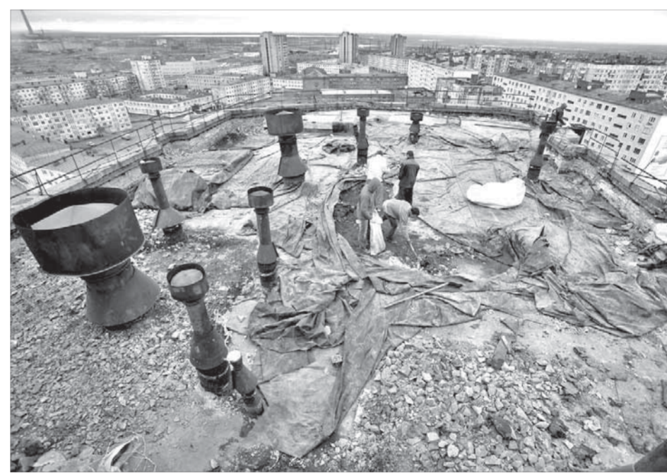
Большое внимание уделяется ремонтам кровель

устанавливать именно «Норильскбыт». И как прекрасно медь себя показала. В 2002 году «Норильскбыт» распался на несколько самостоятельных компаний. И никто больше не занимался этим. Потому что инновации такого рода требуют больших первоначальных вложений, и ни одна из частных коммунальных организаций не могла или не хотела позволить себе это. И это не единственный пример преимуществ мощной компании перед рядом мелких. Хотя задачи у всех коммунальных одинаковы: управление многоквартирными домами, производство общестроительных, электромонтажных и санитарно-технических работ, предоставление коммунальных услуг по электроснабжению, теплоснабжению, водоснабжению и водоотведению.