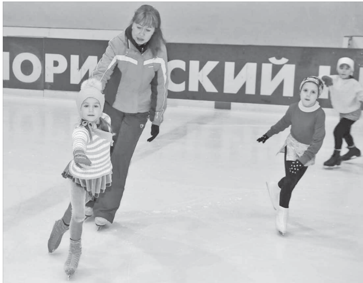
Техника и артистизм в фигурном катании главное