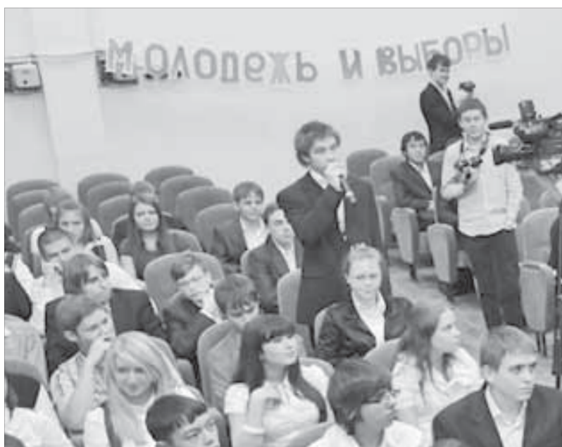
Будущий электорат проявляет интерес к выборам

С 17 по 21 октября во всех школах края прошли уставные уроки, направленные прежде всего на формирование у учащихся активной гражданской позиции. Школьники получили ответы на вопросы избирательного процесса и пришли к выводу, что каждый человек должен реализовать свое избирательное право.