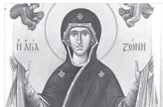
Пояс Пресвятой Богородицы прибывает на нашу землю

Утром 29 октября, ковчег со святыней побывет на территории в Ватопедском монастыре на Афоне, впервые доставили в Россию. С 27 по 29 октября ковчег со святыней будет выставлен в норильском соборе Всех Скорбящих Радость. Сразу по прибытии в северный город в храме состоится богослужение. Доступ верующих в дни пребывания Пояса Богородицы в Норильске будет круглосуточным. По словам священнослужителей, часть одежды, которую Богородица носила при жизни, обладает удивительной силой и помогает женщинам при рождении детей.