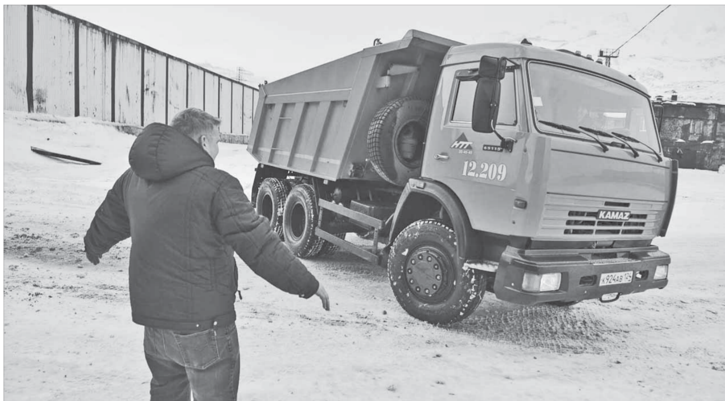
Управлять промышленным транспортом – дело ответственное