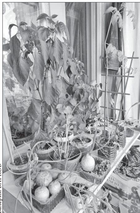
Огород в большом городе

Выросли в огороде и лук, и петрушка, и сельдерей, и кинза, и щавель. Последнего хватило на четыре кастрюли супа. У укропа появились хилые боковые побеги, зато зонтики получились богатые и особо ароматные. Пошли на закрутку заготовок на зиму. Редиска взошла только с треть-