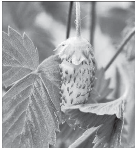
Самое вкусное – Аленке

– Просто земляника очень капризная. Я посеяла семена трех видов и держала их под прозрачной пищевой пленкой месяца полтора, пока росточки не стали сантиметром пять. Почти все семена, когда проращиваешь, надо