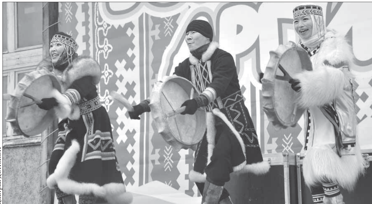
Ансамбль «Хэйро» – визитная карточка Таймыра – известен далеко за пределами нашего полуострова

Подробнее о том, как Норильск готовится встречать Большой аргиш, читайте в «ЗВ» на следующей неделе