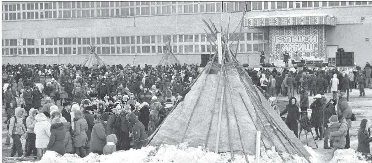
В этом году действие перенесут на Комсомольскую площадь