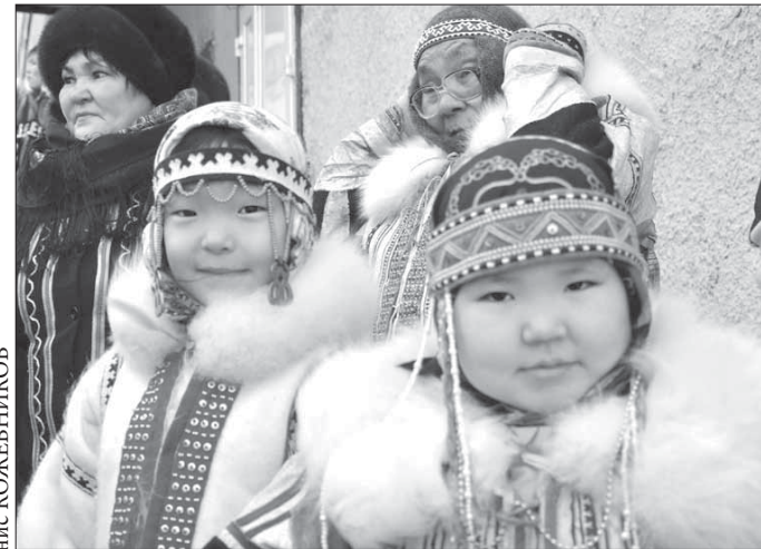
В одежде коренных народов многие элементы характерны только для одного этноса