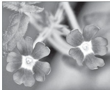
Вербена цветет и осенью

накрывать пленкой. Я не думала, что земляника будет уже в этом году, но она была. Я не опыляла, просто подую, подую на цветочек или дочку подует, и все. И за лето с двух кустов (третий позже посадила, поэтому только сейчас одна ягодка формируется) я собрала десять ягод – желтых и красных. Желтый сорт гораздо слаще и ароматнее.