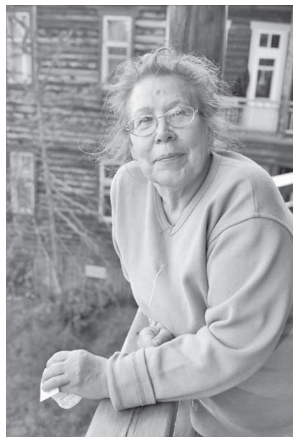
На Ламе все располагает к душевному отдыху

– Не знаю, мне трудно судить об этом. Одно могу сказать, что детство у нас, детей войны, было не из легких. Я из семьи репрессированных, папу посадили в Норильлаг как врага народа, а нас депортировали из Украины на Дальний Восток, в Амурскую область, в 1949 году. Мне тогда было шесть лет. Переселили только за то, что мы, украинцы, в годы оккупации оказались под немцами, а разве наша это была вина?! Везли нас на Восток в телячьих вагонах, много людей дорогой умерло. Я помню, как мертвых просто выбрасывали из вагонов, так страшно было, голод, холода, но мы сумели выжить, слава богу. А там, куда нас поселили, уже жили латыши, тоже депортированные из родных мест. Самые счастливые мои воспоминания связаны с теми годами ссылки. Какие люди нас окружали, интеллигентные, умные, образованные. Каким учителя у нас были необыкновенные (кстати, все из ссылкипоселенцев), как они старались привить нам любовь