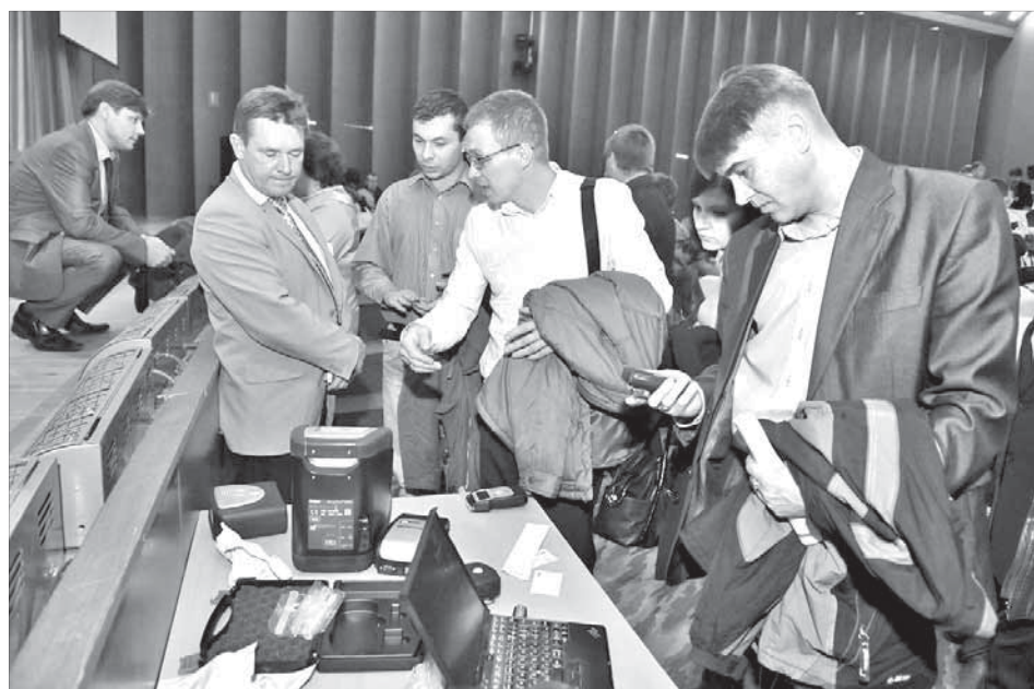
Новые приборы удобны, автономны и безошибочны