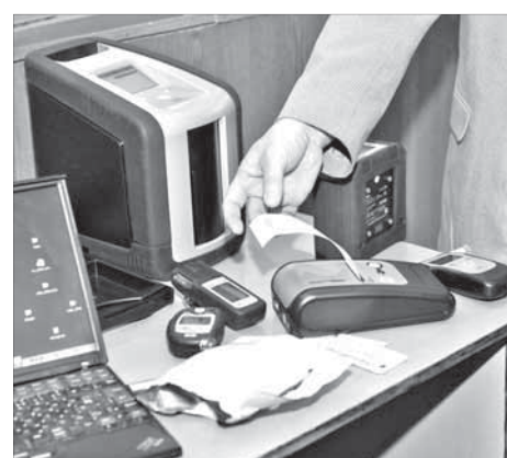
Показания приборов могут стать причиной увольнения

По данным начальника медико-инженерного отдела управления промышлен-