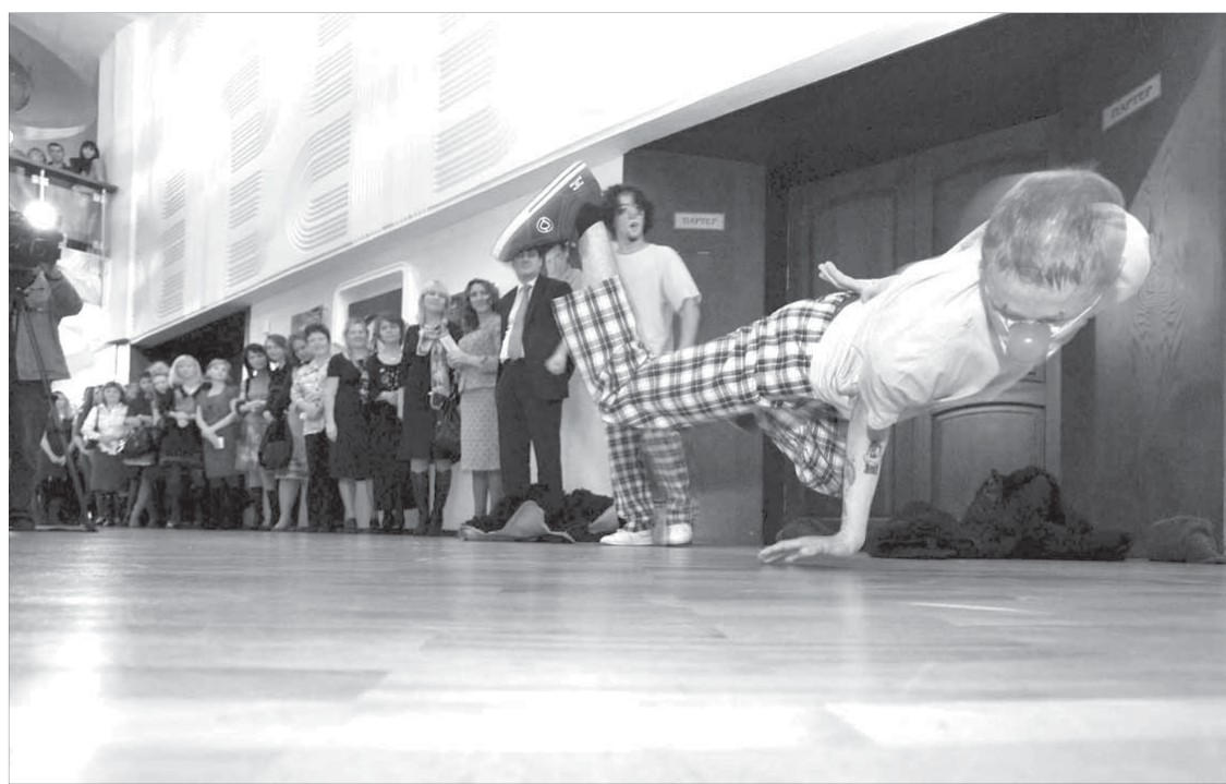
По модели площадного театра торжественное открытие фестиваля началось с театрализованного шествия молодых творческих сил города