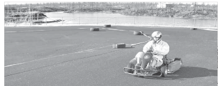
Умение преодолевать крутые повороты пригодится в армейской жизни

Итоги уже подведены: первое место – профессиональный лицей