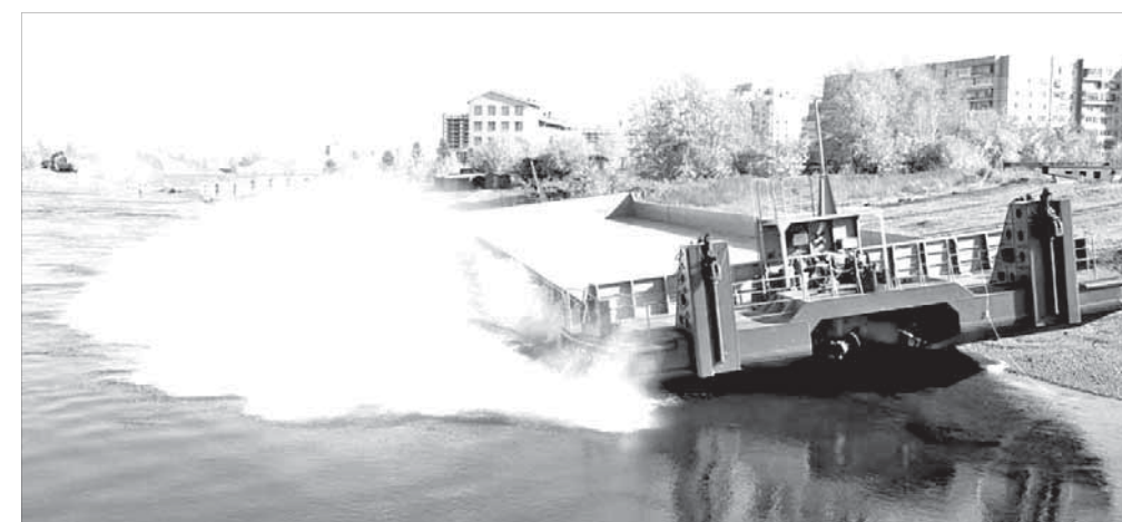
Баржа повезет нужные грузы на север Красноярского края

До конца этого года на Красноярской судовой верфи планируется подготовить к спуску на воду еще две баржи-площадки, сообщает пресс-служба ЕРП. Обновление флота является одной из главных задач пароходства, так как развитие транспортной инфраструктуры обеспечивает развитие не только предприятия, но и региона в целом, дает основу для реализации крупнейших инвестиционных проектов и жизнеобеспечения северных территорий края.