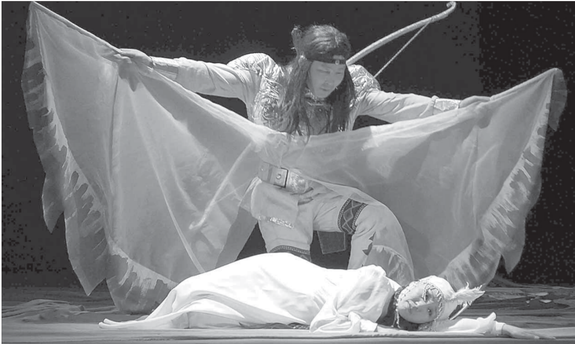
Спектакль учит доброте, бережному отношению к природе и женщине