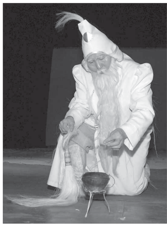
Языческая сказка покоряет и взрослых, и детей