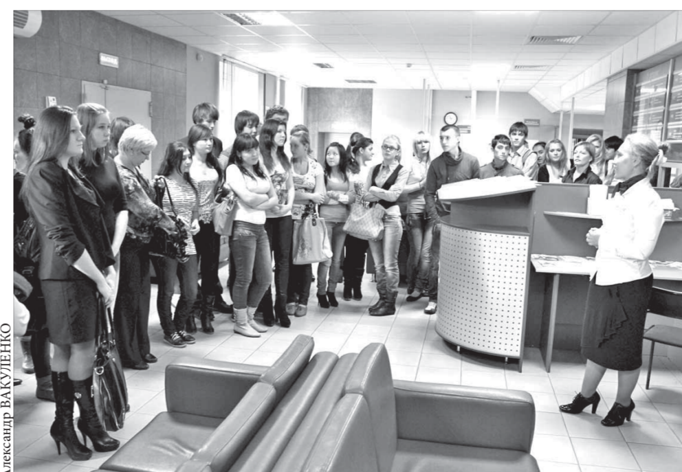
Пенсионный ликбез начинай смолоду

В управлении Пенсионного фонда РФ в городе Норильске прошел день пенсионной грамотности для старшеклассников.