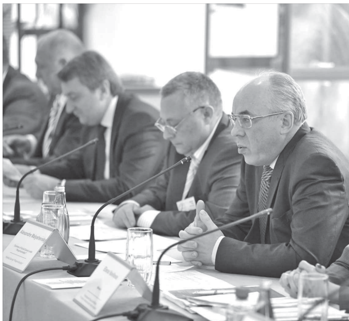
Александр Малышевский: "Партнерство государства и "Норильского никеля" дает положительные результаты"