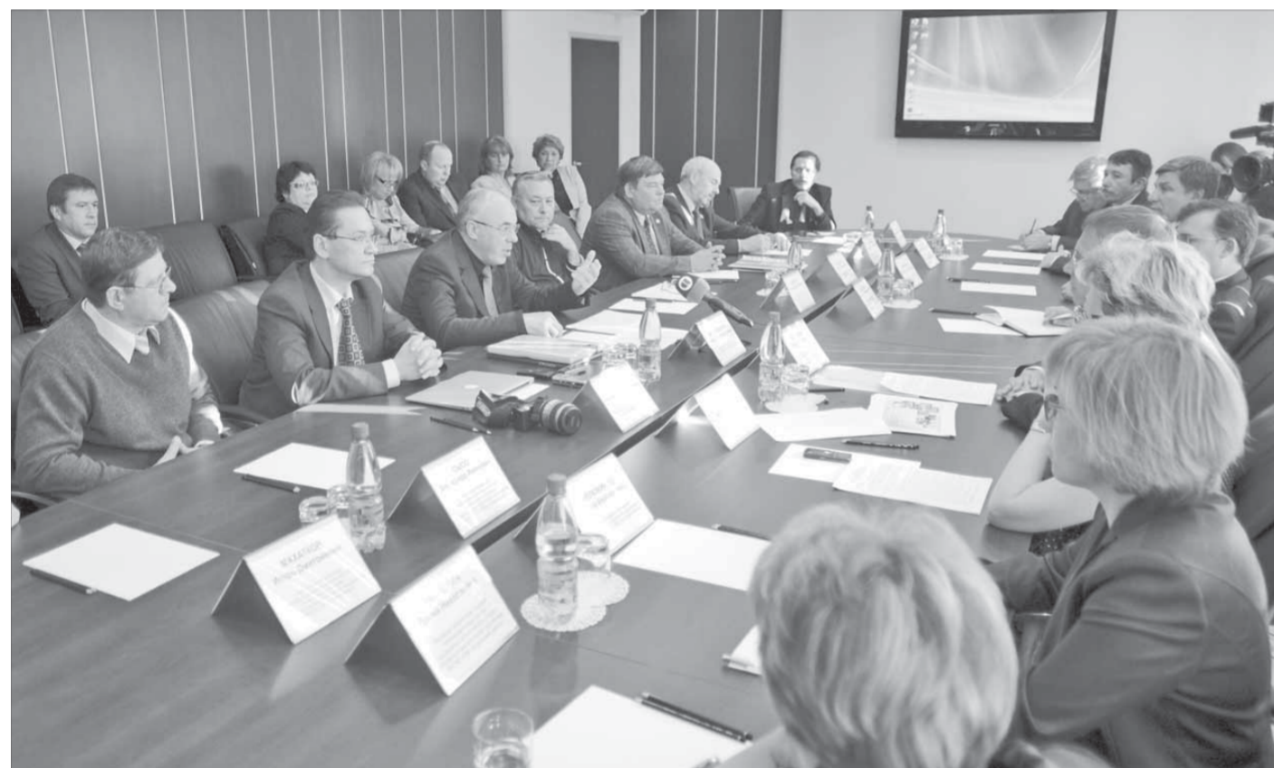
На заседании общественного совета обсудили экологический опыт "Норильского никеля"

Ежемесячно в газете "Заполярный вестник" и еженедельно в ТРК "Северный город" выходит "Экологический вестник" с информацией о качестве атмосферного воздуха в Норильске. По сравнению с 2006 годом в 2010 году суммарное время загрязнения Норильска снизилось в два раза (на 49,5%), время без загрязнения увеличилось на 18,6%.