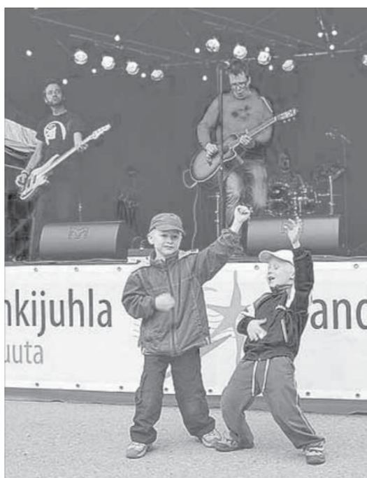
Расколбас не по-детски

– Откуда возникло такое название – «Грызуны»?