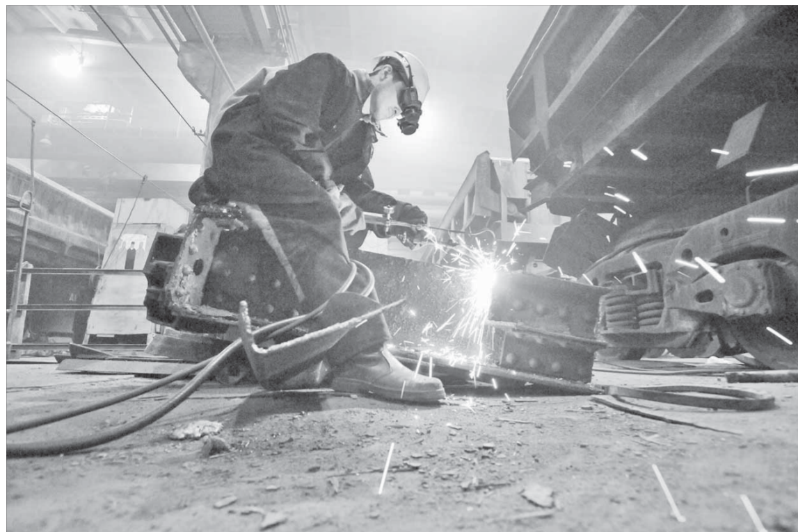
Главная черта ремонтников – компетентность