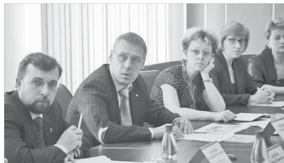
Вопросы экологии надо решать сообща