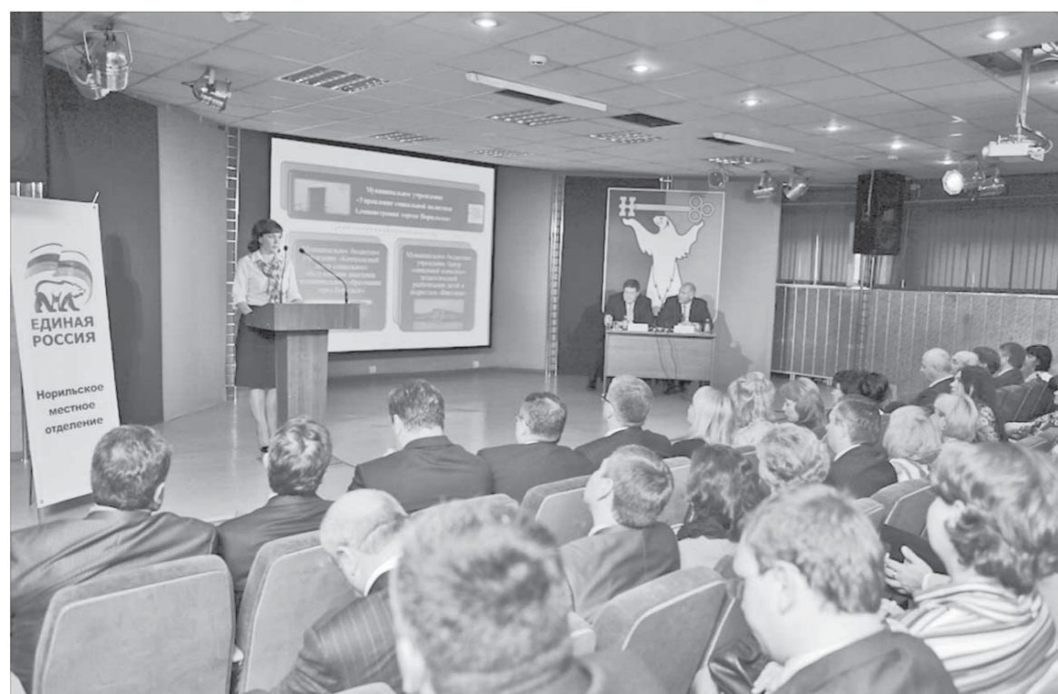
Главная тема дня: каким будет Норильск в 2020 году?