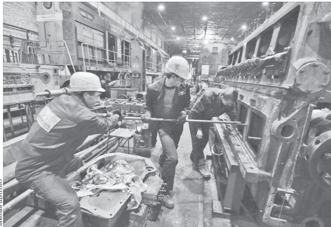
Коллектив ЦРПС делает одно дело

Все его механизмы и детали должны быть исправны. Именно в таком состоянии вагоны и локомотивы Норильской железной дороги покидают цех ремонта подвижного состава (ЦРПС) ПО "Норильсктрансремонт" ООО "Норильскинрельремонт".