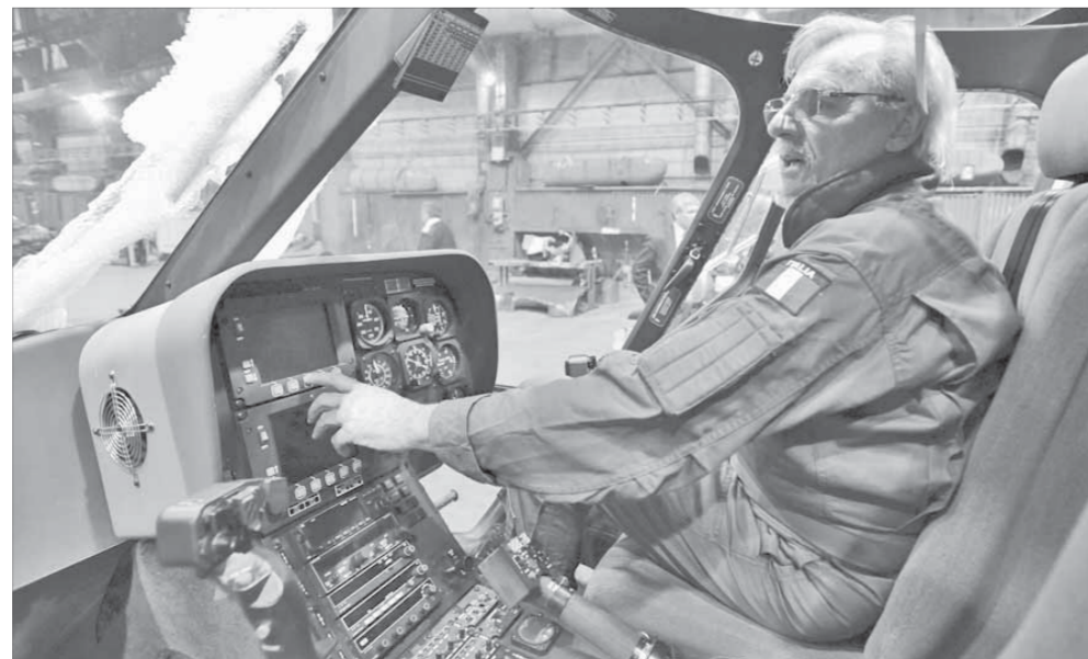
Большой машине нужна тонкая настройка

Потребность авиакомпании “Таймир” в вертолетах класса Ми-2 велика. Основные потребители полетов на этом типе воздушных машин – “Норильскгазпром”, “Таймыр-газ”, “Норильскгеология”. Зачастую геологам и газавикам нет нужды использовать мощный и грузоподъемный Ми-8, но есть необходимость перевести к месту выполнения работ персонал в количестве трех-пяти человек. Для этой цели лучше всего подходят вертолеты малого класса. Расход топлива на один летный час составляет у Ми-8 750 литров авиационного керосина, у Ми-2 – 300 литров, итальянец AW119Ke расходует всего 180. При этом мощность его двигателя – 1002 лошадиных силы, тогда как суммарная мощность двух двигателей Ми-2 составляет всего 700. Превосходит итальянец своего одноклассника Ми-2 и по пассажироместности, и по грузоподъемности. AW119Ke может перевозить семь человек, не счита-