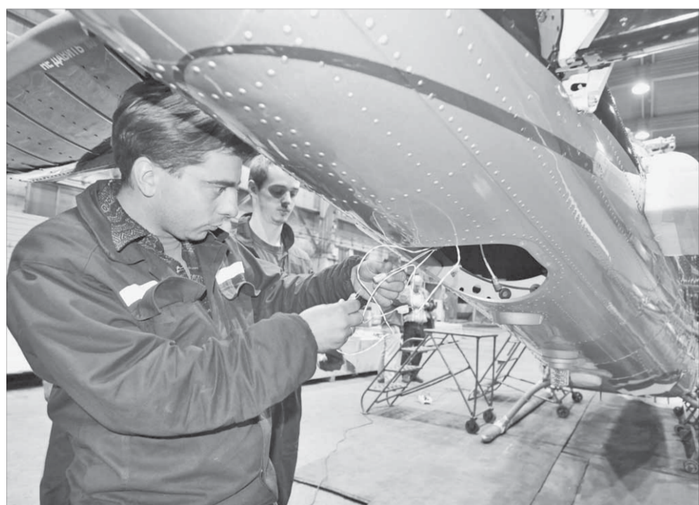
У президента США такой же вертолет

– Вы упомянули рыночную ситуацию, конъюнктуру мирового рынка никеля, да и не только никеля, а еще и меди, и палладия – основных металлов, которые вы производите. Как вы оцениваете текущую ситуацию? Все-таки на рынках чувствуется нестабильность, и если раньше цена никеля была примерно 25 тыс. за одну тонну, и она достаточно долго держалась, то сейчас уровень несколько иной.