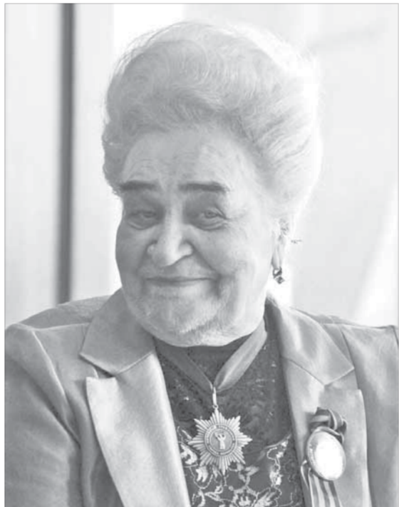
Она никогда не теряет оптимизма

Труженица великая. Потому и в отпуск много лет не ездила. Боялась оставить своих ветеранов без присмотра. Но по случаю юбилея все же поз-