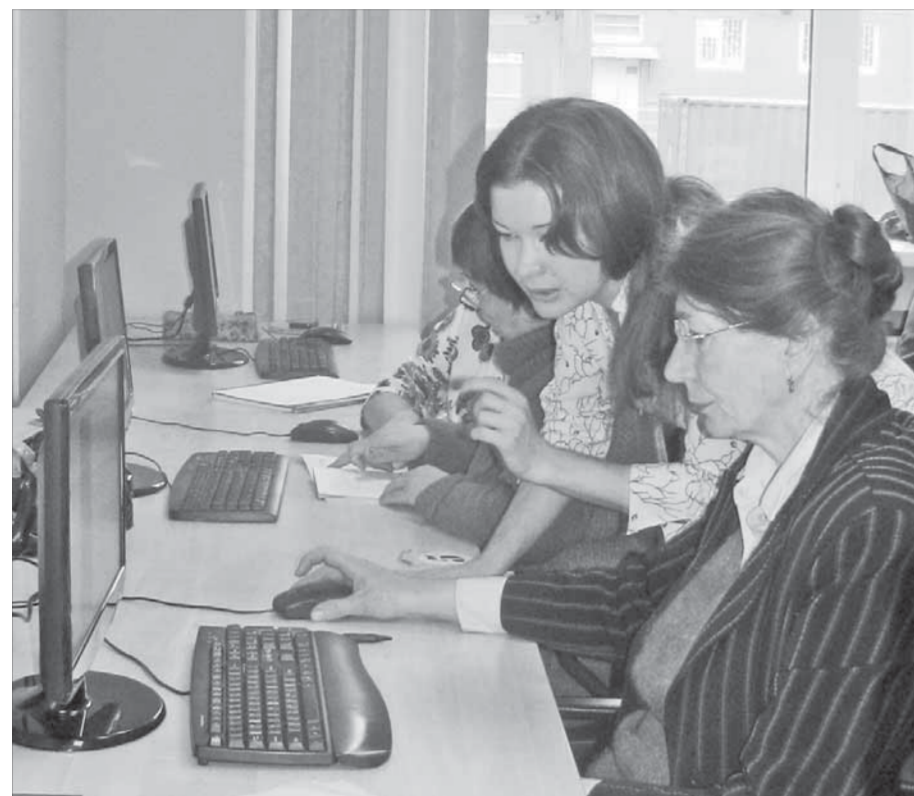
Не за горами покупки в интернет-магазинах

Тот факт, что в библиотеках Норильска проводят курсы компьютерной грамотности для пожилых людей, уже не новость для жителей нашего города. Несмотря на то что проекту "60+ ПК" уже почти год, поток желающих принять в нем участие не иссякает до сих пор.