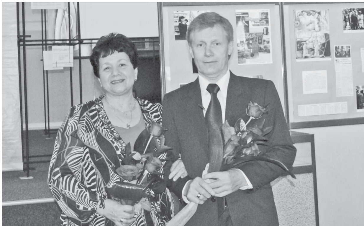
На награждении в День медицинского работника