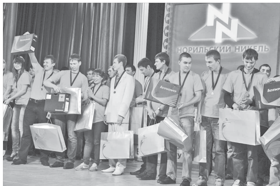
Золотые призеры НЛА-2011 – команда Г'NN