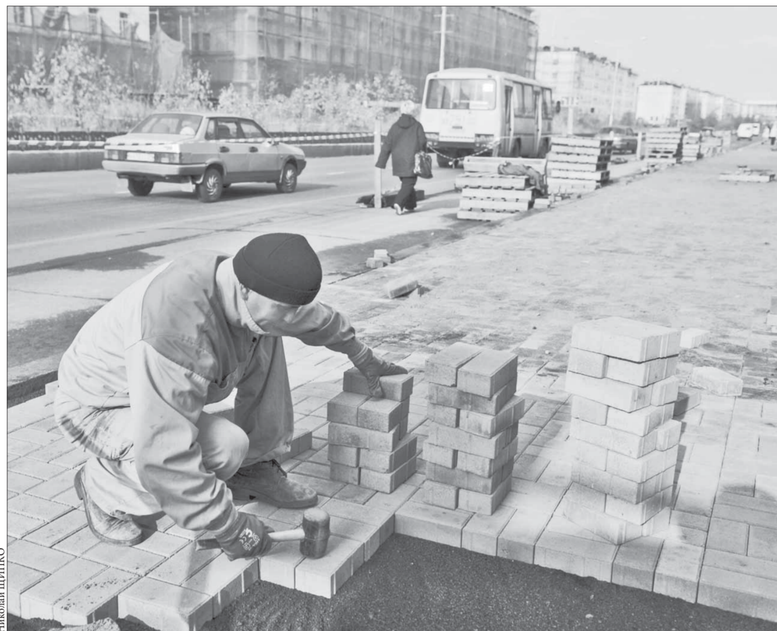
Подрядчики ремонтируют отдельные участки тротуара

17 сентября на лыжной базе "Оль-Гуль" пройдет фестиваль молодежных игр. Фестиваль – это встреча любителей всевозможных полигонных и настольных игр после летних каникул, а также привлечение новичков к активному образу жизни. В рамках фестиваля планируется закрытие сезона игры "Дозор-классик", открытие сезона "Дозор-лайт", игра "48 часов", игротка настольных игр от "Необычных людей" и "Мосигры" (будет гигантский твистер!), клуб игры "Мафия", конкурсы, выступления, музыка и хорошее настроение. Начало фестиваля в 13.00. Вход свободный.