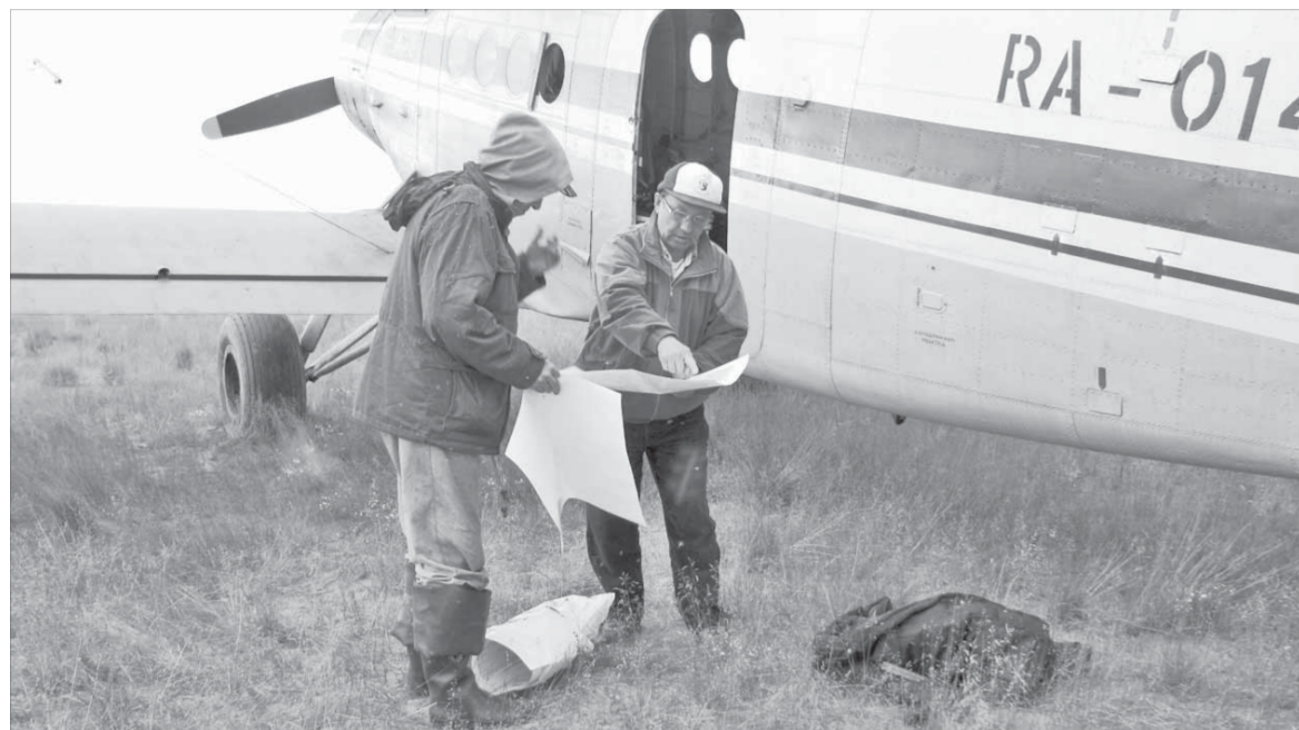
Малая авиация существенно облегчает работу ученых