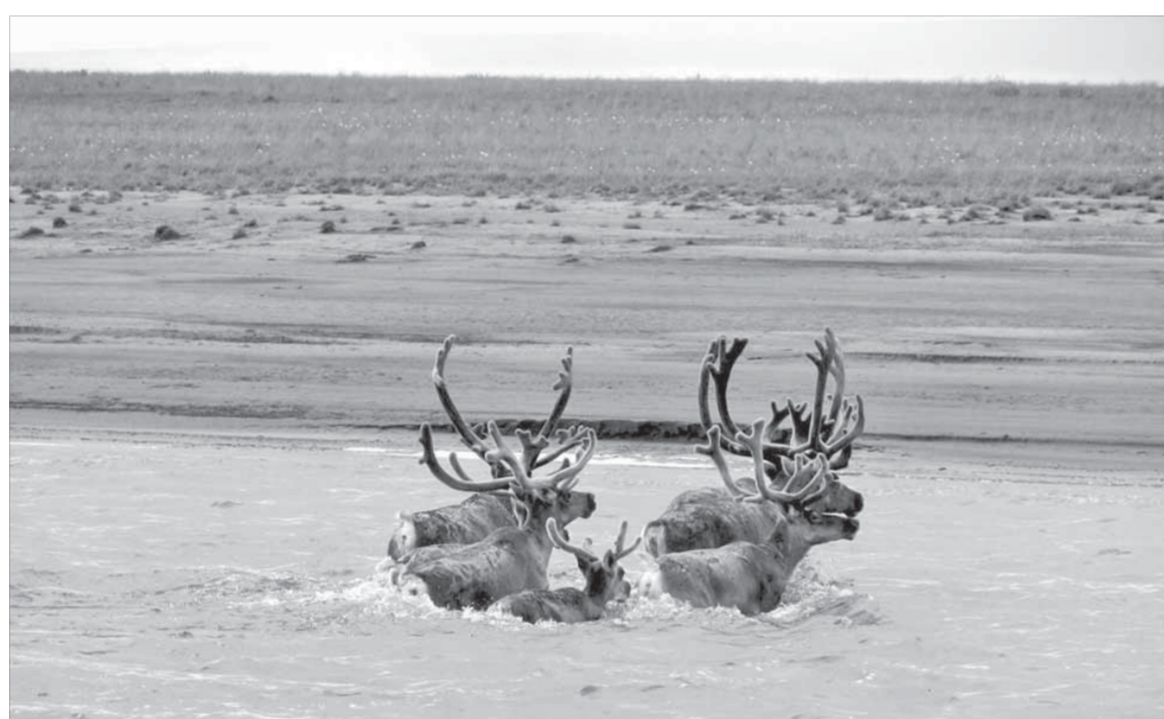
Первыми форсируют реку самые сильные самцы

– Да, численность популяции оленей во всем мире снижается. Некоторые эксперты связывают это с изменениями климата, некоторые – с антропогенным влиянием человека.