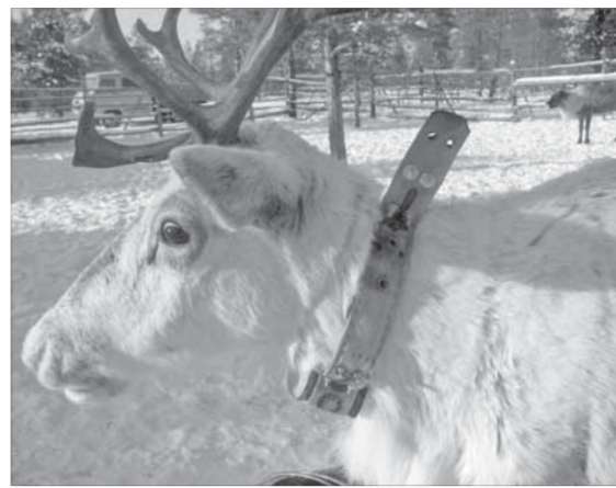
Олень с “радиоколь”

В Норильске в конце августа и начале сентября наблюдался подъем заболеваемости ОРВИ среди малышей до двух лет. По остальным возрастным группам в городе и крае в целом эпидемическая ситуация по заболеваемости острыми вирусными инфекциями и гриппом ниже эпидемического порога. По прогнозам краевых медиков, начало сезонного эпидемического подъема заболеваемости гриппом и ОРВИ следует ждать только в январе 2012 года.