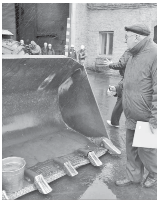
Жюри благожелательно, но придирчиво

этой части ЕР собирала мнения людей о том, какие объекты в городах и районах края нужно построить или реконструировать. Аккумуляировать все пожелания, органы местного самоуправления должны были оценить предложения, составить свои программы, чтобы получить средства из краевой казны под самые необходимые проекты.