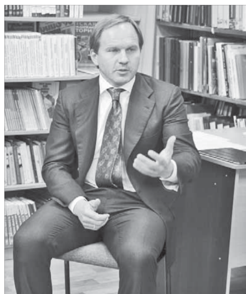
Обсудили самые важные вопросы