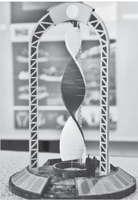
Арочная композиция Бориса Палая

Все конкурсные работы с 27 августа экспонируются на выставке в Музее истории освоения и