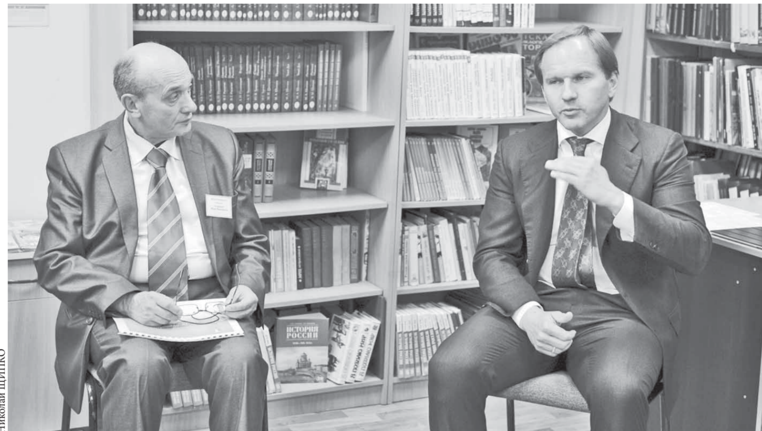
Лев Кузнецов: "Образование должно быть на высоте"

Министр природных ресурсов и лесного комплекса Красноярского края Елена Вавилова призвала население края сообщать о несанкционированных свалках. Пожаловаться на несанкционированную свалку мусора с 1 сентября можно будет по телефону горячей линии (391) 211-35-10 с 9.00 до 18.00. Елена Вавилова призвала также сообщать информацию на ее личную страничку Twitter по адресу: twitter.com/Vavilova24. "Каждый звонок от жителей будет рассматриваться индивидуально, – заявила министр. – Однако следует понимать, что это очень серьезный пласт работы. Для наведения порядка на территории усилий наших специалистов может не хватить. В таком случае к наведению порядка будут привлекаться структуры, ответственные за уборку мусора на местах, а специалисты ведомства возьмут это на контроль". Создание горячей линии – один из шагов в реализации краевой программы по ликвидации несанкционированных свалок и созданию условий для переработки мусора.