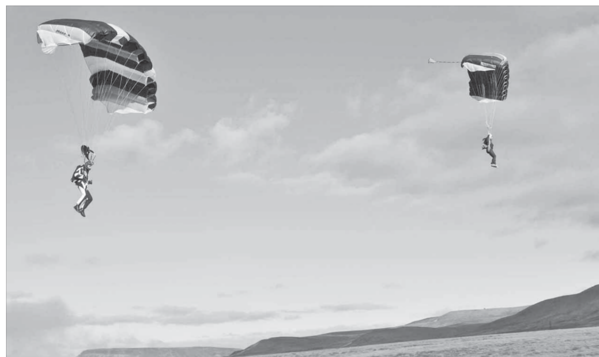
Икар бы позавидовал этим парням