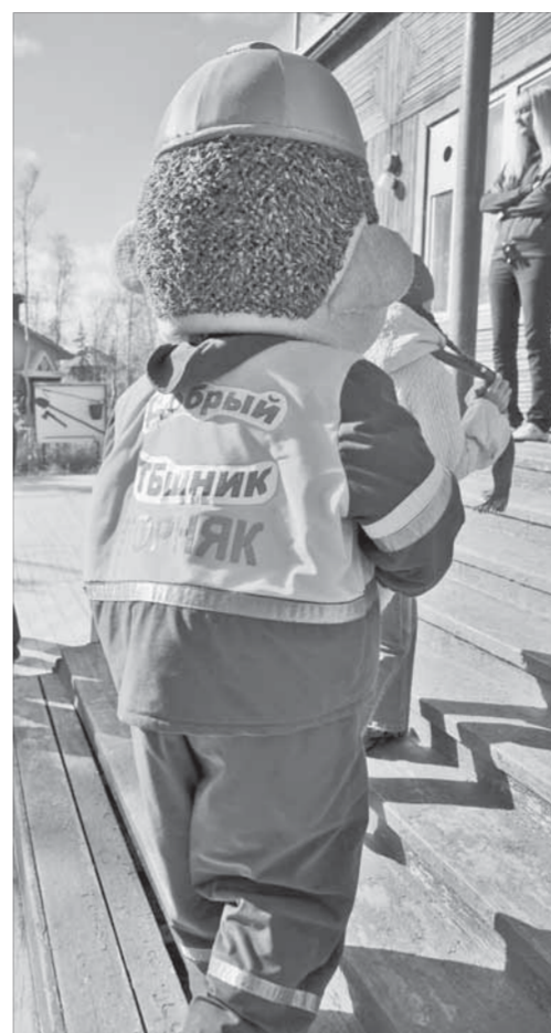
...и не только в праздник

Собравшихся встречает ростовая кукла с надписью “Добрый тэбэшник”, всем вручаются “книжки ответственности за хорошее