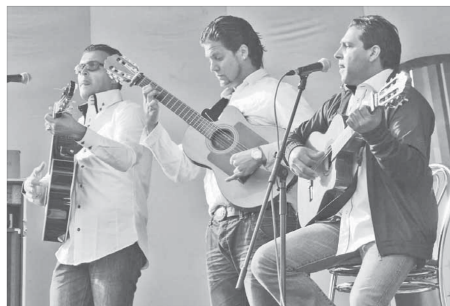
Горячие французские цыгане

Уникальность группы Gipsy Kings, их жизнерадостность, а также заводные хиты сделали свое дело. Народ ликовал и танцевал под веселые мотивы, даже дождь талнахам помехой не стал. В отличие от выступления в Норильске, где праздник проходил по-семейному, здесь публика была более раскованна – и в действиях, и в выражениях. Группе Gipsy Kings даже предложили сыграть русскую “Мурку”. Просьба, к счастью, осталась без ответа. Концерт длился около часа, отыгран был блестяще. Тепло попрощались со всеми своими поклонниками, участники Gipsy Kings пообещали при случае вернуться в наш город.