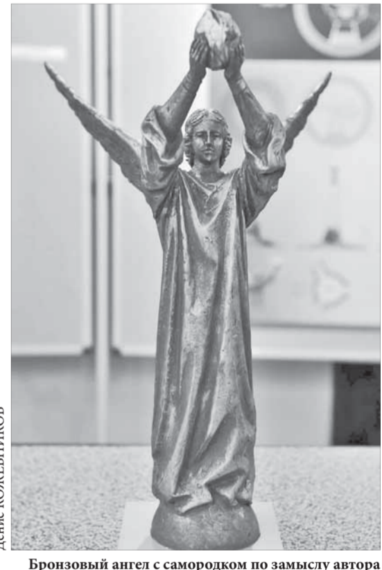
Бронзовый ангел с самородком по замыслу автора символизирует богатство Норильска