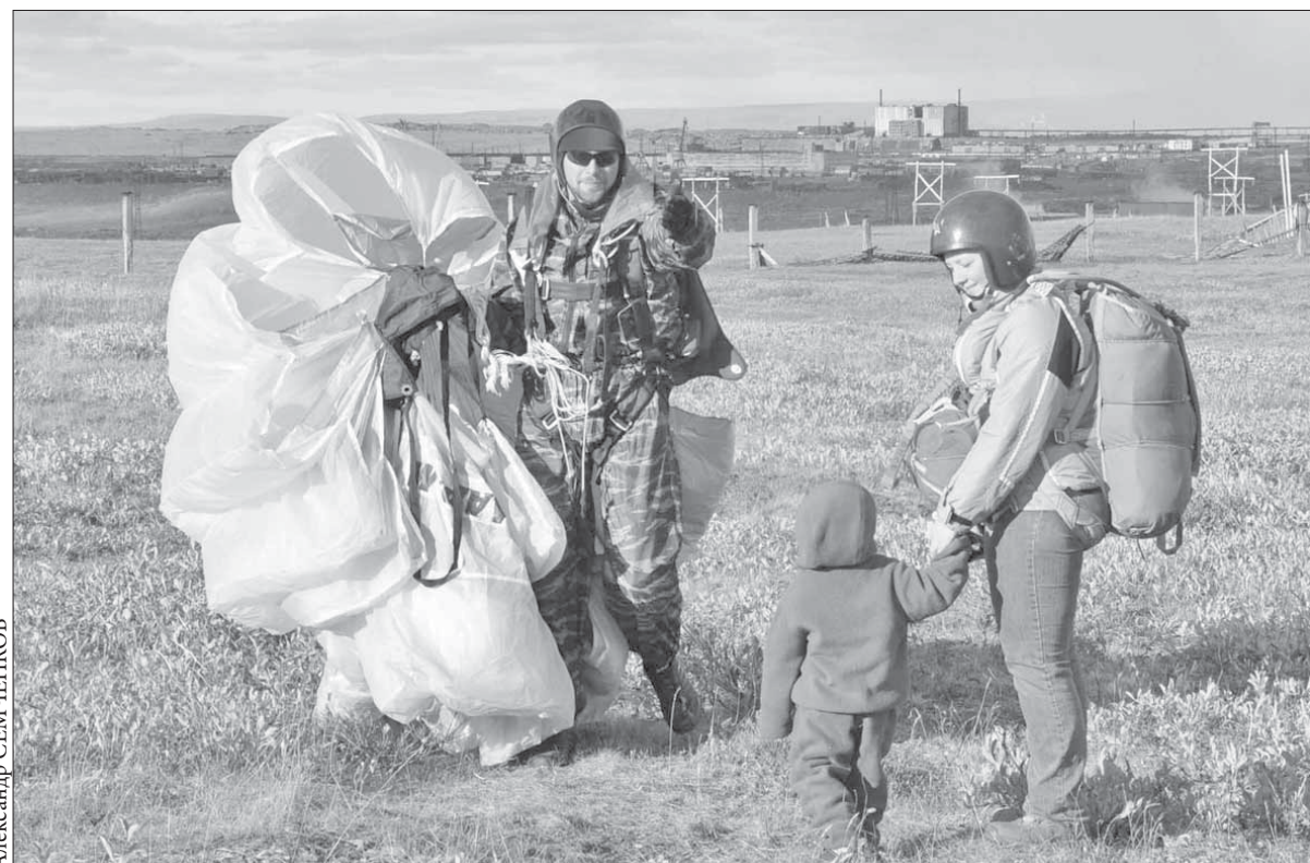
Парашютистов с теплом встречают на земле

Курс акций ОАО "ГМК "Норильский никель" – 7028 рублей. ОАО "Полюс Золото" – 1770 рублей.