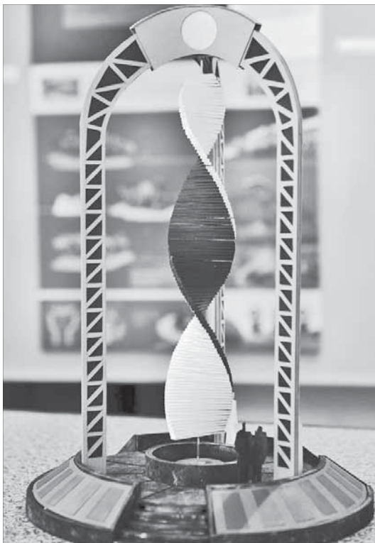
Аронная композиция Бориса Палая

Все конкурсные работы с 27 августа экспонируются на выставке в Музее истории освоения и