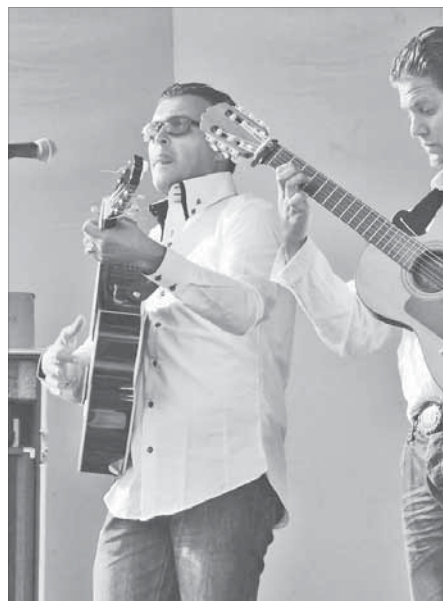
Горячие французские цыгане

Уникальность группы Gipsy Kings, их жизнерадостность, а также заводные хиты сделали свое дело. Народ ликовал и танцевал под веселые мотивы, даже дождь талнахам помехой не стал. В отличие от выступления в Норильске, где праздник проходил по-семейному, здесьняя публика была более раскованна – и в действиях, и в выражениях. Группе Gipsy Kings даже предложили сыграть русскую “Мурку”. Просьба, к счастью, осталась без ответа. Концерт длился около часа, отыгран был блестяще. Тепло попрощались со всеми своими поклонниками, участники Gipsy Kings пообещали при случае вернуться в наш город.