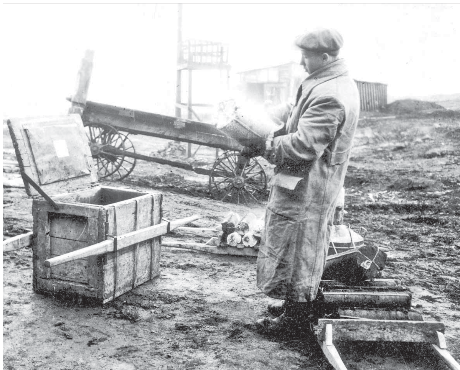
Так выглядела площадка окислительного завода, пущенного в Норильске в годы войны