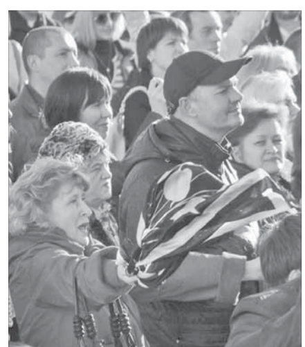
Зритель был доволен

Погода на радость всем была ясная и солнечная, легкий холодный ветерок не в счет. В ожидании концерта северяне заполнили всю площадь. Каждый хотел увидеть легендарных музыкантов вживую.