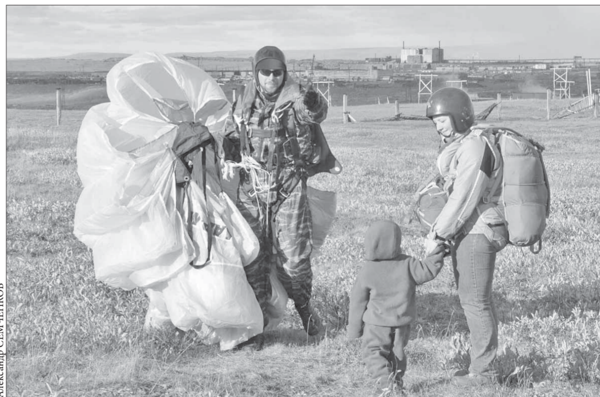
Парашютистов с теплом встречают на земле

Курс акций ОАО "ГМК "Норильский никель" – 7028 рублей. ОАО "Полюс Золото" – 1770 рублей.