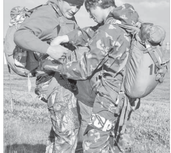
Помогать товарищу – для парашютиста закон

Первая группа, приземляясь, радует взгляд различными пируэтами. После отделения от вертолета