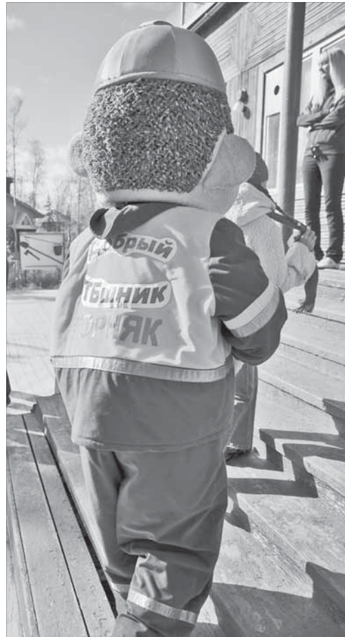
...и не только в праздник

Собравшихся встречает ростовая кукла с надписью “Добрый тэбэшник”, всем вручаются “книжки ответственности за хорошее