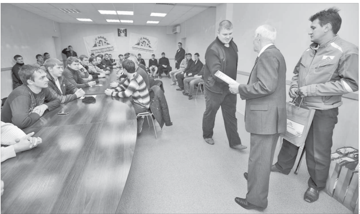
Заслуженную благодарность принимать приятно