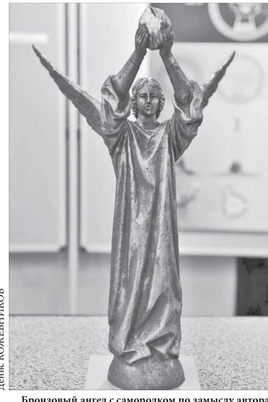
Бронзовый ангел с самородком по замыслу автора символизирует богатство Норильска