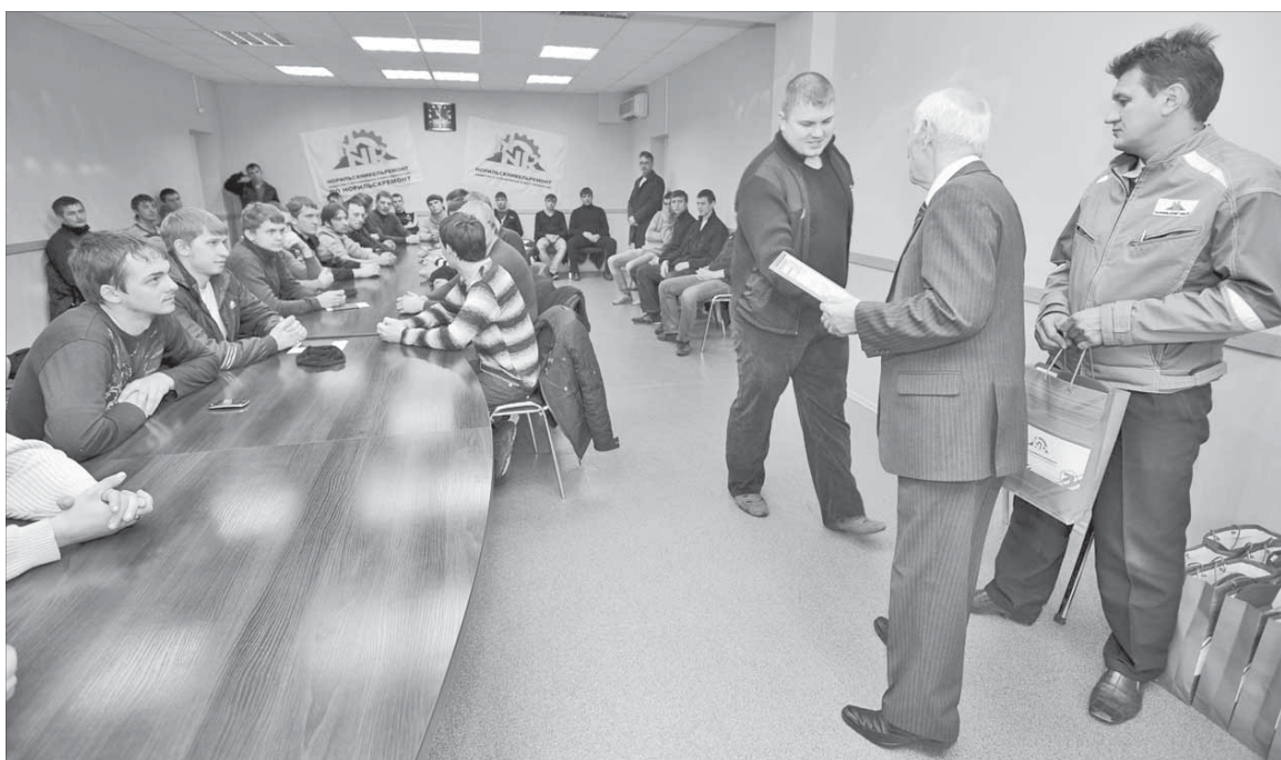
Заслуженную благодарность принимать приятно