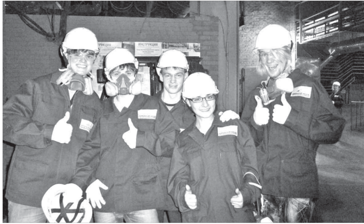
Выпускники НИИ востребованы на комбинате

Создан и работает координационный комитет по взаимодействию НИИ с компанией, администрацией Норильска, центром занятости населения в области совершенствования структуры и системы подготовки дипломированных специалистов и привлечения выпускников института на работу в компанию.