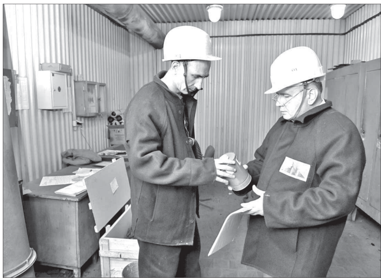
В чем проблема, должны выяснить специалисты

В начале января этого года на металлургические предприятия Заполярного филиала поступила пробная партия фильтрующих коробок, разработанная по заказу компании "Норильский никель" Электростальским научно-производственным объединением "Неорганика". Уже в апреле-мае специалистам завода-изготовителя были направлены акты о результатах эксплуатации фильтров. Как выяснилось, претензии к качеству продукции есть у рабочих и медного, и никелевого заводов.