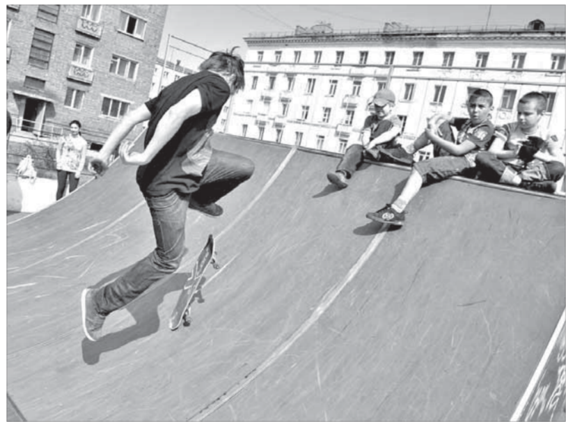
Ощущение полета у каждого свое

Праздники когда-нибудь заканчиваются. Подошел к завершению и молодежный. Но те, кто молод душой, всегда найдут время для веселья. Потому что уверены: танцевать нужно, пока звучит музыка, и улыбаться – пока весело.