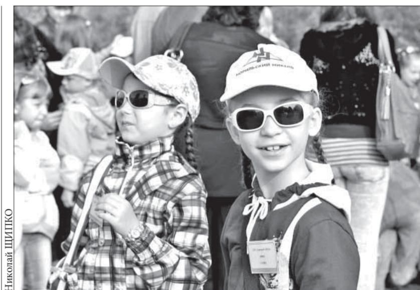
Поездка обещает быть увлекательной