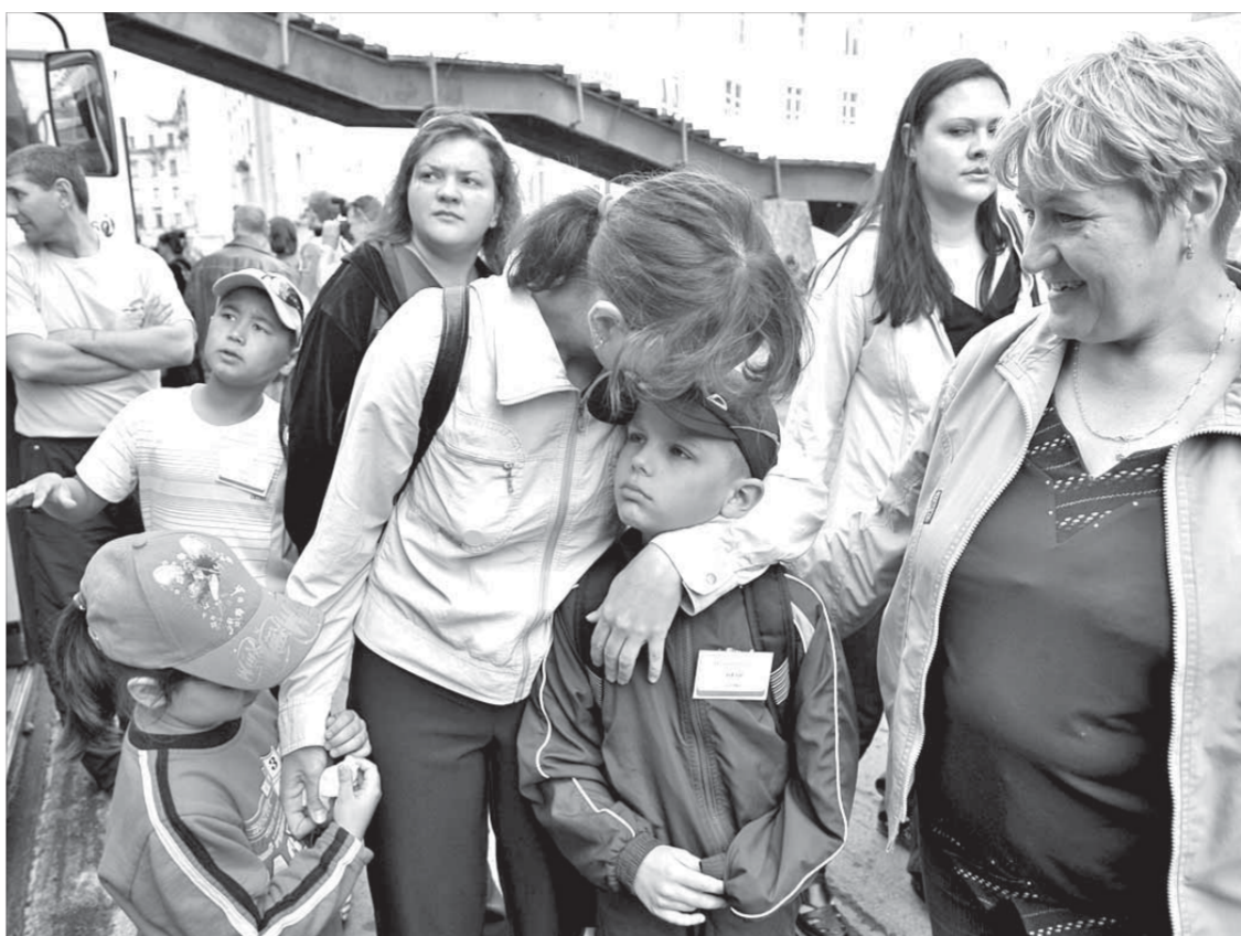
Грустный момент перед веселым отдыхом