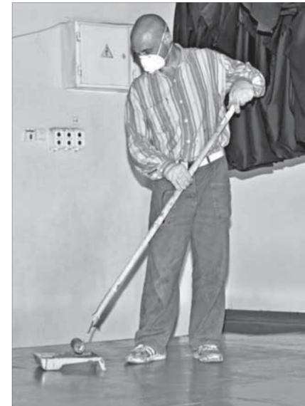
Работа не стоит на месте