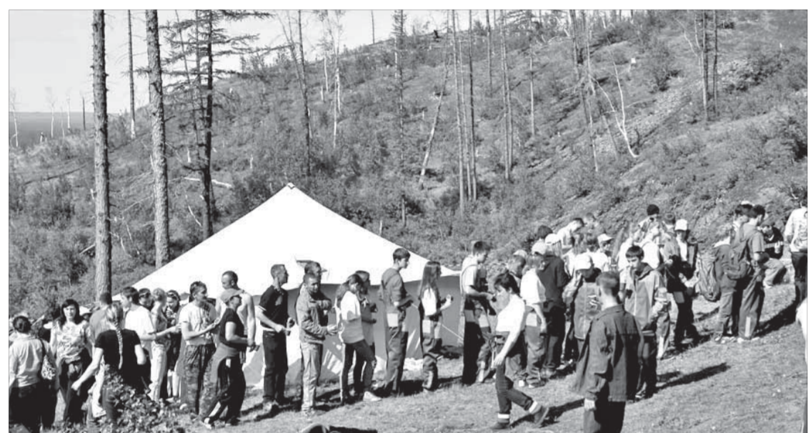
В тундре нужна дисциплина

Претенденты на президентский пост должны определиться до 17 июля. Выборы нового главы республики назначены на 26 августа. До этого времени обязанности главы Абхазии будет исполнять вице-президент Александр Анкваб.