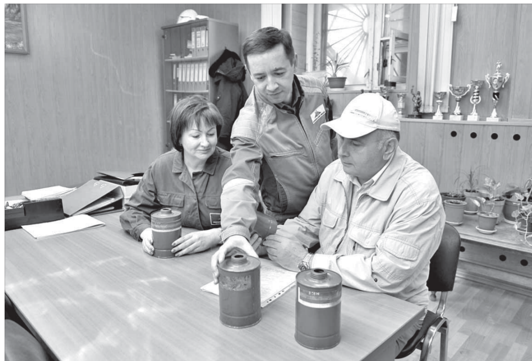
Новые разработки требуют доработки