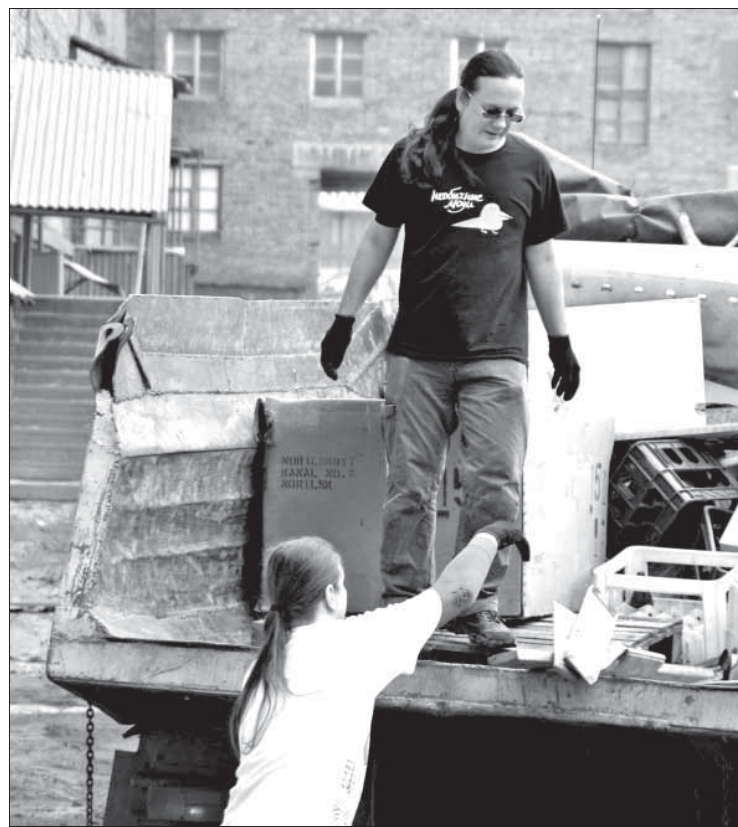
“Необычные” обустривают свой новый дом

Молодежь, рассчитывающая когда-нибудь вселиться сюда, вносит посильную лепту. Около 30 человек пришли, чтобы соб-