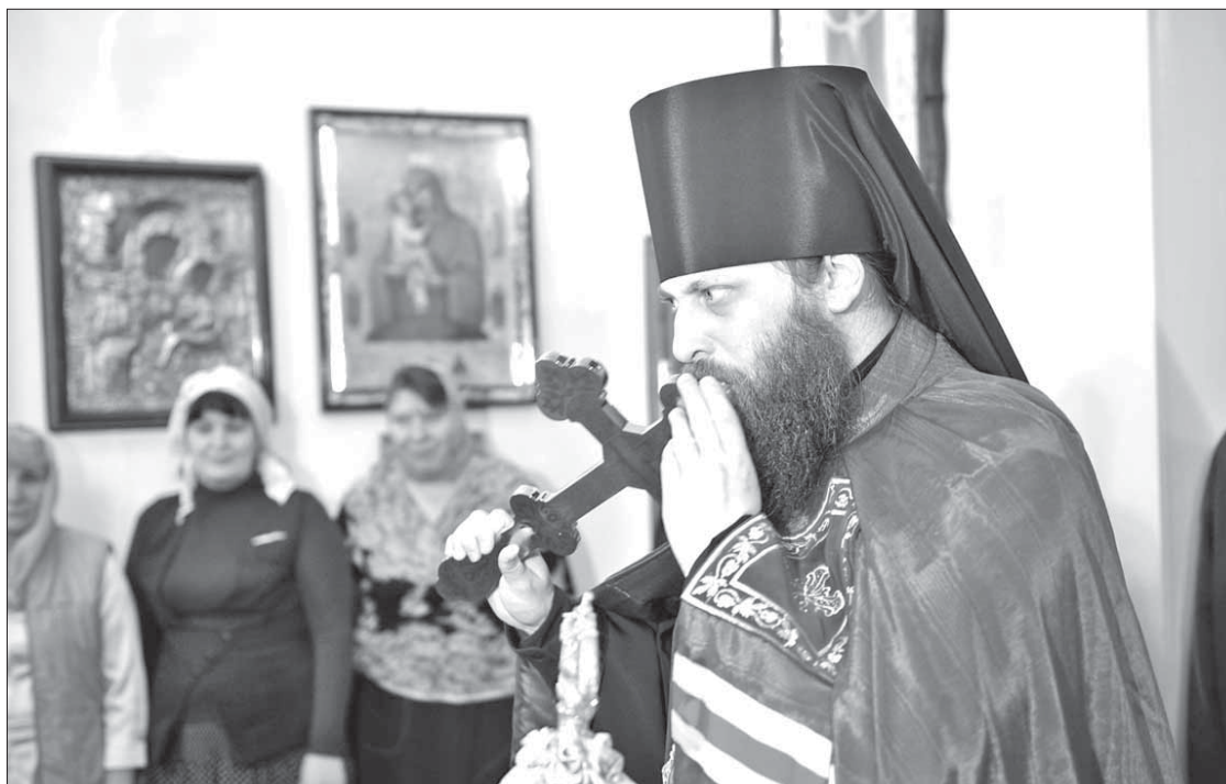
“Главное, чтобы каждый человек нашел дорогу в храм”