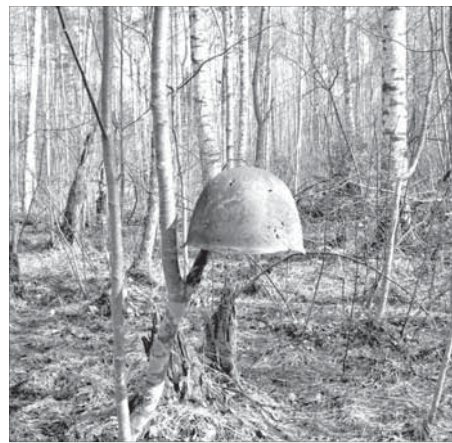
Каска на дереве – знак, что здесь нашли останки

– Когда находишься в болотах, где ночью какой-то потусторонний свет, тени, полутени, возникает чувство, что они действительно поднимаются и идут в сторону немецких позиций.