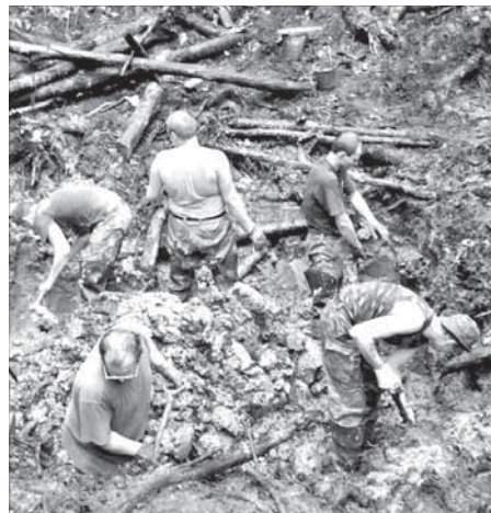
Работа не для белоручек

– Вы же понимаете, что человеческие кости – их в перчатках не найдешь. А в болотах в апреле-мае вода ледяная. И чтобы все это копать голыми руками по 10–12 часов в сутки, надо элементарно хотеть это делать. Кроме того, дети тех мест, где шла война, отличаются от наших. Восприятие того, что им рассказывали бабушки и дедушки, понимание, что если бы бабушка или дедушка не были в те годы маленькими и ушли на фронт, то их самих могло бы не быть, накладывает на