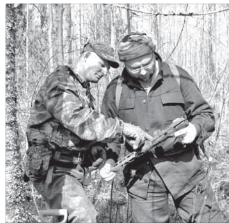
Все найденное оружие и боеприпасы – мины, пули, снаряды – обезвреживают

ОТ РЕДАКЦИИ. Поисковая работа в основном ведется на личные средства участников экспедиций. Изредка им помогают спонсоры. Если кто-то из местных предпринимателей хочет поддержать вахту памяти, можно обратиться в Союз ветеранов афганской войны и локальных конфликтов, под эгидой которого создан поисковый отряд “Норильск”. Адрес: ул. Севастопольская, 7, кабинет 226. Телефоны 8-913-505-81-44 или 8-923-203-11-02.