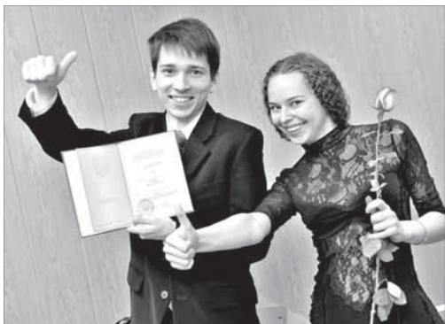
Настрой – отличный!

Дипломы выпускникам Норильского индустриального института, окончившим вуз с отличием, вручали руководители Заполярного филиала и города.