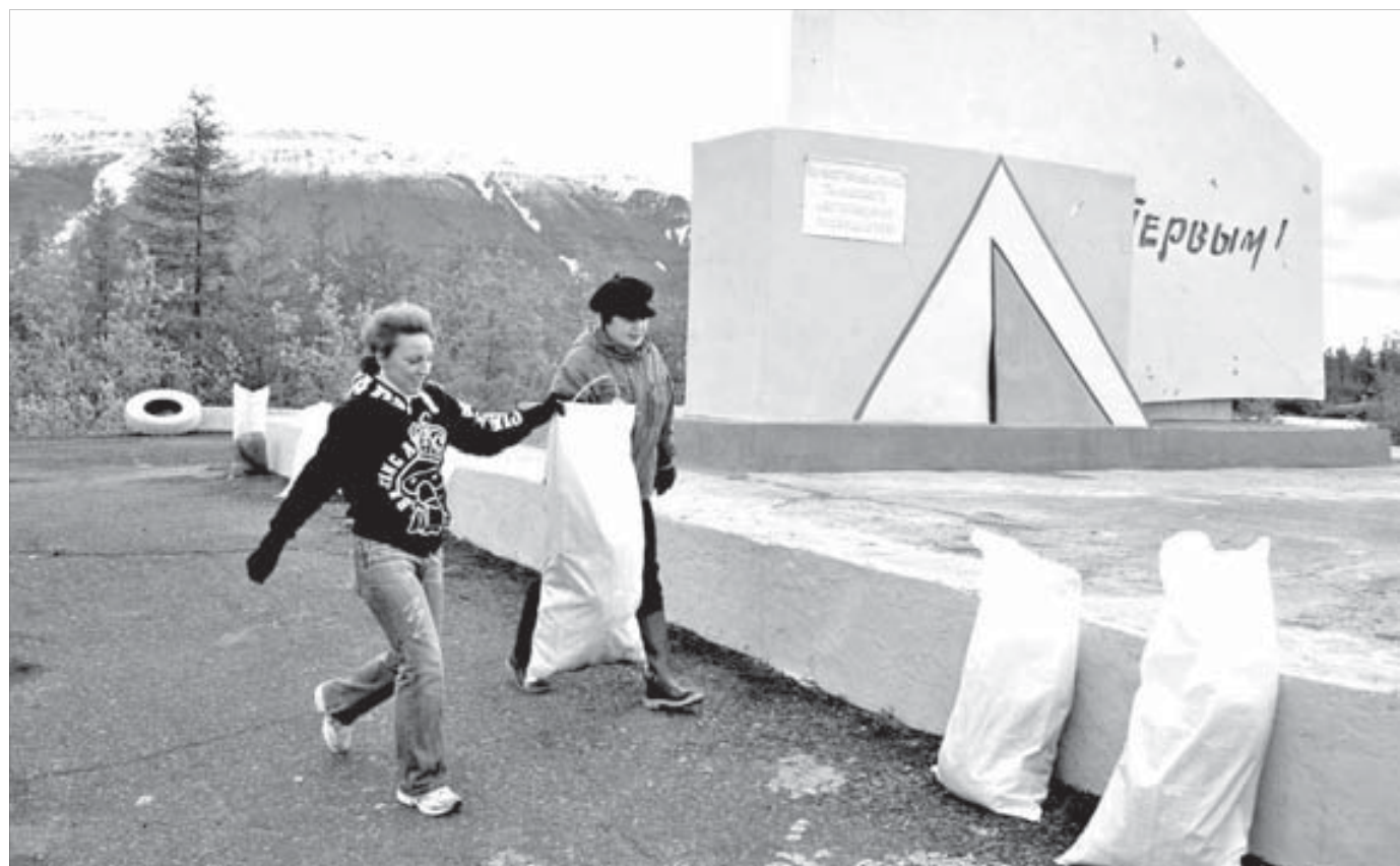
Чистота – уважение к памяти

Сотрудники управления промышленной безопасности Заполярного филиала решили взять на себя еще одну функцию – охрану исторической памяти. Выбрали подходящий объект – памятник Первым у Талнаха, где в минувшую субботу провели субботник. Приглашают присоединиться к почину все подразделения "Норильского никеля".