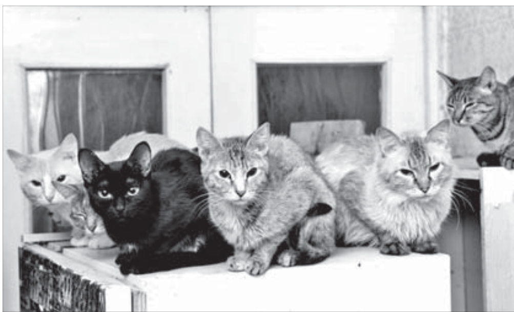
Они не хотят зла. Они хотят есть