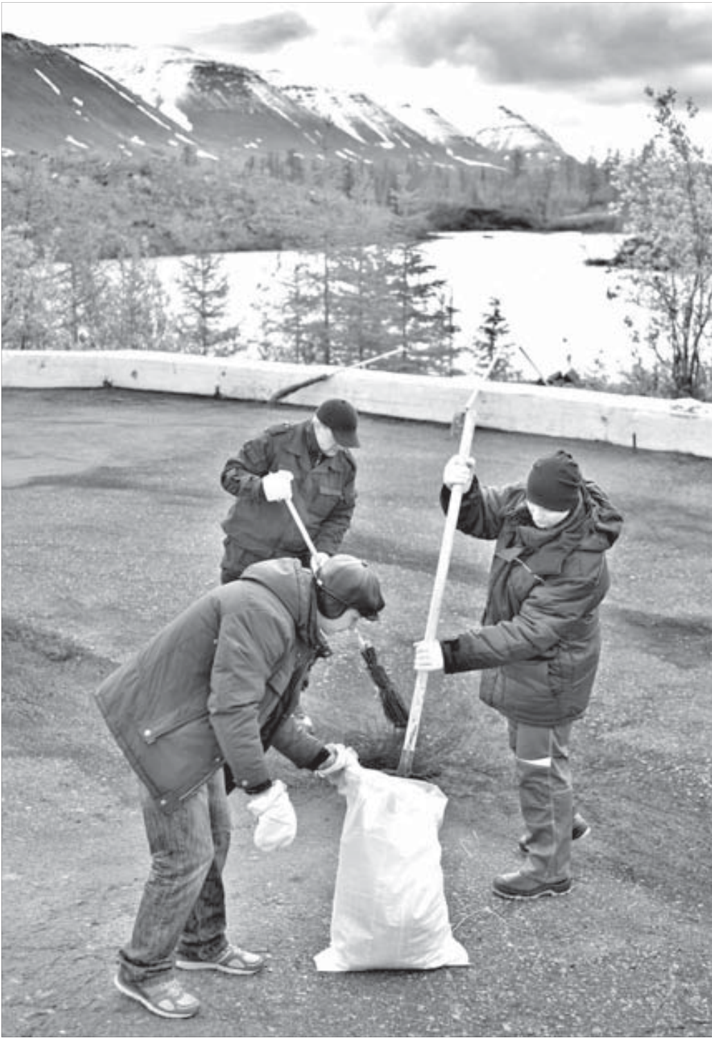
Вид с площадки памятника открывается чудесный