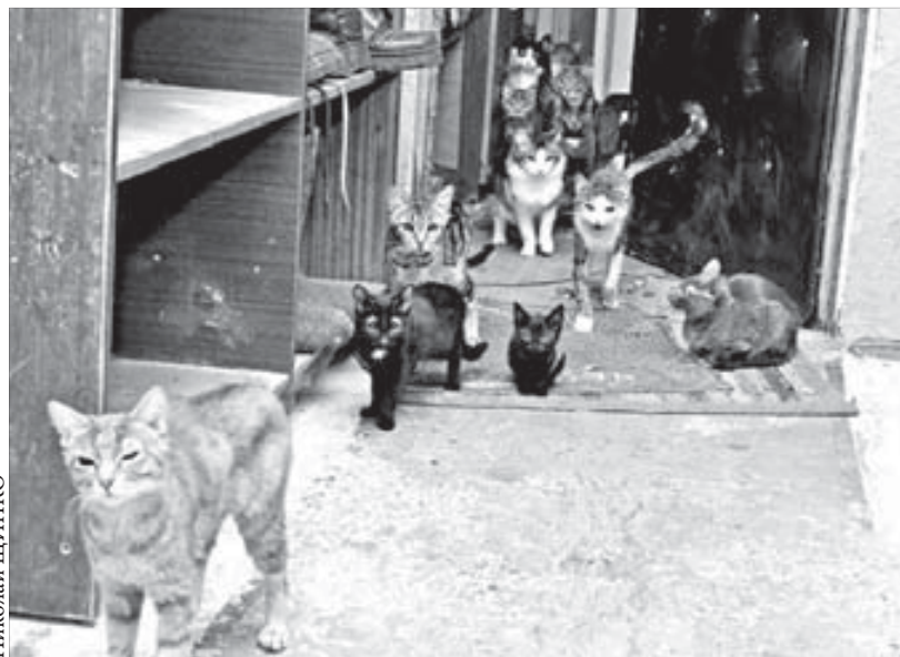
Очевидно, гостям здесь рады

Новость о том, что в квартире вместе с людьми проживает 150 кошек, любой здравомыслящий человек посчитал бы преувеличением. Согласитесь, даже десять животных в расчете на среднюю жилплощадь создают дискомфорт. Однако именно цифра 150 прозвучала от жильцов одного из подъездов дома на Дудинской, 13. Люди, позвонившие в редакцию, негодовали по поводу антисанитарных условий, вызванных нездоровым пристрастием одного из соседей к кошкам. Прибыв по адресу, корреспонденты "Заполярного вестника" были потрясены.