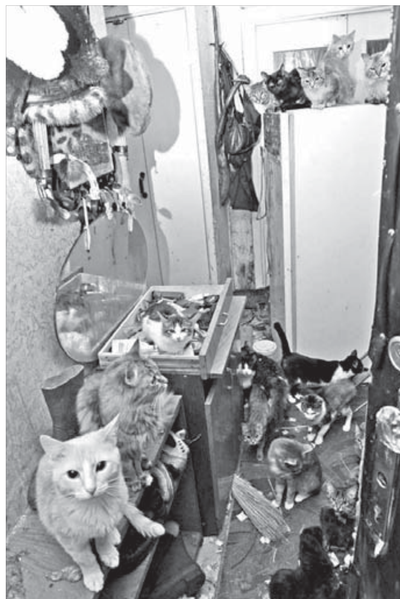
Свежих следов человека мы не обнаружили