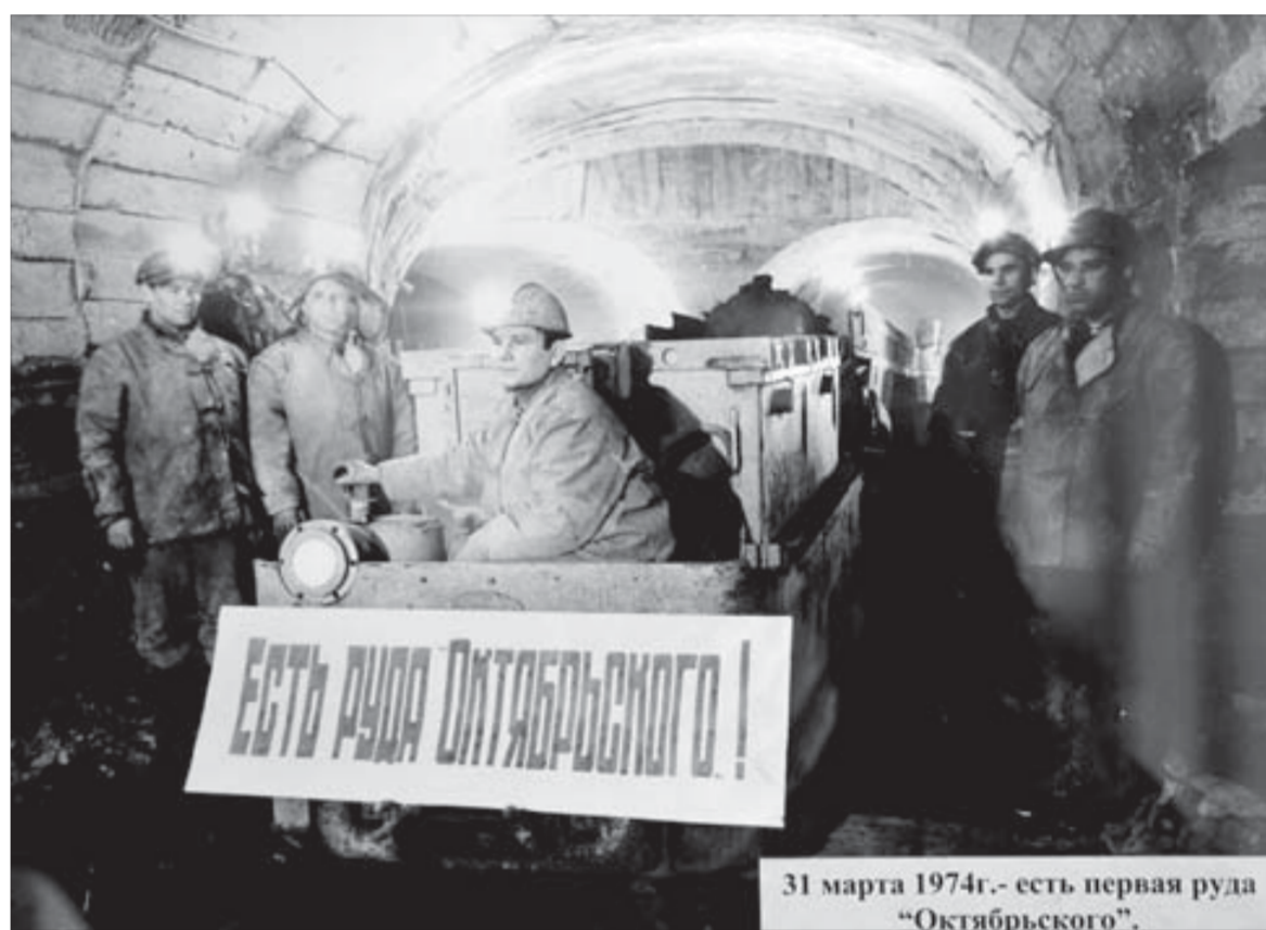
В экспозиции по истории "Октябрьского" можно увидеть и такие снимки