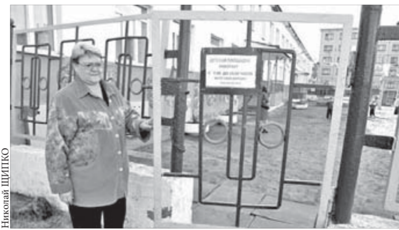
То, что ворота вечерами на замке, хулиганов не останавливает