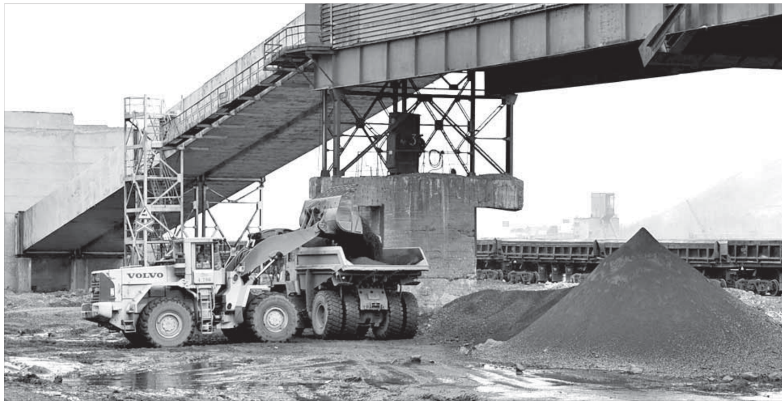
Юбилейная руда отправляется на НОФ и ТОФ

С 11.00 до 19.00 посетители музея могут познакомиться с выставками и побывать на бесплатном музейном уроке «История государственной символики России» с проведением викторины. Начало музейных уроков в 11.00, 12.30, 14.00 и 15.30. Талнахский филиал музея предлагает обзорные автобусные экскурсии по району Талнах для жителей и гостей района (начало в 16.00 и 17.00). Сбор возле здания администрации района Талнах (ул. Диксона, 10).