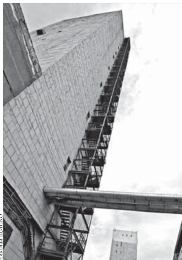
Рудники олицетворяют башни копров

Вчера на руднике «Октябрьский» выдали на-гора юбилейную тонну руды