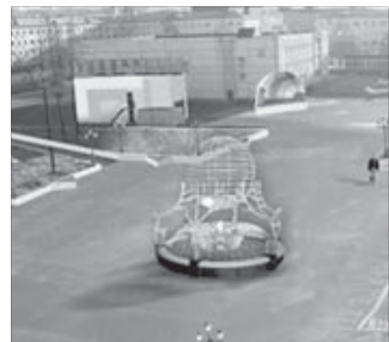
Фонтан будут окружать светодиодные огни