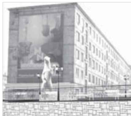
Эскиз с медведем решили переделать