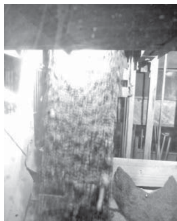
150-миллионная сыплется в приемный бункер

33, просто я молодо выгляжу (смеется). Мне было не столько трудно, сколько интересно. Машину я видела, еще когда работала ствольной на поверхности, приходила на экскурсию к машинистам подъема в нашей смене. Визуально все знала. Было очень интересно, почему я, собственно, и пошла на машину.