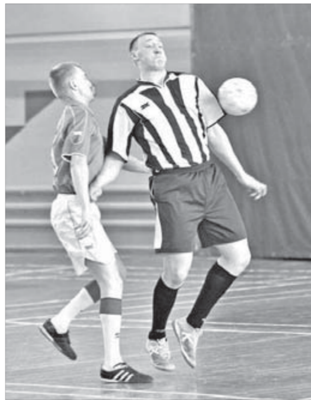
Последний матч порадовал голами

второе – "Экспресс" (управление ЗФ), на третьем – "Металлист" (НОК). В первой группе золото досталось "Никелю" (никелевый завод), "Меддеплавильщик" (медный завод) удостоился серебра, "Строитель" (ЗСК) показал третий результат.