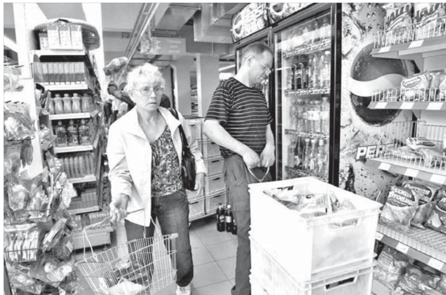
Кефир пользуется особой популярностью

Заблестело золотом шитье на зеленых сарафанах и рубашках танцоров ансамбля «Оганер», закужились по сцене юбки-солнца барышень, кавалеры покорили зрительниц молодецкой удачно – прыжками высокой степени сложности. Для чествования лучших и артисты соответствующие.