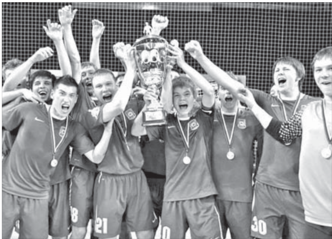
Вот оно, футбольное счастье