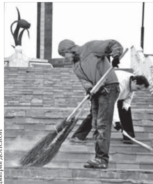
"Черный гольпан" — особое место