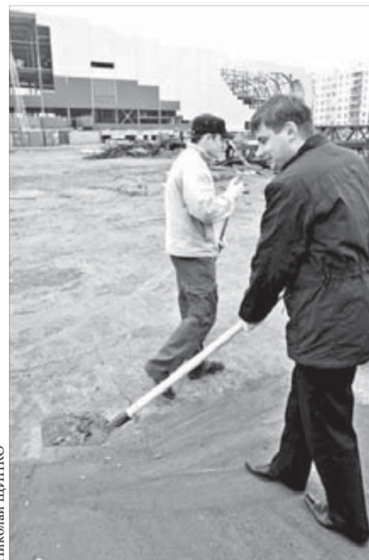
Каждый внес свою лепту