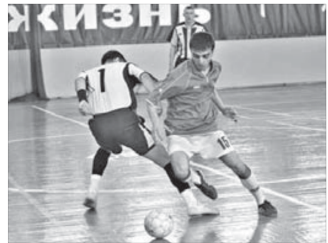
Выложились на совесть

В итоге призовые места во второй группе распределились так: первое место взял "Обогатитель" (ПООФ),