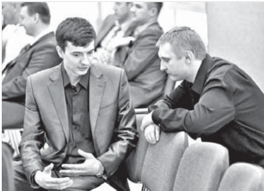
Интерес к "Чистому производству" в Норильске традиционно высок