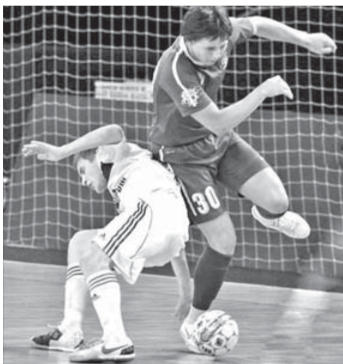
Непроходимых соперников для "Норильского никеля" нет