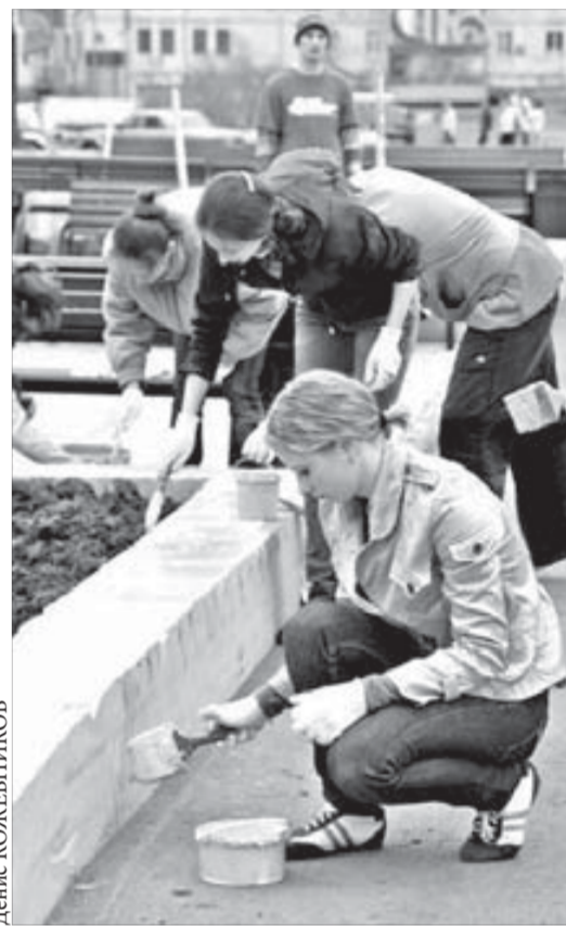
Молодежь активно себя проявила