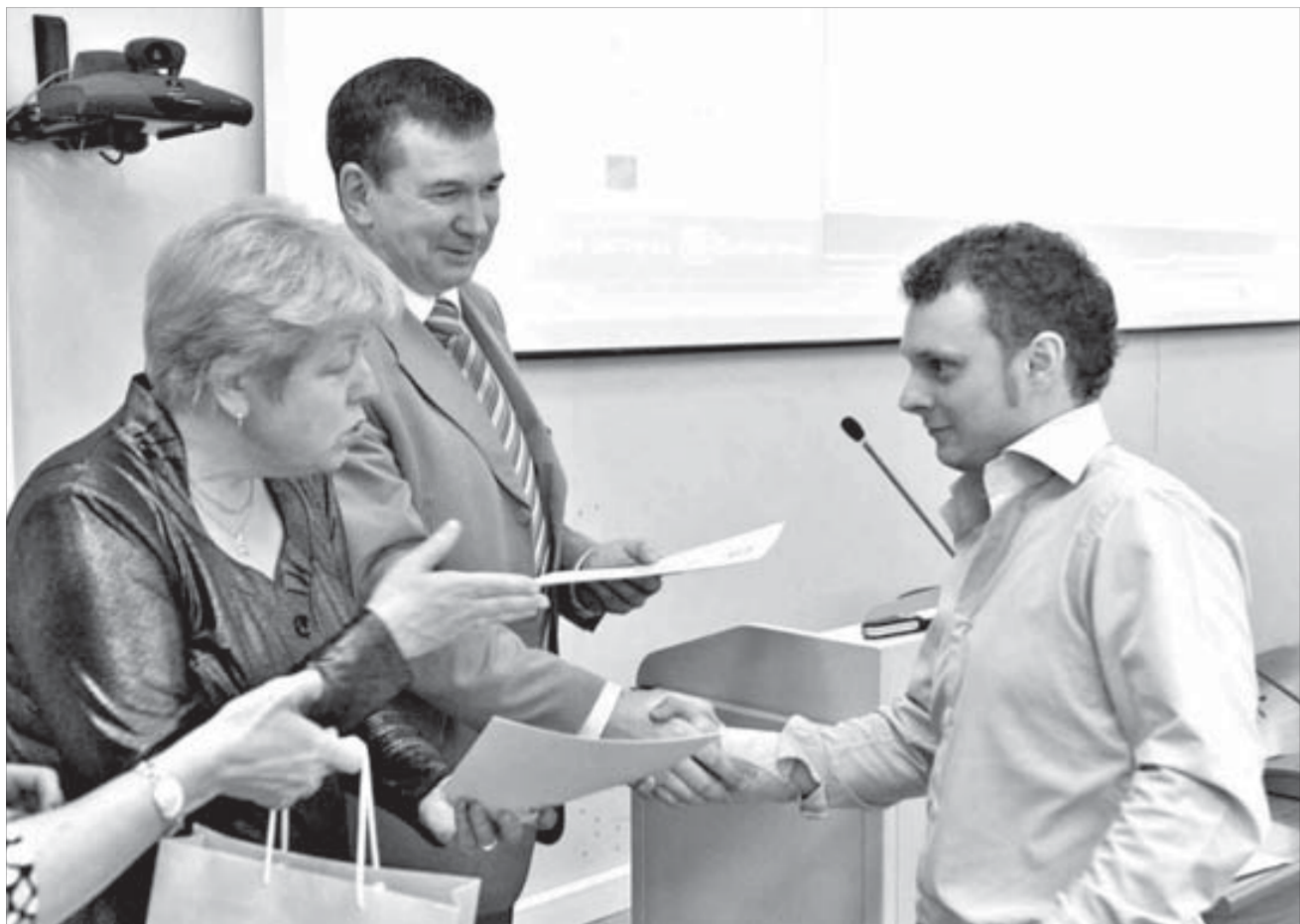
Все участники программы "Чистое производство" получают сертификаты международного образца