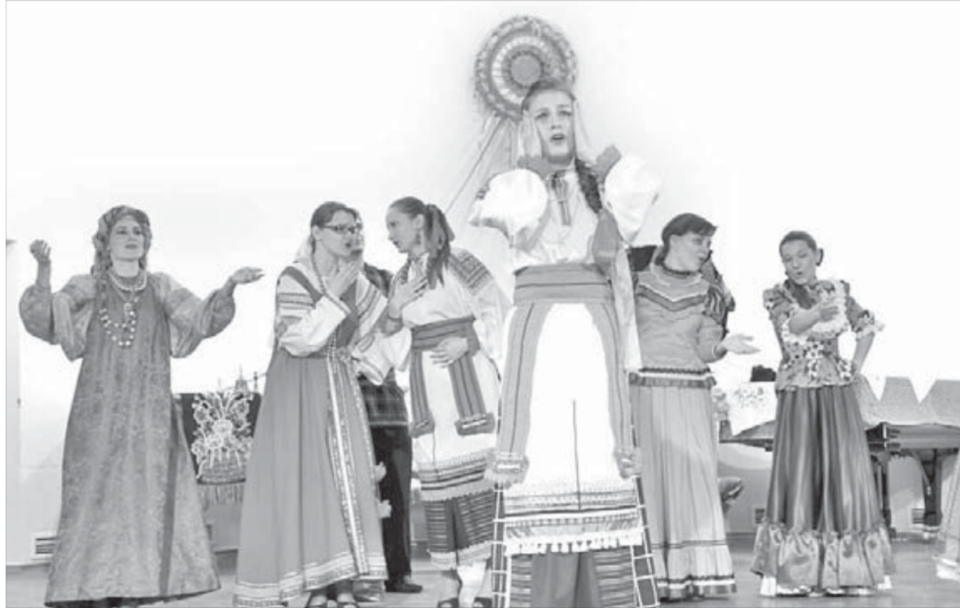
Студенты на сцене эмоциональны, что особенно нравится зрителям