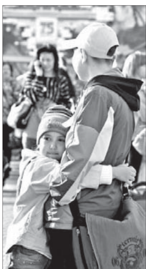
Трогательный миг расставания