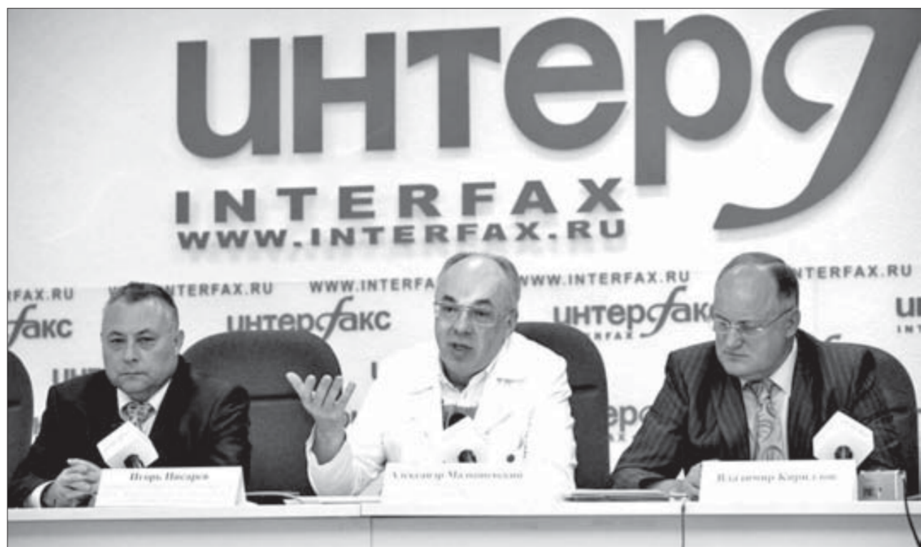
Власть и бизнес идут в одном направлении

Накануне Дня эколога компания «Норильский никель» и Федеральная служба по надзору в сфере природопользования (Росприроднадзор) провели совместную пресс-конференцию «Экология России. Устойчивое развитие регионов и предприятий. Пути решения проблем (на примере Норильска)». В пресс-конференции приняли участие