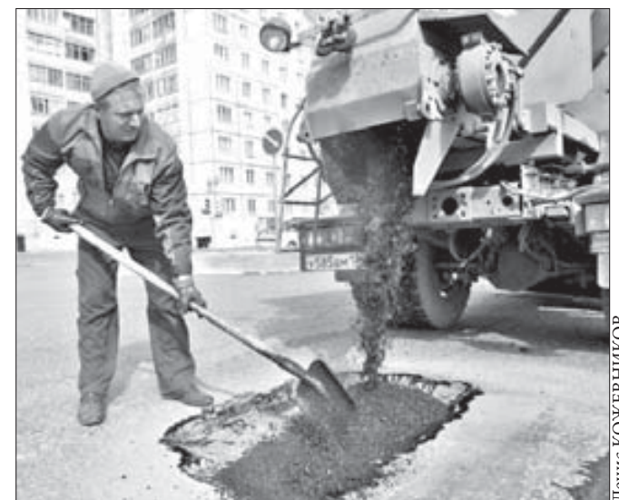
Свежий асфальт тут же укладывают на дороги и заполняют ямы