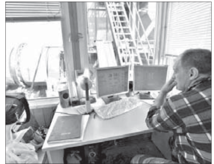
Весь процесс контролируют компьютер и оператор

После рассказа и показа готовый асфальт попадает на дороги. Если сегодня на улице Бегичева специальной фрезой пока выравнивают дорожное полотно, то на Талнахской, на перекрестке с улицей 50 лет Октября, мы видим ямочный ремонт в действии. В заранее подготовленные ямы дорожники засыпают горячий асфальт, и каток тут же сравнивает его с уровнем дороги.