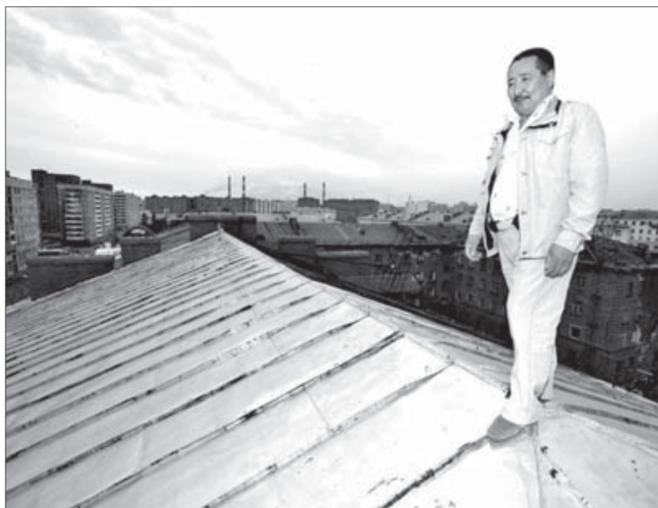
Замену кровли на Кирова, 13, подрядчики выполнили раньше срока