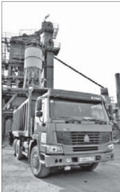
Очередная партия готова

В Центральном районе Норильска начал работу асфальтобетонный завод, продукцию которого тут же укладывают на дороги.