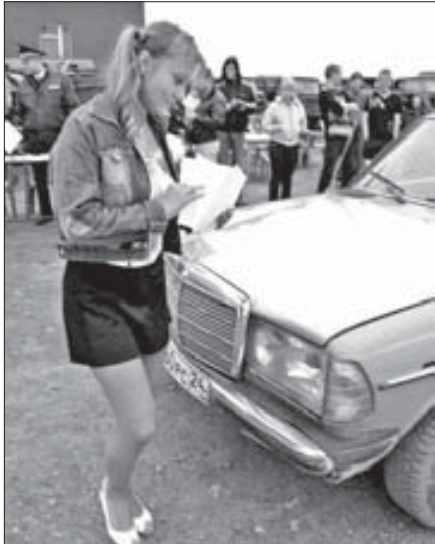
Конкурсы бывают разные