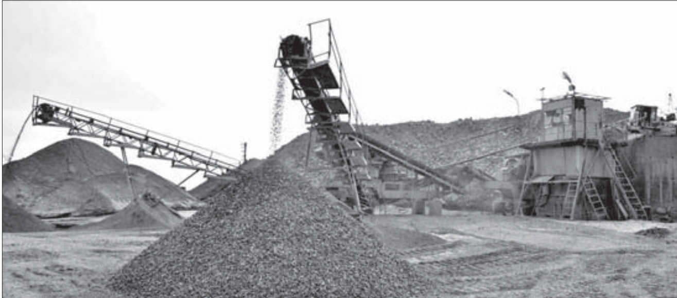
Асфальтобетонный завод и дробильно-сортировочный комплекс могут непрерывно обеспечивать город асфальтом