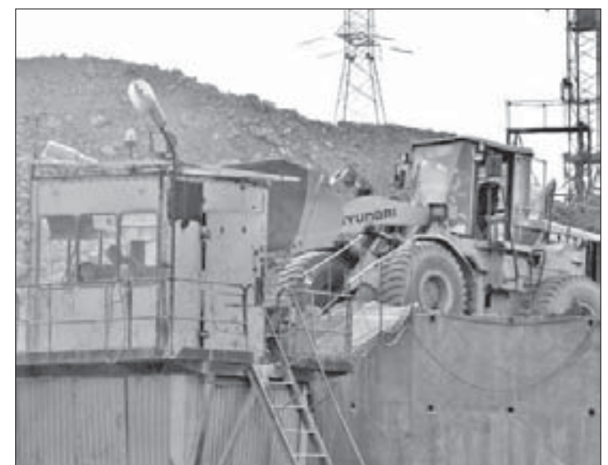
В дробилке крупные камни перемалывают в пригодный для асфальта щебень