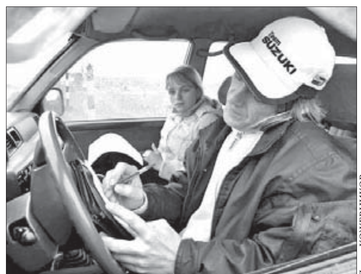
Заметки "на полях"