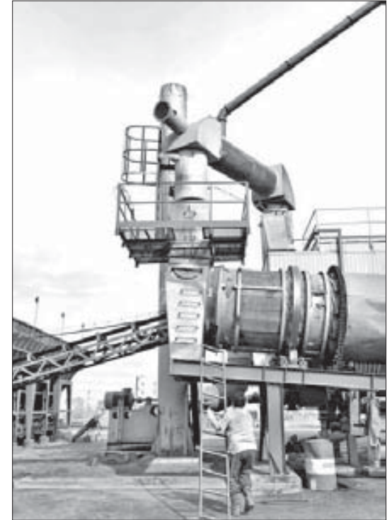
Пыль из сушильного барабана не попадает в воздух