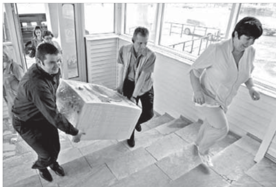
Подарок подоспел вовремя

Вчера в детской городской больнице появилась новая импортная стиральная машина. Подарок к Дню защиты детей сделали работники Надеждинского металлургического завода.