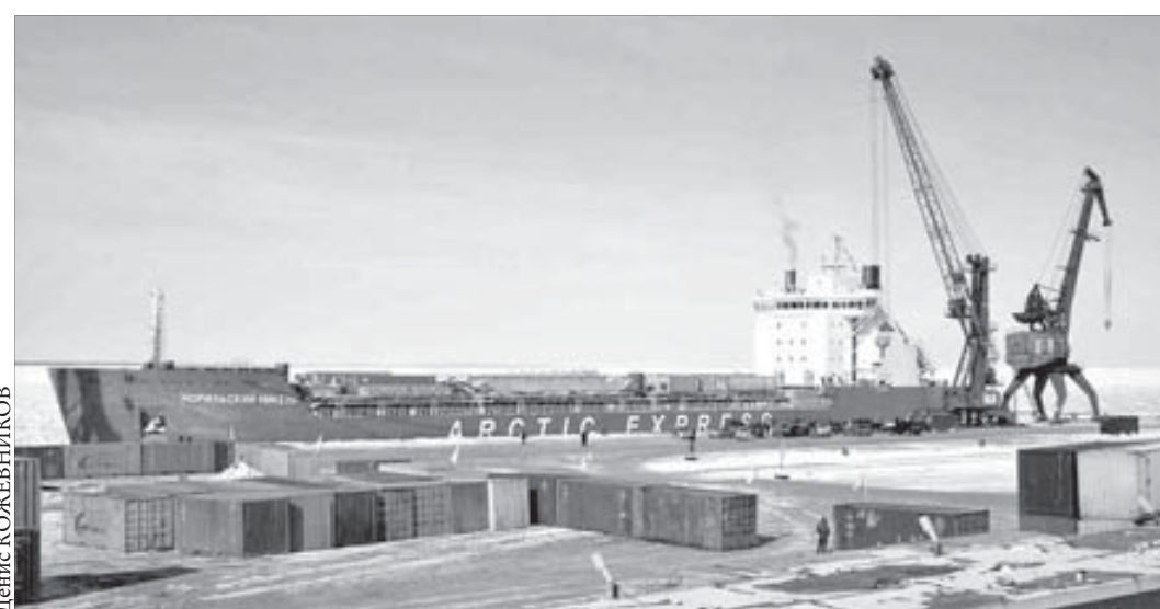
Судно «Норильский никель» скоро преобразится

В германском Висмаре состоялся вывод из дока танкера ледового класса, строительство которого идет в рамках проекта создания и развития собственного арктического флота ГМК «Норильский никель».