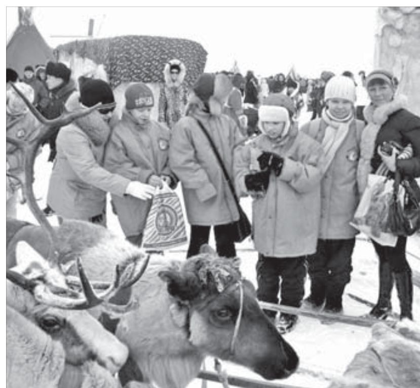
Воспитанники центра “Виктория” готовят фильм по краеведению

Сразу два норильских образовательных учреждения получили гранты краевой программы для воплощения своих проектов. В обоих случаях идеи касаются изучения края, его природы и истории.