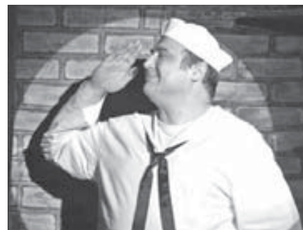
Артистята вырастают в больших артистов