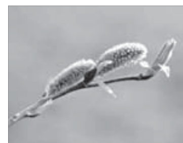
Ива – находка для рекультивации

Год назад Заполярный филиал взялся за обустройство территории вокруг озера Долгое. Первой ласточкой стала скульптура девушки-геолога. Вскоре вокруг нее заповедник «Большой Арктический», реализуя совместный с Заполярным филиалом проект, посеял травы, высадил деревья, а на откосах – черенки ивы. Зима прошла. Радостная новость: растения прижились на 98 процентов!