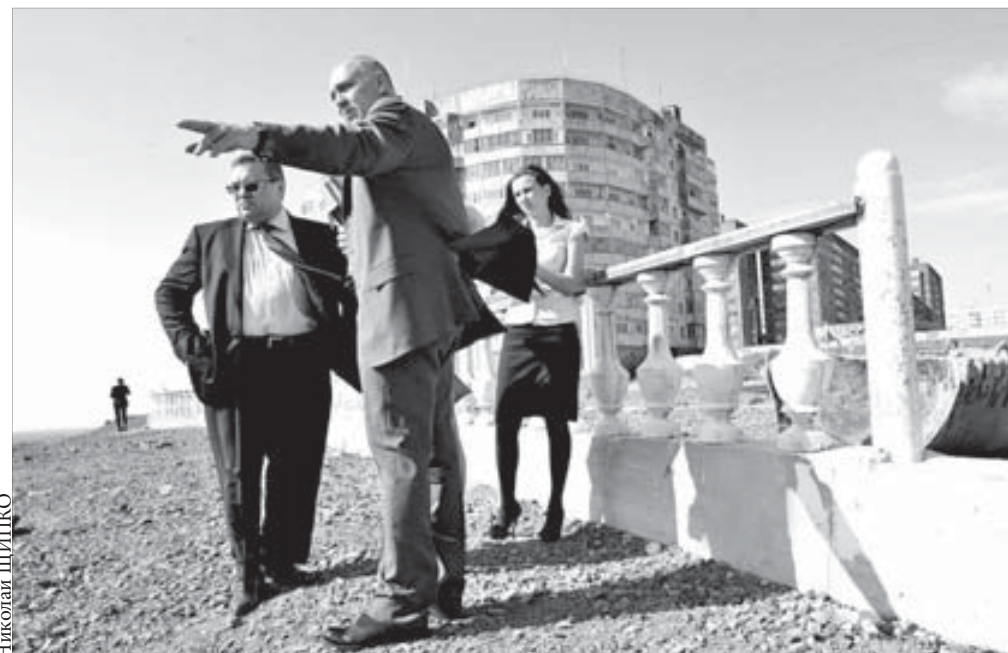
Работа разделена на три этапа