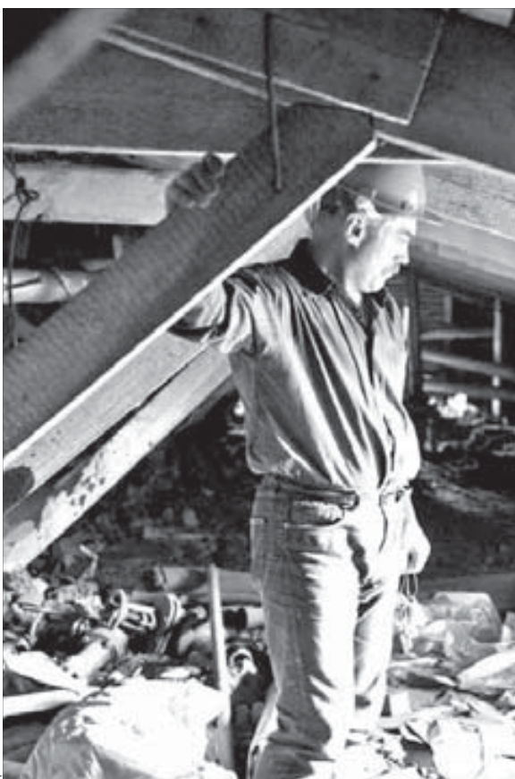
Хлам накопился на чердаках десятки лет

— Таких замусоренных чердаков много. И весь хлам, который скапливался годами, нам предстоит убрать. Процесс этот трудоемкий и небезопасный. Тем более что жителям коммунальщики не хотят доставлять никаких неудобств. Ко