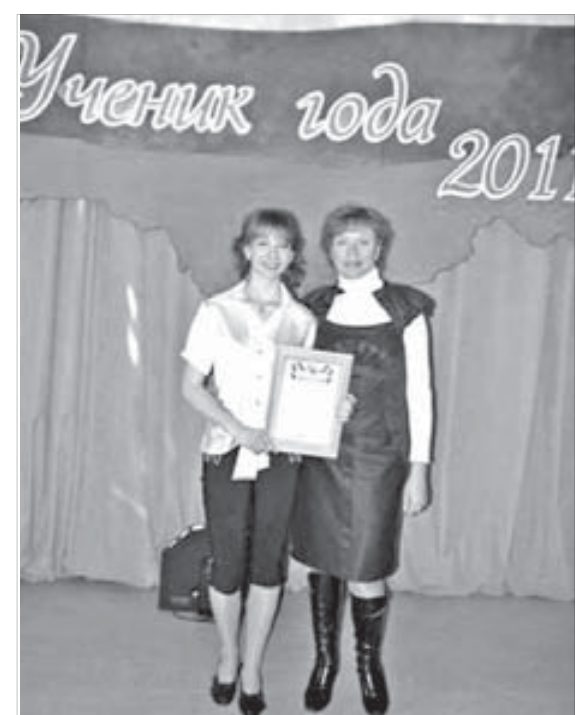
Это звание участника заслужила