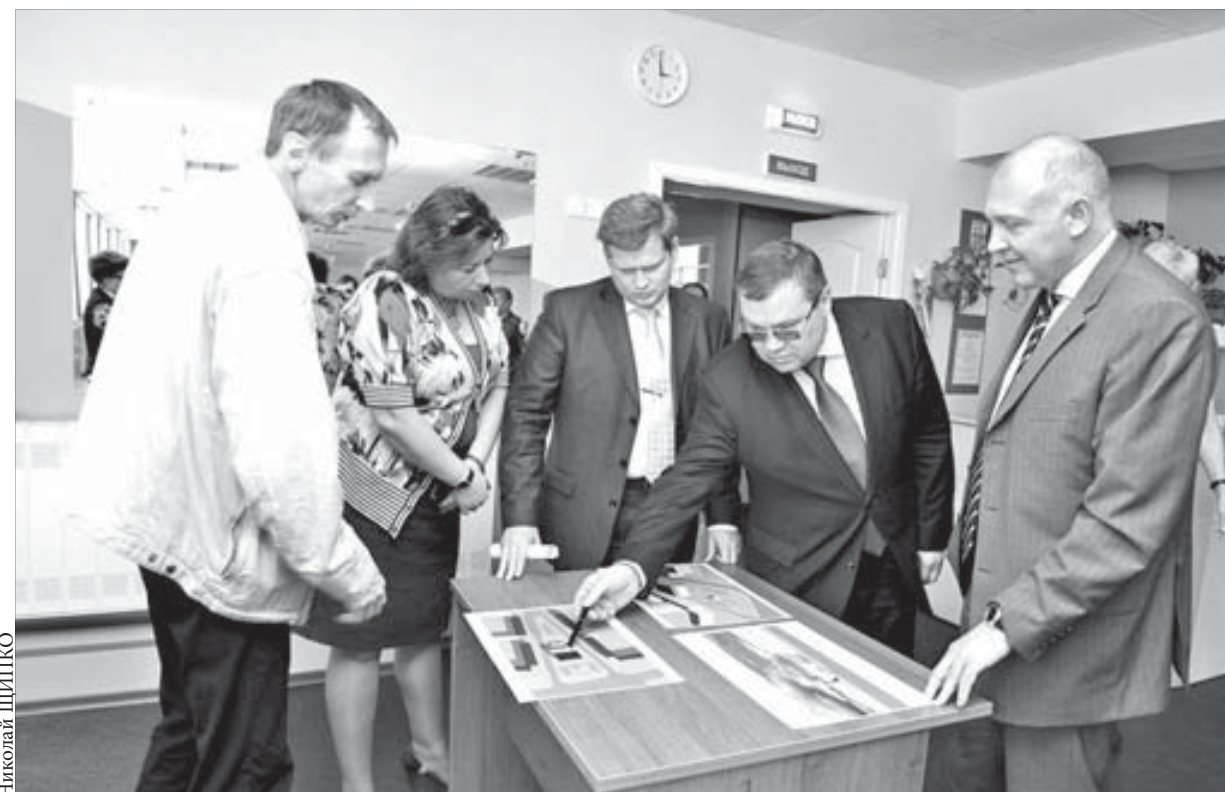
Проект стадиона порадовал руководство

Курс акций ОАО «ГМК «Норильский никель» – 7012 рубль. ОАО «Полюс Золото» – 1904 рубль.