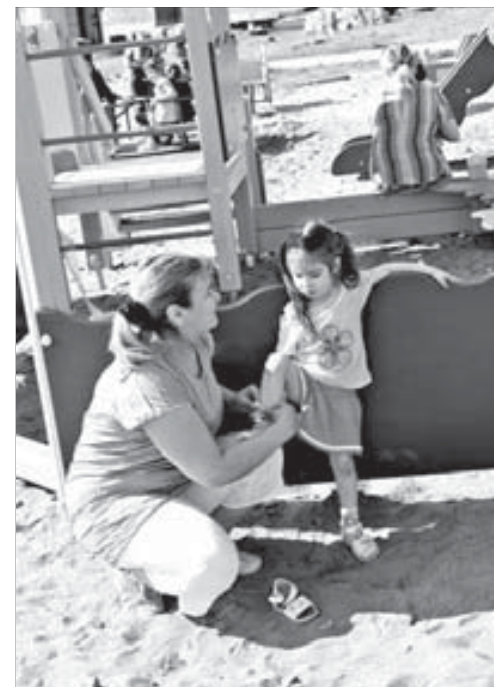
На детской площадке нужны лавочки

Из местного бюджета выделили деньги на разработку проекта по благоустройству,