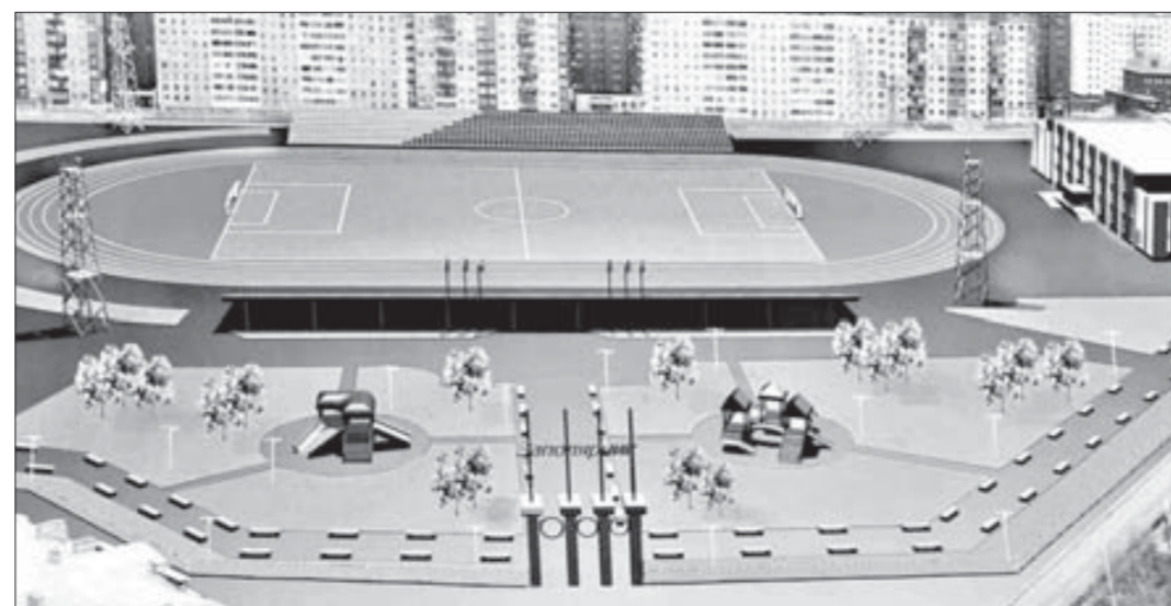
...и после реконструкции

Стадион "Заполярик" все явственнее приобретает новые очертания. И хотя его нынешний внешний вид пока еще мало напоминает полноценное спортивное сооружение, некоторая схожесть с размещенным здесь же эскизом уже просматривается.