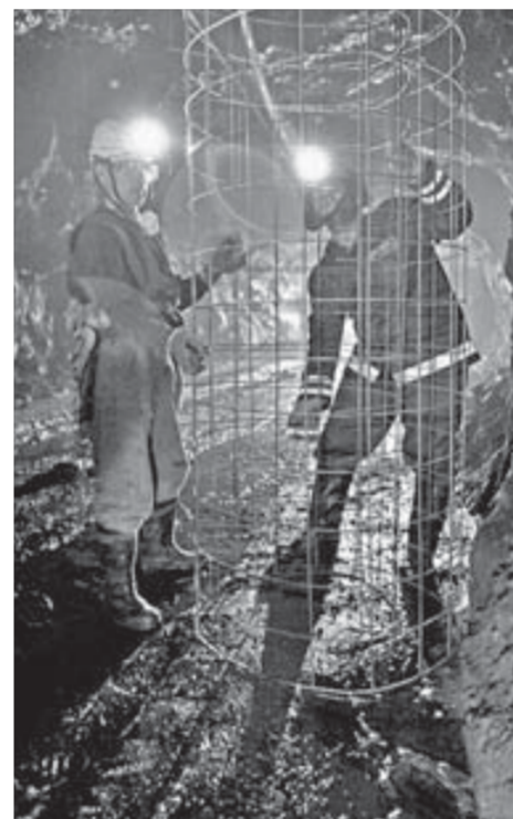
Со стальной сеткой столько работы

– Детей много, значит, должны быть особо осторожны. На рабочем месте на что обращаете внимание в первую очередь?