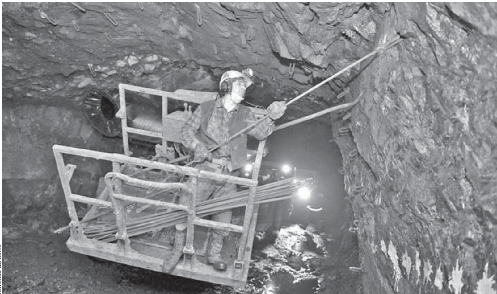
Железобетонные штанги крепления на "Октябрьском" невиданной для ННР длины – 2,2 метра