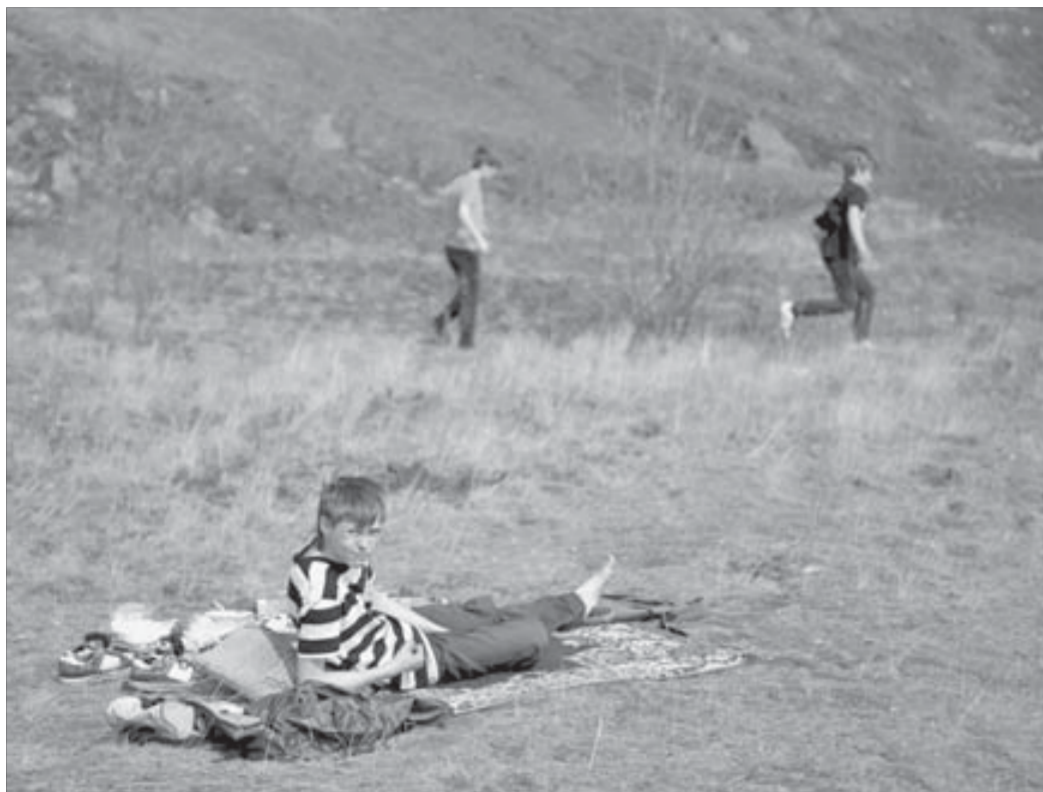
Я на солнышке лежу...