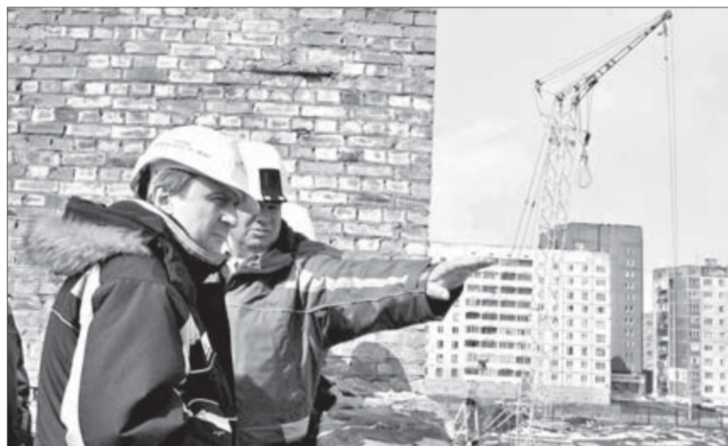
Стадион находится под личным контролем директора ЗФ