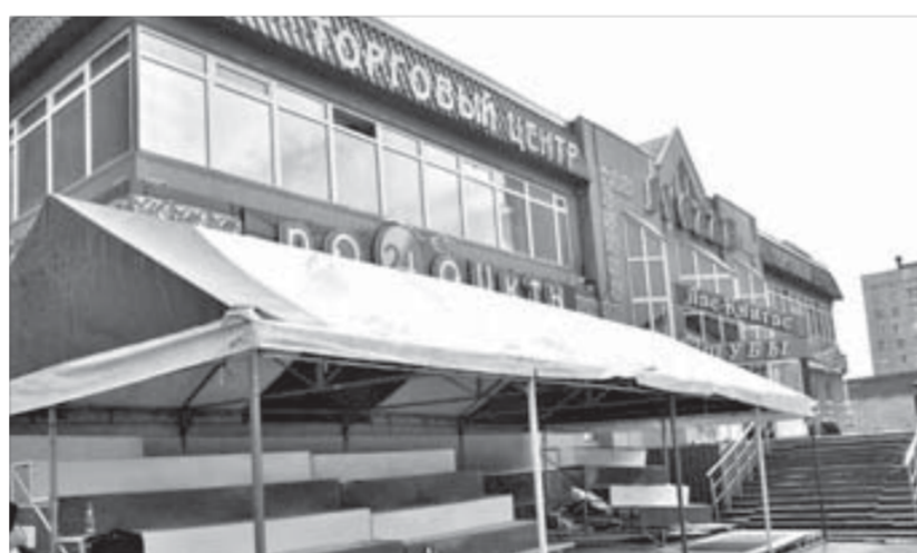
Одно из семи летних кафе вскоре откроется на улице Талнахской

– Хочу отметить ситуацию по кафе на Театральной площади. В прошлом году на площади нельзя было размещать кафе, основной ассортимент которого составляли шашлык и пиво. Запрет действует и в этом году. На площади будет