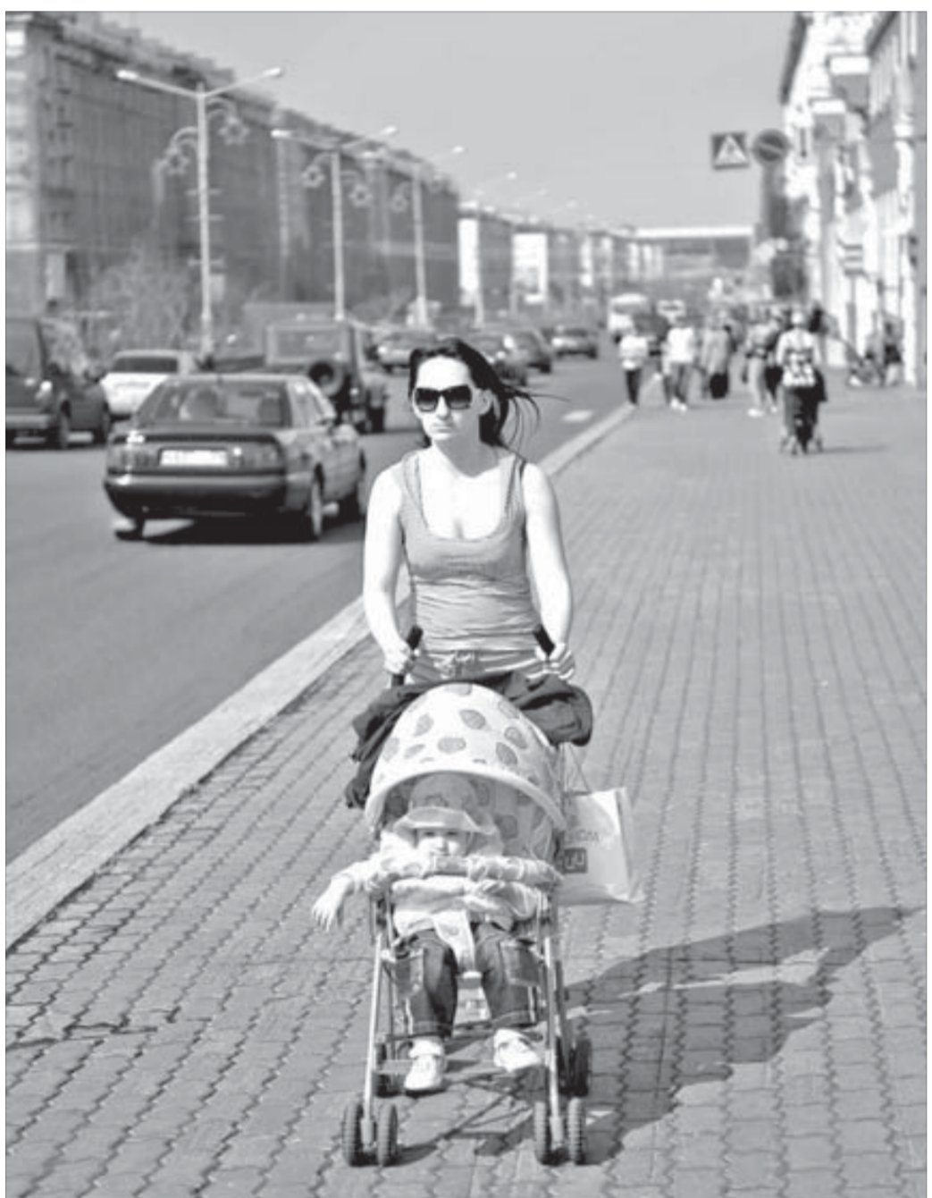
Молодые мамочки прекрасны