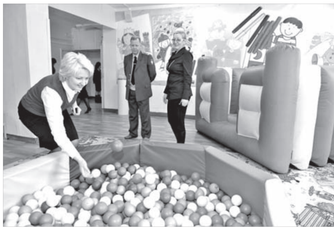
Одна из игровых площадок летнего лагеря на базе школы №21