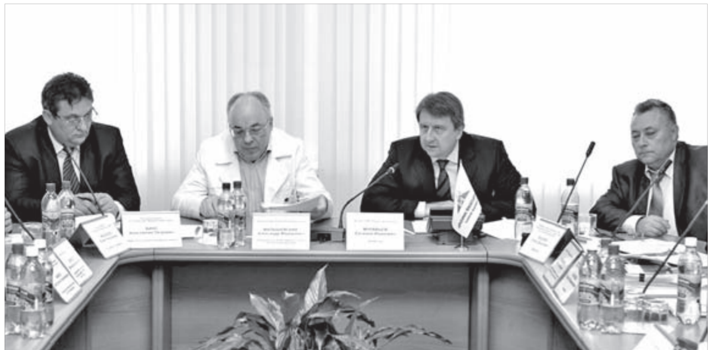
Участники соглашения рассчитывают на конструктивный диалог