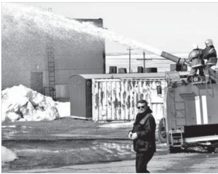
Все участники учений действовали слаженно и быстро

В ходе тренировки все участники подтвердили высокую квалификацию и показали постоянную готовность в любой момент справиться с аварийной ситуацией.