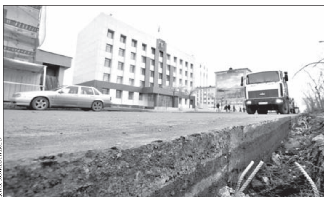
До осени старые поребрики уступят место новым

Нынешним летом будут полностью восстановлены газонные поребрики на Ленинском проспекте.