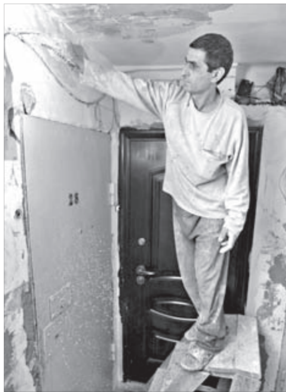
На ремонт одного подъезда требуется около двух недель