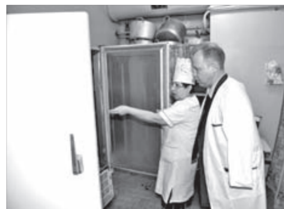
Заместитель главного санитарного врача города осматривает пищеблок

Добавим, что в пришкольных лагерях за обе смены отдохнут 1140 детей в возрасте от 7 до 14 лет (из них 70 – по льготному, бесплатному путевкам). Стоимость путевки для родителей в этом году составила 1325 рублей. Это 25% от реальной цены. Полную стоимость компенсировали за счет муниципального бюджета.