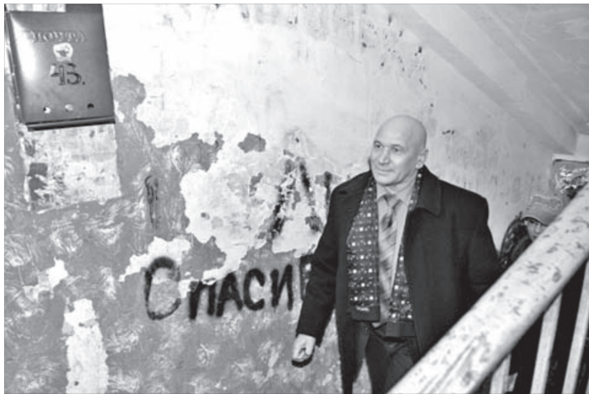
Многие подъезды давно кричат: “Спаси!”

При встрече с медведем специалисты советуют издавать сильный шум: звенеть, гремять, стучать... Возможно, это испугает животное и заставит уйти.