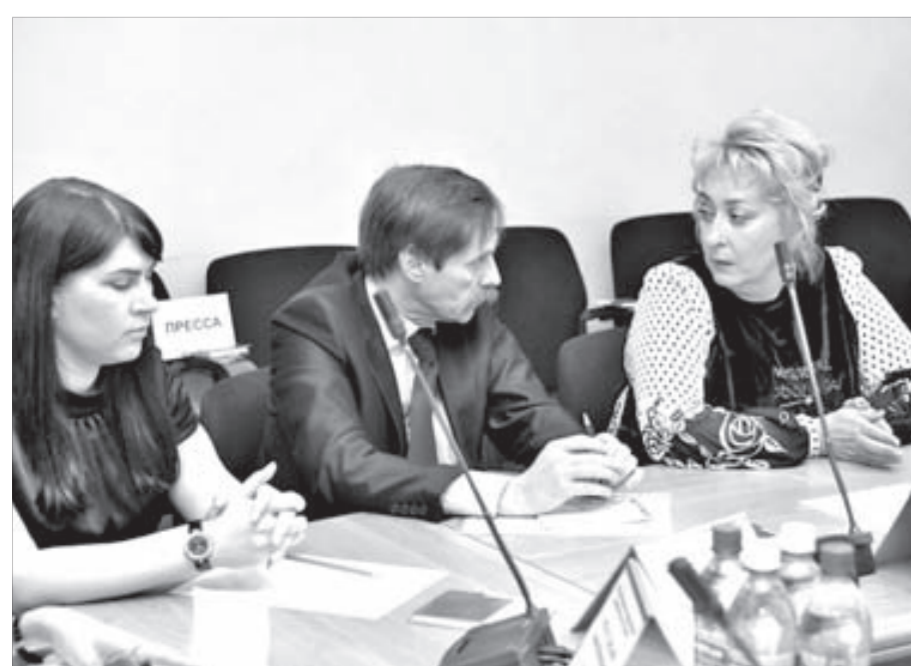
На слушания пригласили представителей заповедников

После подробной презентации, включающей в себя историко-географическую справку о Норильском комбинате и информацию о снижении выбросов, главные инженеры основных предприятий НПП рассказали о перспективах модернизации производств и, как следствие, улучшении экологии. Гости внимательно слушали про метаморфозы с печами и трубами, которые уже произошли и произойдут в ближайшее время, что идет на пользу экологии. Цифры, схемы и выкладки выглядели солидно и доказательно.