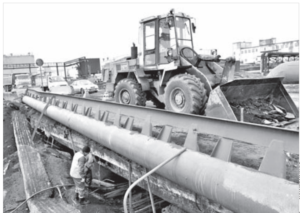
Мост у механического завода эксплуатировался без ремонта несколько десятков лет