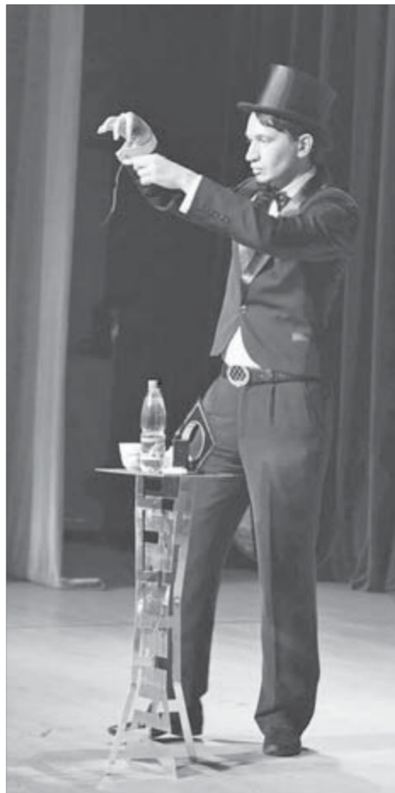
Фокус с бритвами дома повторять не рекомендуется

Если на первом туре фестиваля в малом зале Дворца культуры присутствовал минимум зрителей, то зал КДЦ был практически полон, и бо-