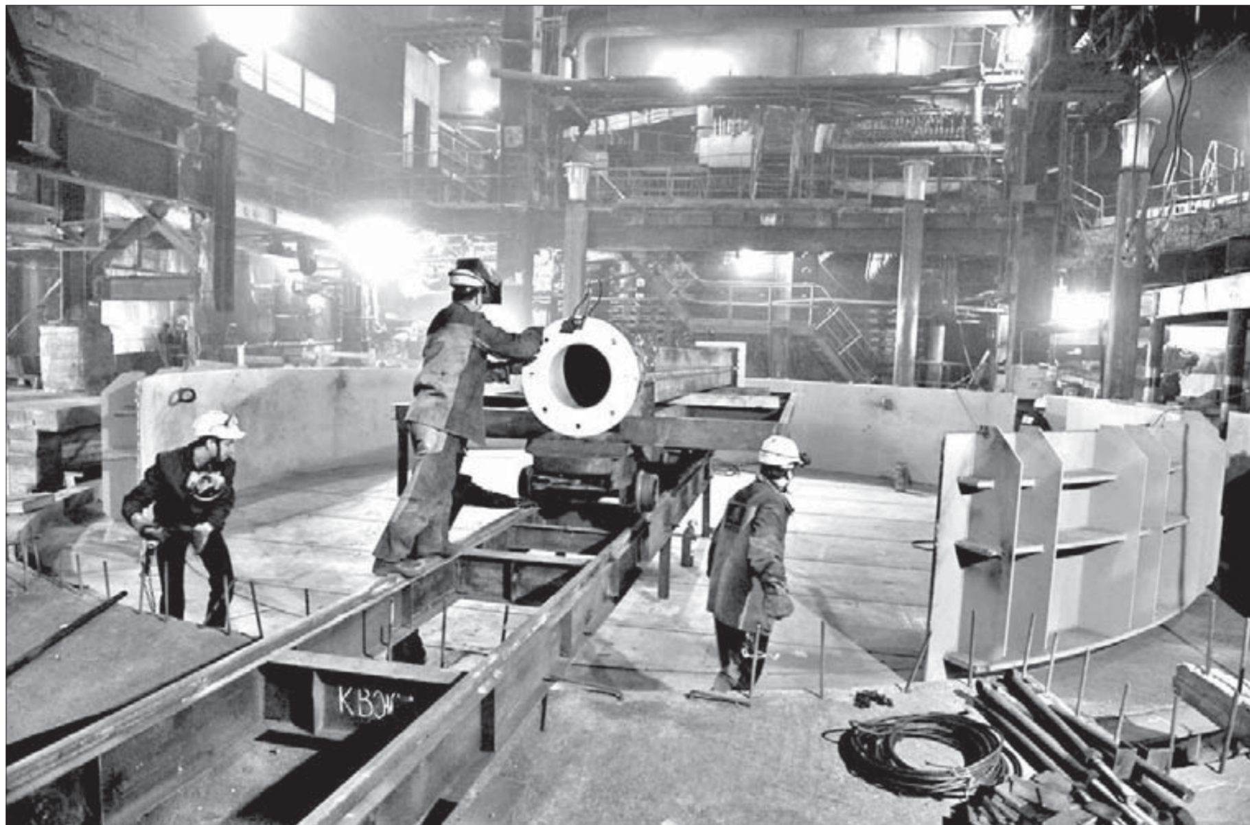
Рабочие "Норильскремонта" заняты установкой опорной колонны

В Общероссийский день библиотек, 27 мая, Публичная библиотека и детская библиотека имени Саши Петряева приглашают юных читателей для участия в игровой программе "Дом, где сказка живет". У фасада библиотеки, где пройдет праздник, ребята смогут нарисовать мелками на асфальте своих любимых сказочных героев, принять участие в самокатном ралли и эстафете, проверить меткость в боулинге и дартсе, а также проявить свои знания в сказочной викторине. Победители получат заслуженные сладкие призы. Начало праздника в 12.30.