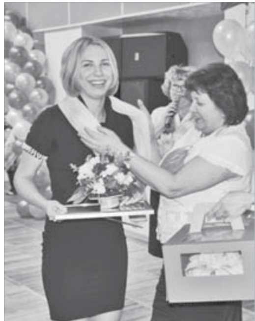
Вечер получился праздничным