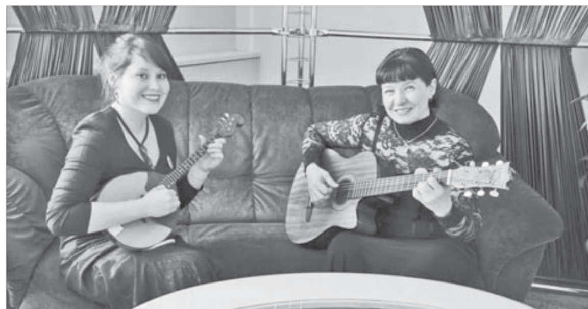
В числе других номеров “Октябрьский” представил игру на музыкальных инструментах

Имена победителей фестиваля “Корпорация звезд” будут объявлены накануне Дня металлургов. Увидеть и услышать их можно будет на праздничных площадках города.