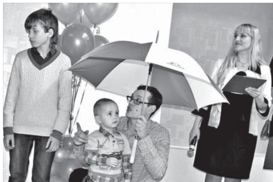
Детям вручили воздушные шары и сувениры