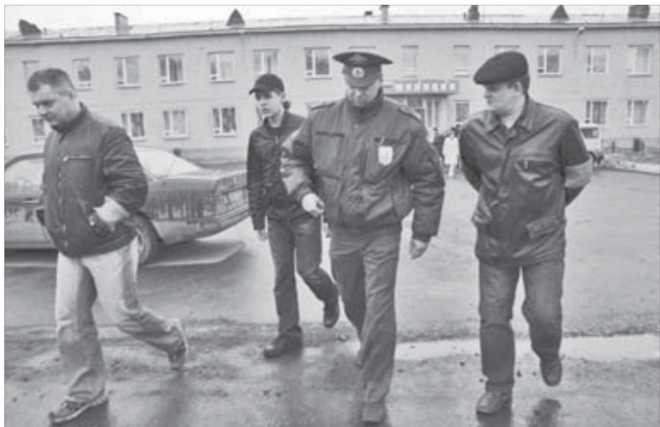
Вываживающих норильчан будут убеждать отказаться от плохих привычек