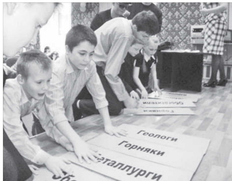
Какие профессии востребованы, ребята узнали на уроке компании

После того как в минувшем году ребята из школы-интерната №2 осуществили вместе с медиакомпанией “Северный город” проект “Если бы я был журналистом...”, многие стали пробовать себя в написании первых корреспонденций и иллюстрировать их собственными снимками. Ни одно значимое событие не ускользает теперь из поля зрения юных репортеров. Тем более такое, как урок компании, недавно состоявшийся в интернате и запомнившийся интересными встречами, впечатляющими экскурсиями и новыми знаниями о родном городе. Вот что рассказала об уроке компании одна из участниц проекта.