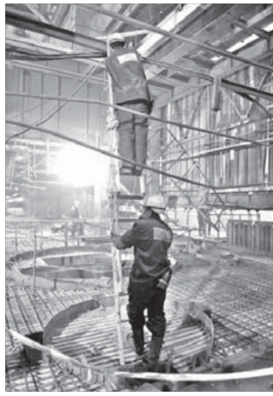
Субподрядчики заняты монтажом коммуникаций

– Конструкция ОЭП-4, конечно, отличается от других агрегатов, – признается он, – но это для нас работа не новая... Несколько лет назад мы уже производили реконструкцию первой и третьей обеднительных печей. Опыт есть. К работе над ОЭП-4 мы приступили в феврале. Перед нами стояла задача произвести полный демонтаж оборудования – печи, всех коммуникаций, сейчас все это сделано, и мы приступили к монтажу отметок, оборудования. Фундамент готов. Опорная часть печи сделана. Отметки