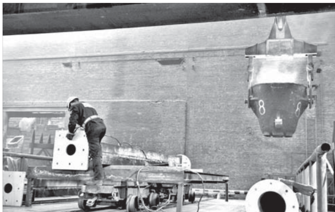
Подготовка колонны к монтажу