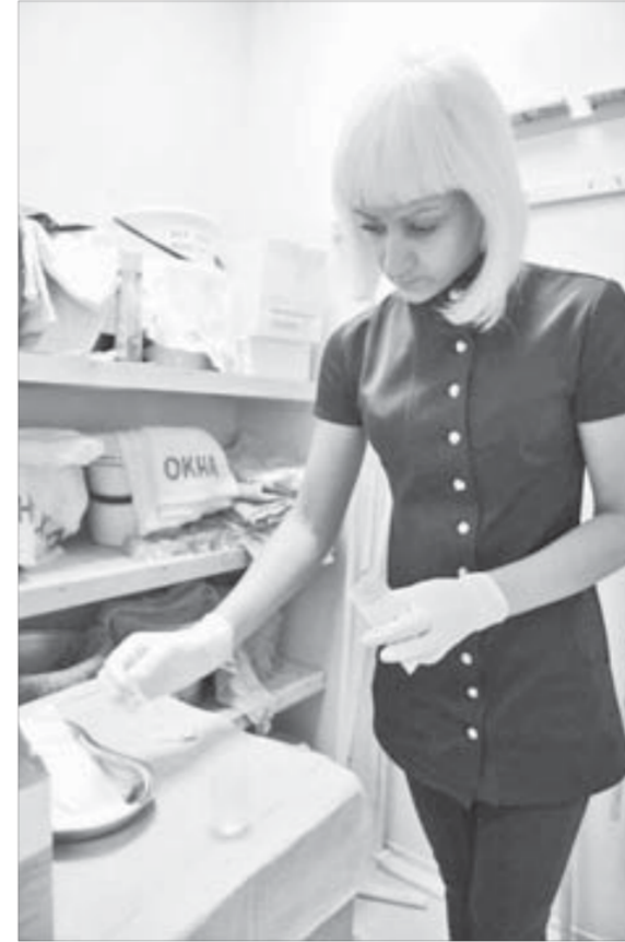
Взяты образцы тут же тестируют

Травмы могло бы и не быть по нескольким причинам. Во-первых, при подкачке колеса используется специальная защитная решетка. Которая, к слову, находилась в полуметре от пострадавшего, на расстоянии вытянутой руки. Во-вторых, в базе присутствовали два сменных механика, которые даже не знали о ремонте. По результатам работы комиссии, расследовавшей несчастный случай, одного из них больше не будут привлекать к обязанностям сменного механика. И в-третьих, пострадавший не обладал должным опытом для производства таких работ. То есть не знал, что делает.