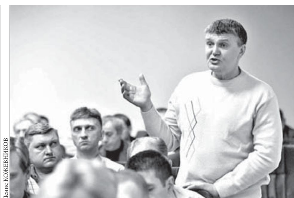
Соблюдение норм ТБ должны контролировать и ИТР, и бригадиры