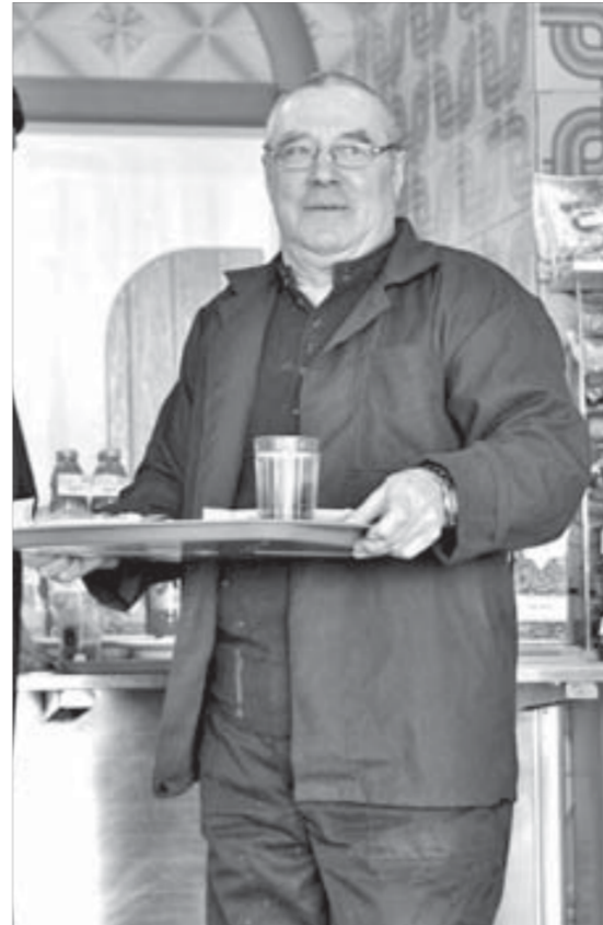
Главное – вовремя подкрепиться