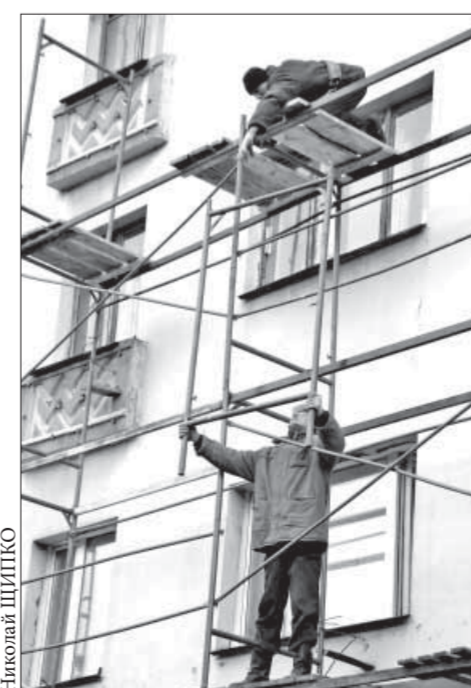
Денег в три раза больше – и работы тоже

В городе полным ходом идет ремонт фасадов. На это в текущем году выделено в три раза больше денег, чем в прошлом. Какие покрасят дома и в какой цвет, а также сколько это будет стоить, узнали корреспонденты "ЗВ".