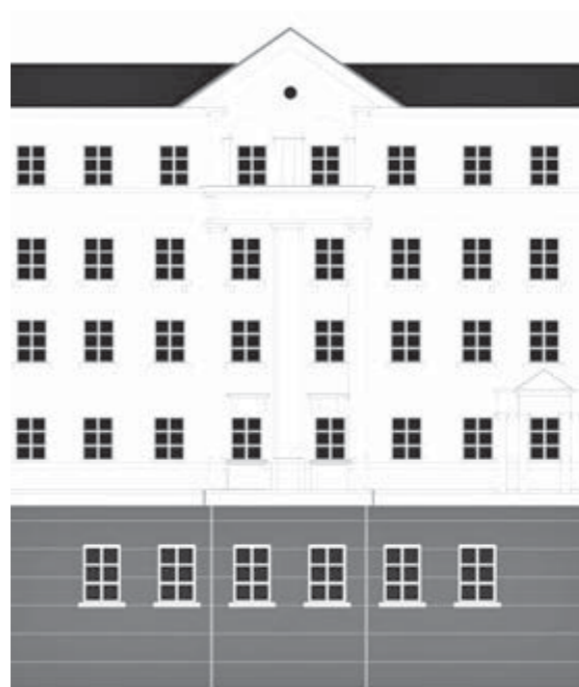
Фасад здания на Комсомольской, 14