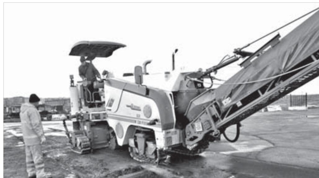
Испытания на местности