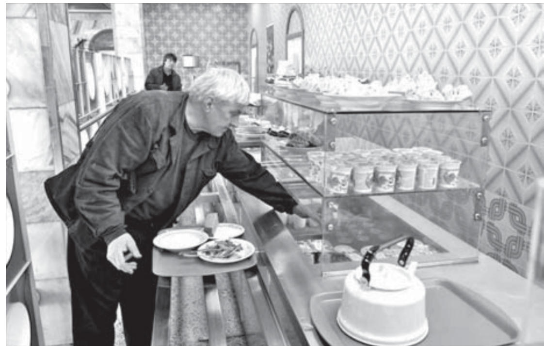
Можно выбрать блюдо по душе

приятно удивлены тем, что теперь точка питания появилась рядом со службой. Ассортимент блюд на витрине дарит надежду на сытную трапезу. И главное – приемлемую по цене. Суммы на выбитых чеках лояльные по отношению к любому семейному бюджету: 120 рублей, 117, 160. Разве