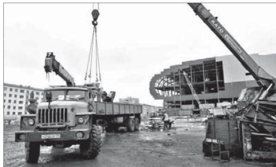
Материалы старого подрядчика вывозят со стройки

Конкурс на строительство комплекса "Арена-Норильск" выиграла турецкая фирма "Три моря", которая уже имеет опыт возведения подобных объектов. 10 июня подрядчик приступит к работам.