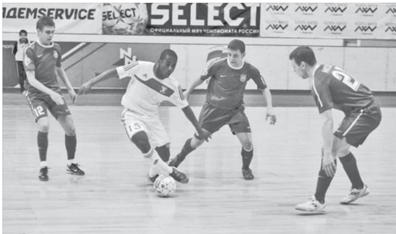
С бразильцами из Сибири в четвертьфинале никельщики не справились