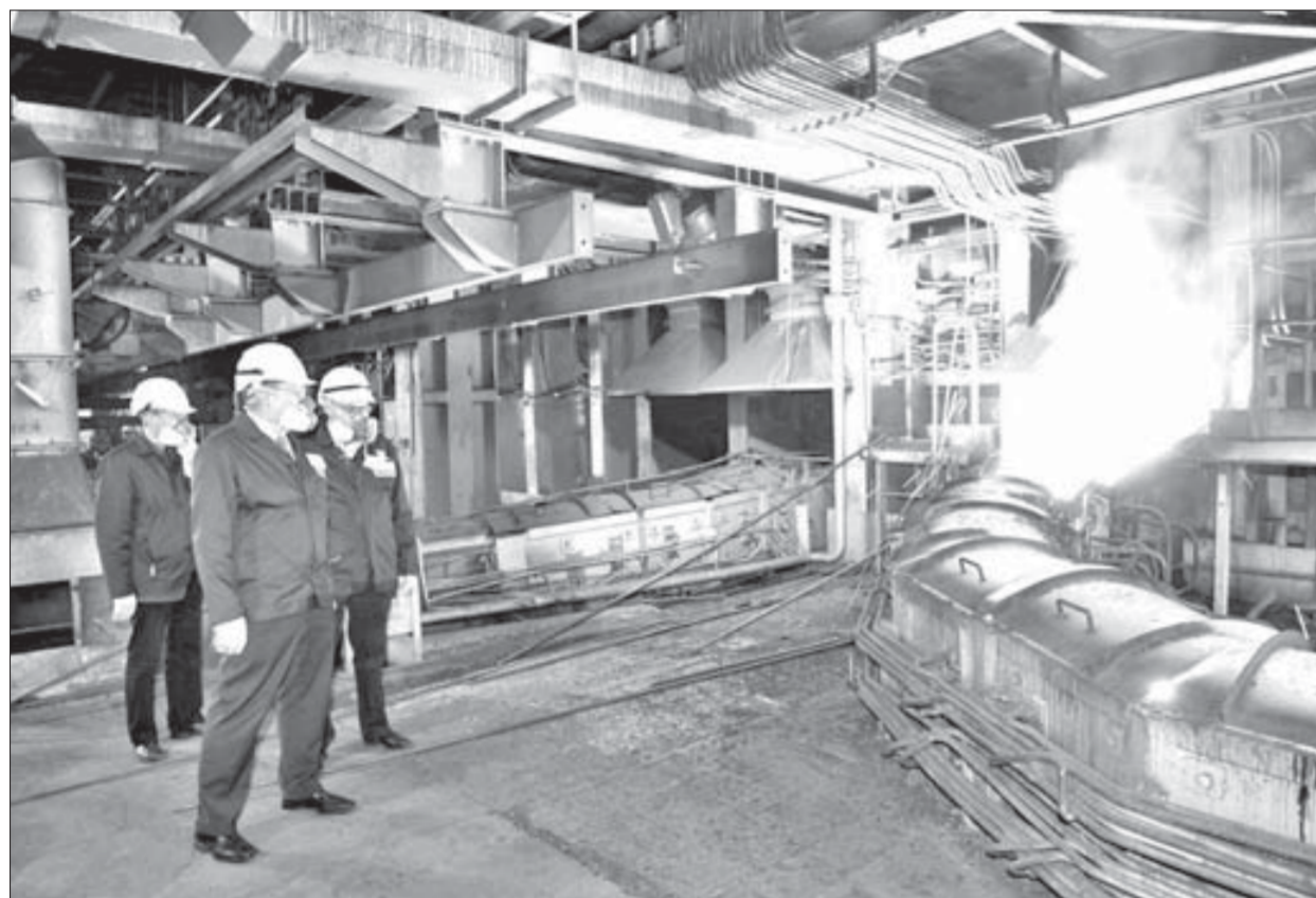
Иностранцы были поражены российским размахом

Три дня провела в Норильске делегация специалистов иностранных предприятий "Норильского никеля". Они посетили основные производственные площадки Заполярного филиала и познакомиться с северным городом. Этот визит принесет несомненную пользу для всех, уверены гости.