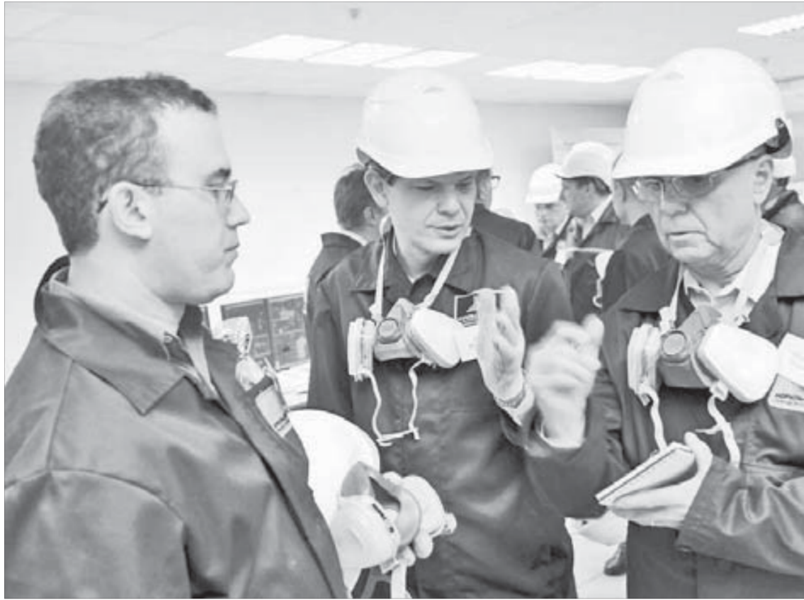
Гостям было что обсудить