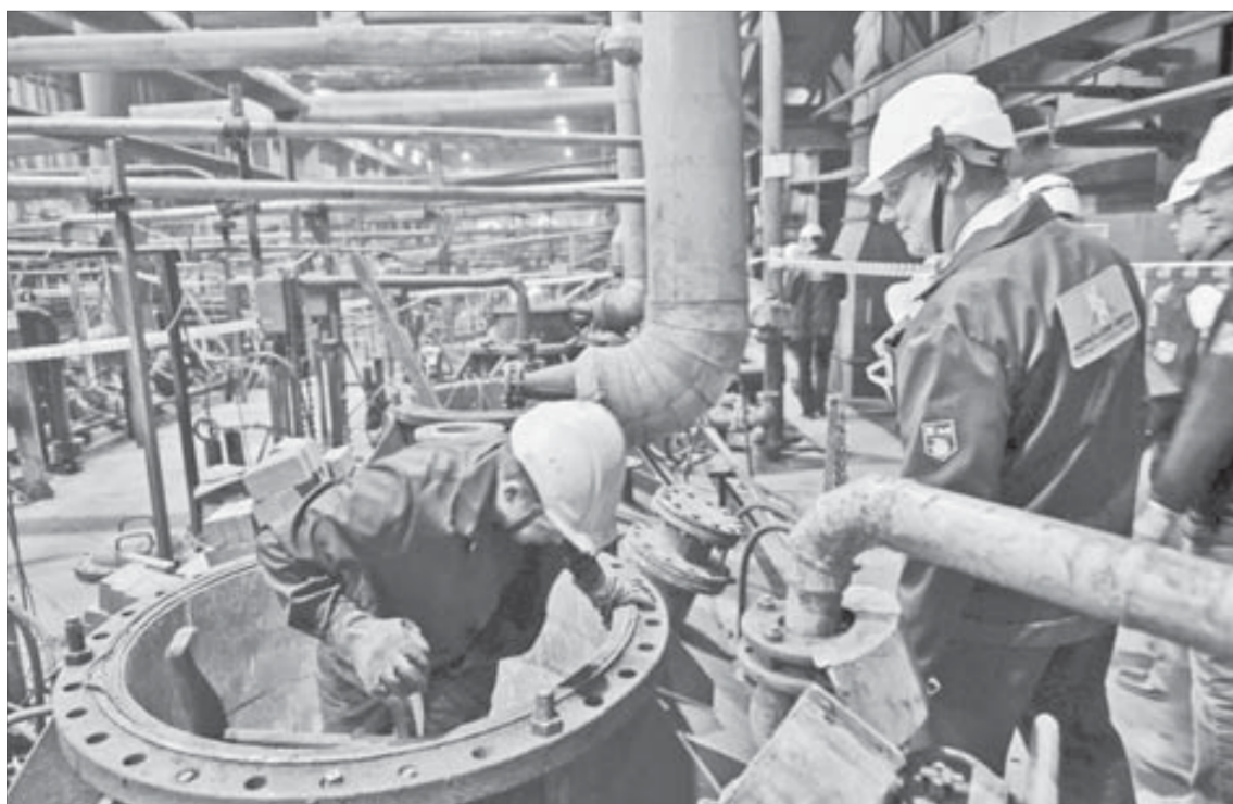
Оборудование рассматривали очень внимательно