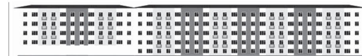
Ленинский проспект, 25 (корп. 1, 2)