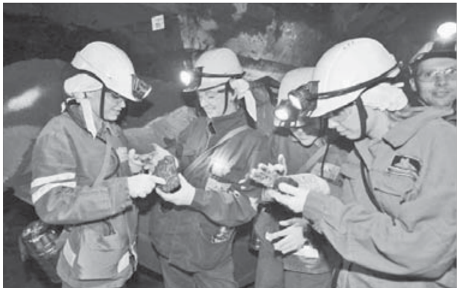
Кусочки руды взяли на память

Первым пунктом назначения стал гараж ПУПР (подземный участок подготовки производства работ). К нему пришлось добираться пешком, четко следуя подземным знакам. Затем перед экскурсантами появился состав из пассажирских вагоночек - подземный поезд. Рассмотреть "окрестности" в пути не получилось - темно. Из освещения