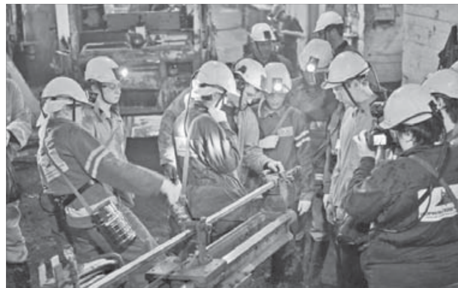
На ремонтной базе оборудование удалось даже потрогать