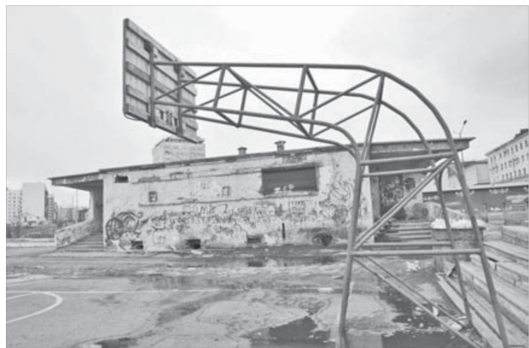
Здесь вырастет комплекс игровых видов спорта