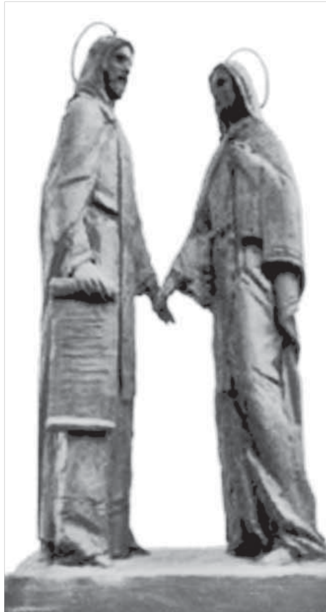
Скульптуру Петра и Февронии устанавливают в будущем году