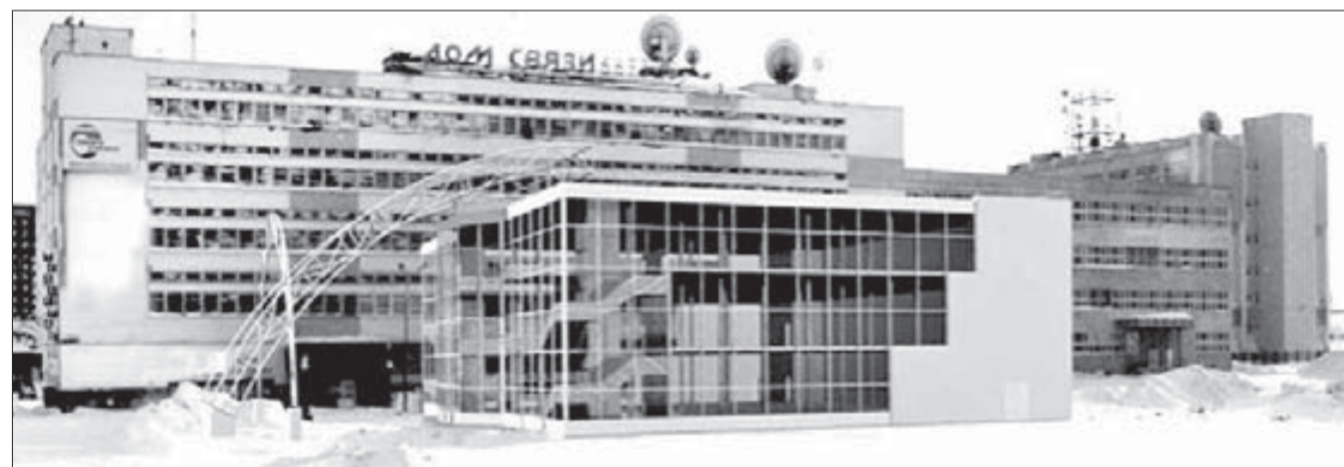
Эскиз нового торгово-развлекательного центра

Пустырь между почтамтом и Домом торговли на Комсомольской через два с половиной года станет парковой зоной, на горе появится четырехметровая скульптура, а на Ленинском проспекте, возможно, оборудуют круглогодичные автобусные остановки. Это обсудили на очередном заседании градостроительного совета.