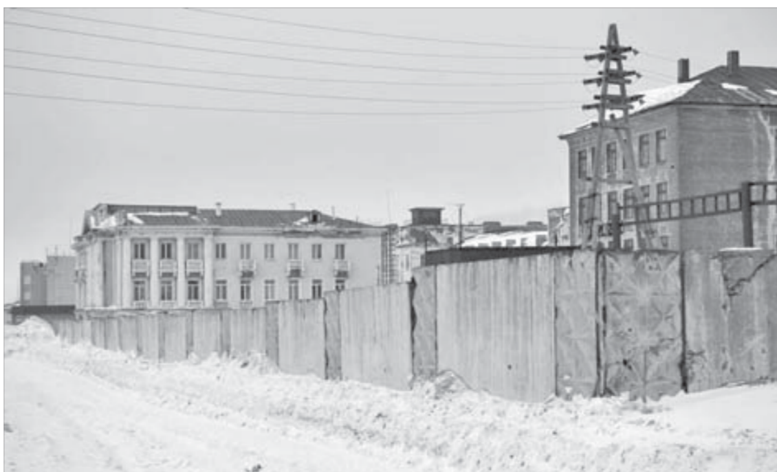
Стена на Октябрьской подходит для «граффитидрома», но кто даст разрешение ее разрисовать?