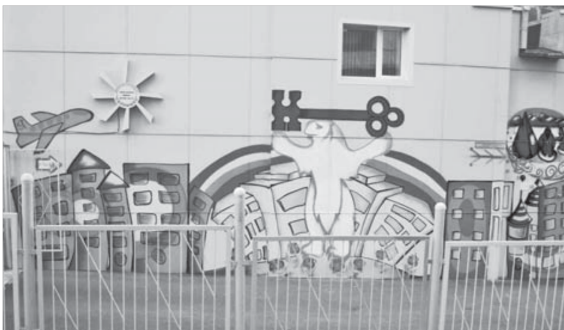
Команда граффитчиков ERS преобразила стены детского сада

По мнению министра Андрея Фурсенко, задержка с нововведением была вызвана проблемами с официальным опубликованием документа, который должен быть принят Министром. Фурсенко добавил, что о будущих изменениях в вузах знали еще в январе, поэтому учебные заведения должны были донести до абитуриентов информацию о предстоящей реформе.