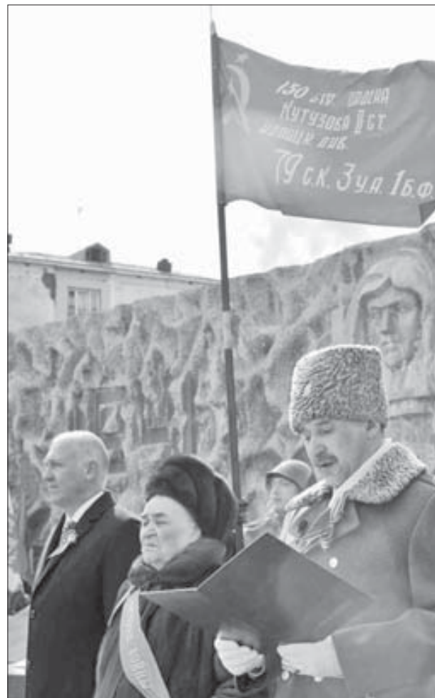
Под знаменем Победы