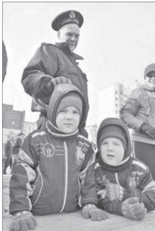
За их счастье воевали победители