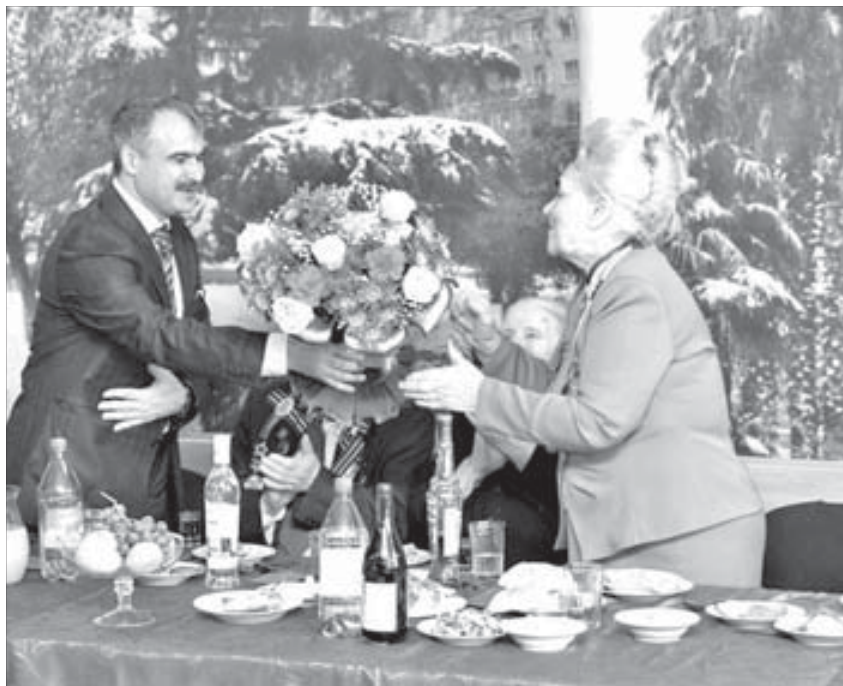
Радужие хозяев Дома дружбы не оставило ветеранов равнодушными

В честь праздника все пришедшие на встречу ветераны получили подарочные наборы и конверты с деньгами.