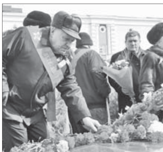
Цветы к Вечному огню горожане несли весь день