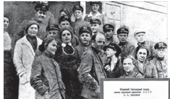
Малый театр на гастролях в Заполярье

Первые гастроли этого театра в Норильске состоялись еще при Ав-