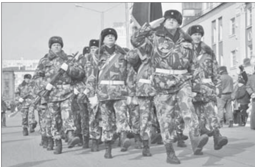
Сводный парадный расчет Норильского гарнизона