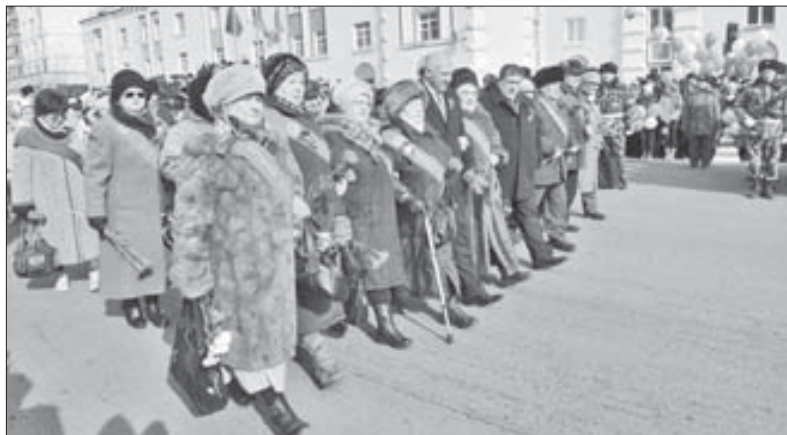
Ветераны в первых рядах