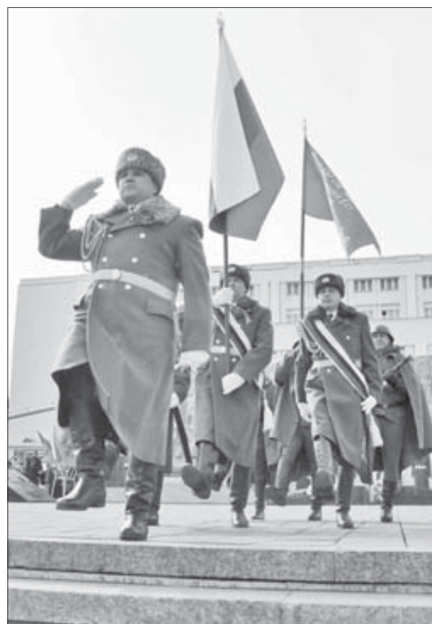
Участие в параде – почетная миссия для военных