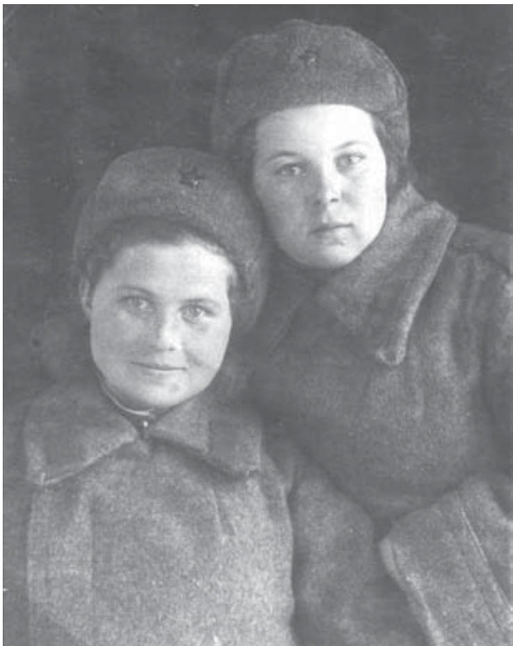
С фронтовой подругой

– Моя жизнь была тяжелой, а все же счастливой. И я желаю молодому поколению, чтобы радовались каждому дню, берегли любовь, семью, здоровье. Если нет здоровья, то ничего другого и не надо.