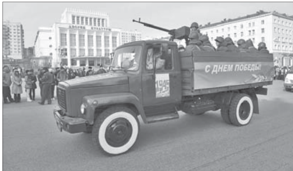
В параде участвовали шесть единиц техники