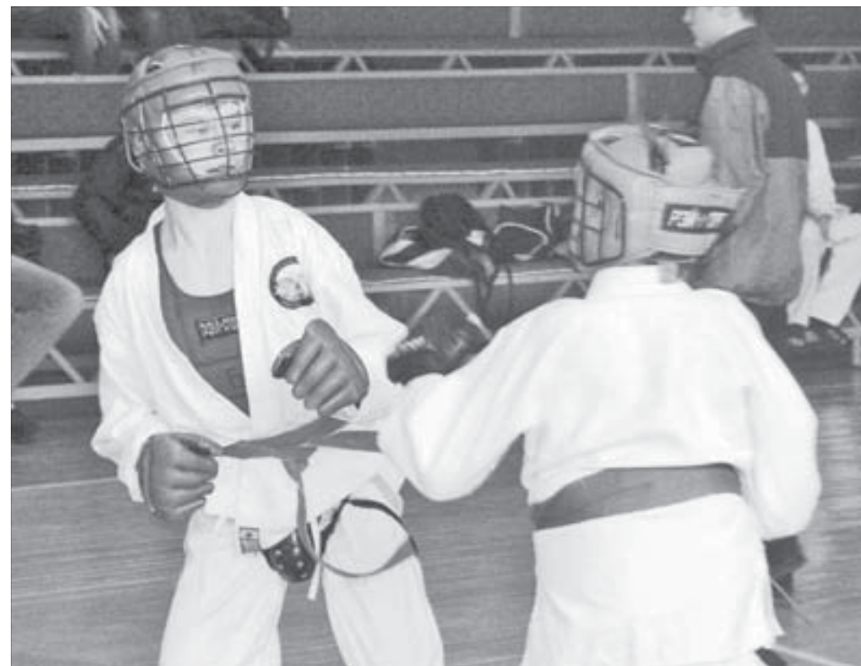
Бои для норильчан были тяжелыми