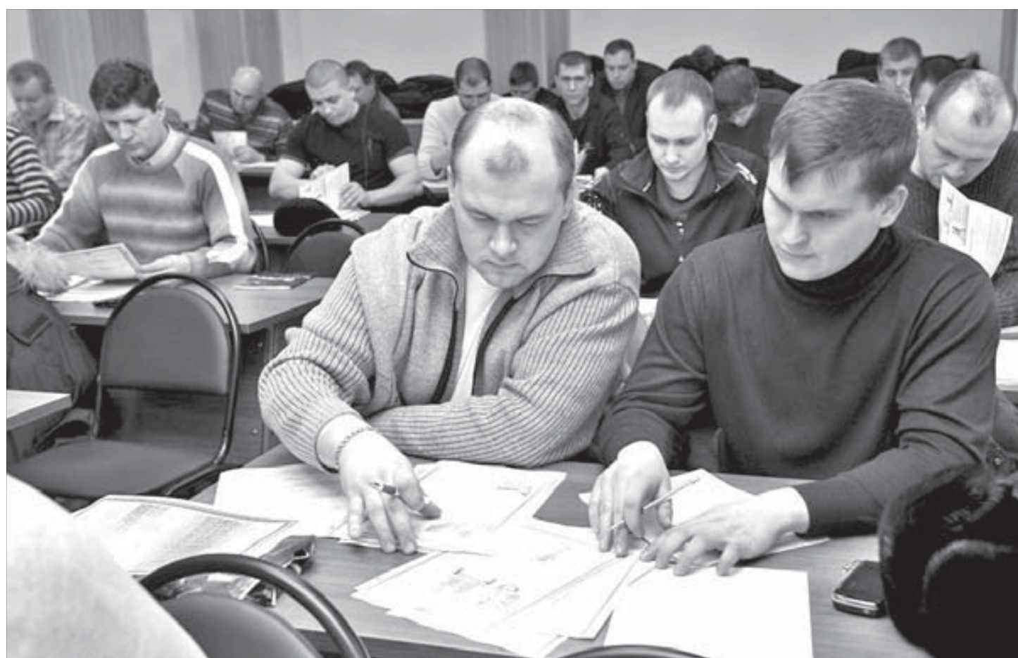
В одном из классов нового учебного центра

В 2011–2020 годах предусматривается переселение имеющих на это право 11 265 семей (не менее 1126 семей в год). На основе соглашения была разработана соответствующая долгосрочная целевая программа, которая принята в октябре 2010 года правительством Красноярского края. Как сообщает пресс-служба компании, в рамках выполнения своих обязательств в текущем году ГМК "Норильский никель" перечислила 830 млн рублей в бюджет Красноярского края. Всего на программу переселения "Норильским никелем" будет выделено 8,3 млрд рублей.