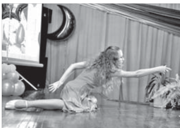
Будущим педагогам к сцене не привыкать

В Норильском педагогическом колледже прошла девятая "Фабрика звезд". Как уверяют организаторы, этот проект во многом превосходит свой телевизионный аналог, хотя бы потому, что участники удивляют зрителей не только вокальным мастерством.