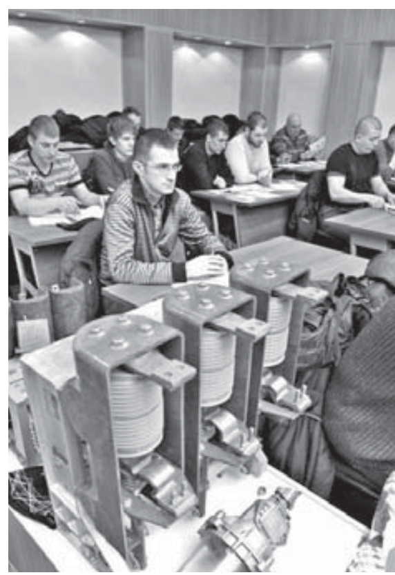
До конца года обучение и профессиональную переподготовку пройдут 690 человек