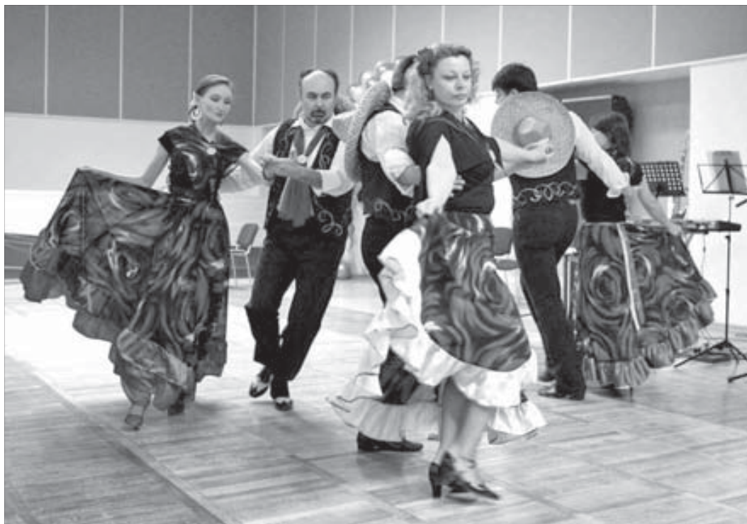
В школу аргентинского танго может поступить каждый