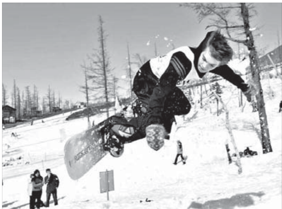
...а на сноуборде — 201 км/час