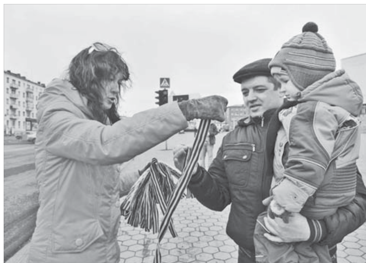
Чтобы знали, чтобы помнили

Медиакомпания "Северный город" традиционно включилась в подготовку к празднованию Дня Великой Победы. Накануне 9 Мая журналисты газеты "Заполярный вестник", телеканала "Северный город" и информационного агентства "Таймырский Телеграф" вручили норильчанам георгиевские ленточки.