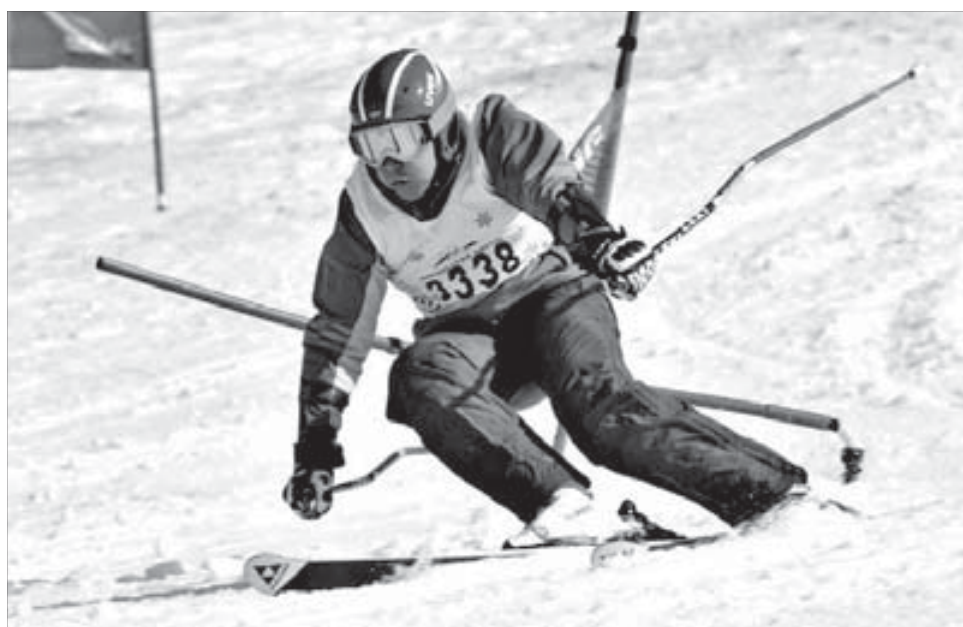
Мировой рекорд скорости на горных лыжах — 250 км/час...