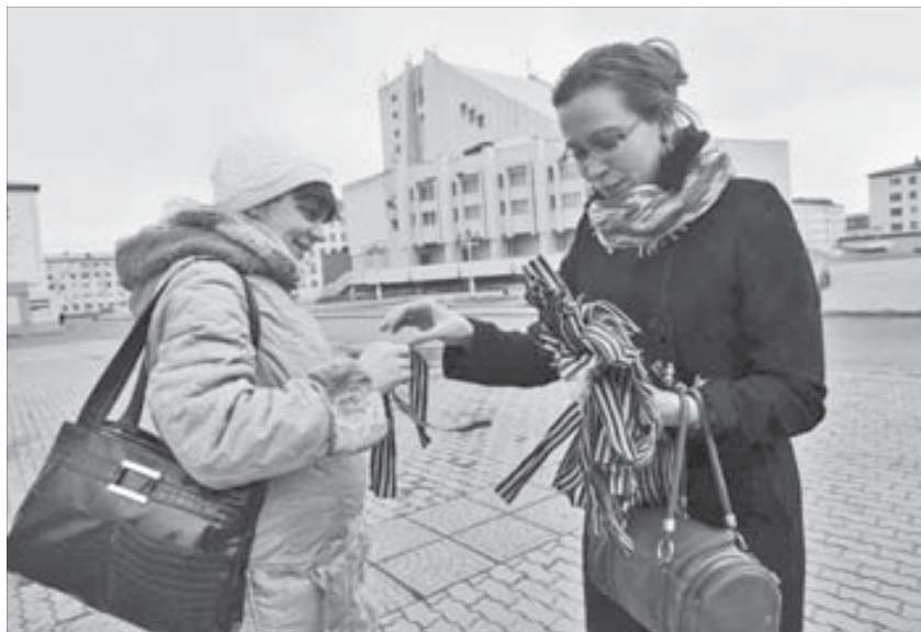
Просили для себя и для близких

Кстати, орден Георгия (от которого «пошла» георгиевская ленточка) был учрежден в 1769 году. По стату-