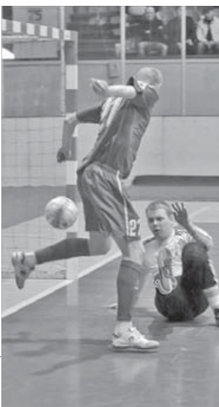
Доказано: сибирякам можно забивать