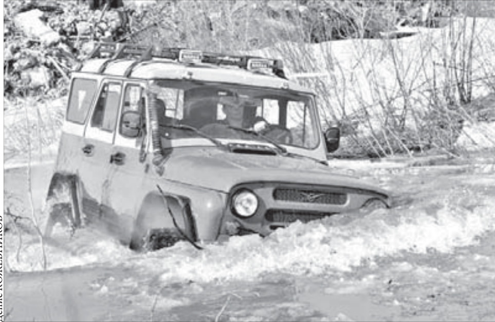
Там, где снег превратился в воду