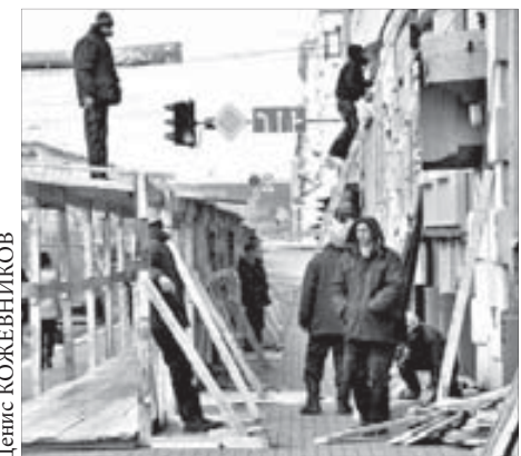
Стройплощадка на Ленинском

Немалые деньги — 185,4 млн рублей — заложены на устранение аварийности нулевого цикла. Работы будут выполнены на 28 зданиях. Более 100 млн рублей выделено на снос семи аварийных домов,