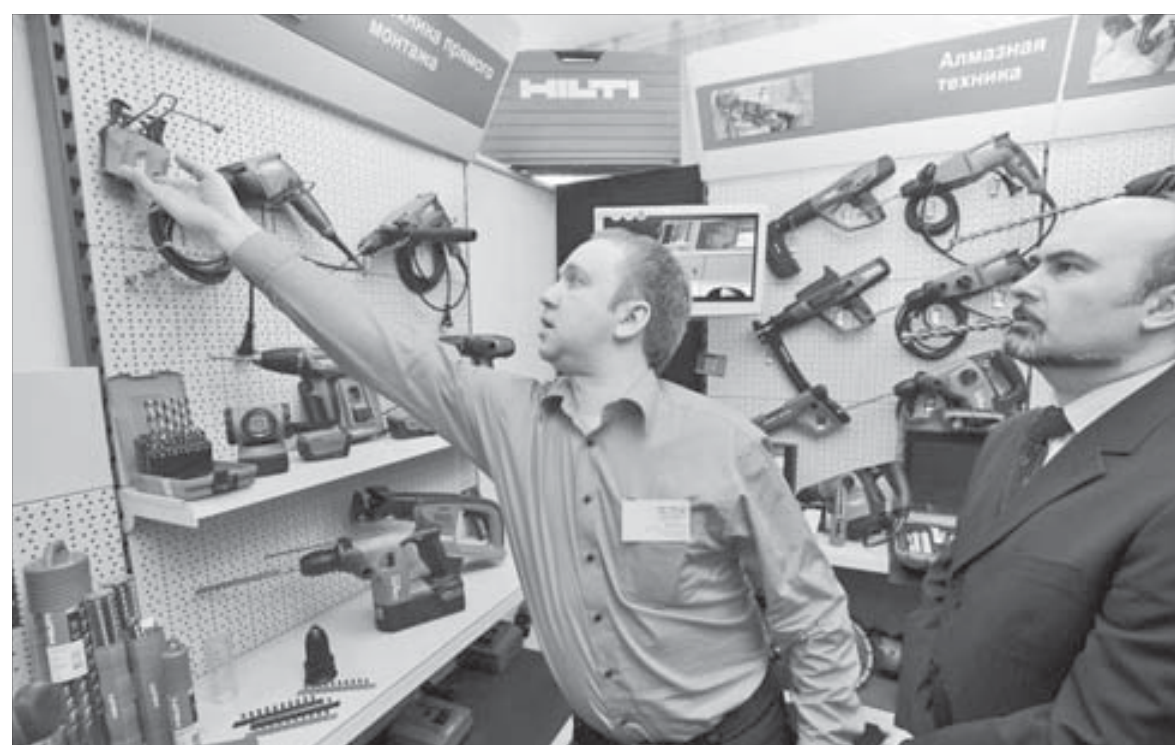
...но и посмотреть, как они работают