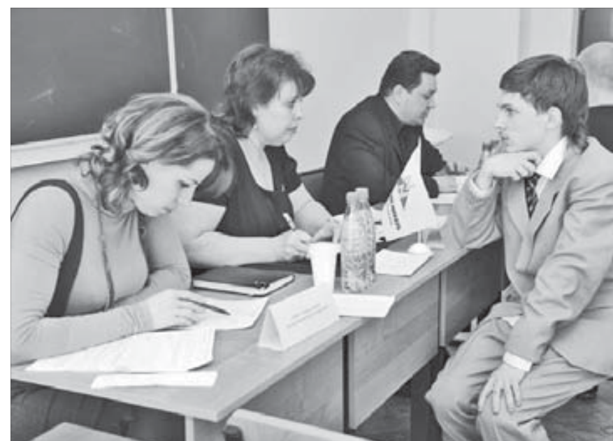
Производственники оценивают студентов...

В профессиональном училище №105 прошла традиционная ежегодная ярмарка вакансий. Работодатели представили будущим выпускникам перечень вакансий на предприятиях группы "Норильский никель".