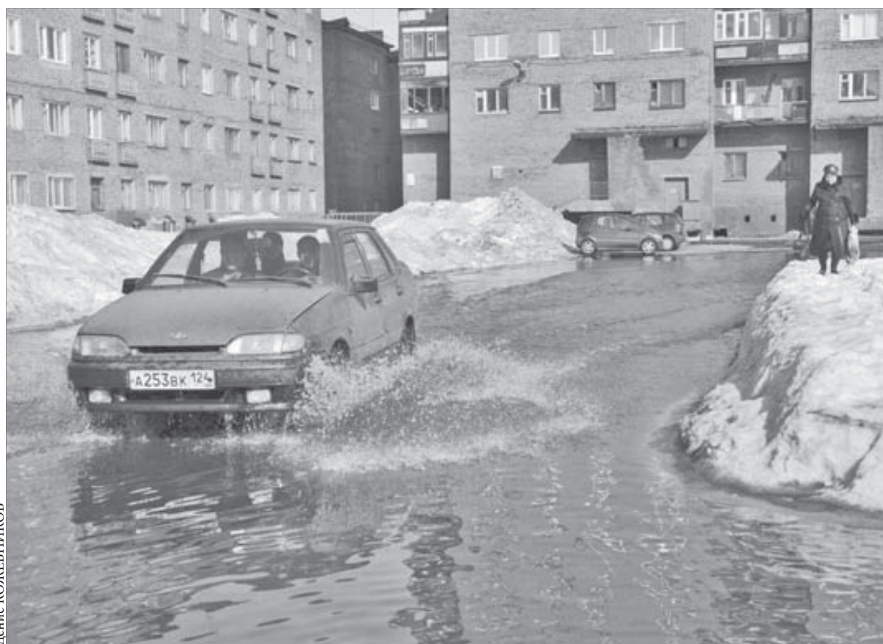
В иные дворы без плавсредства лучше не соваться