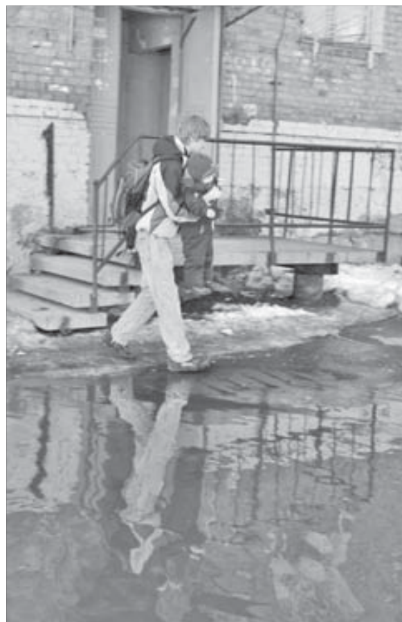
Детей приходится носить на руках