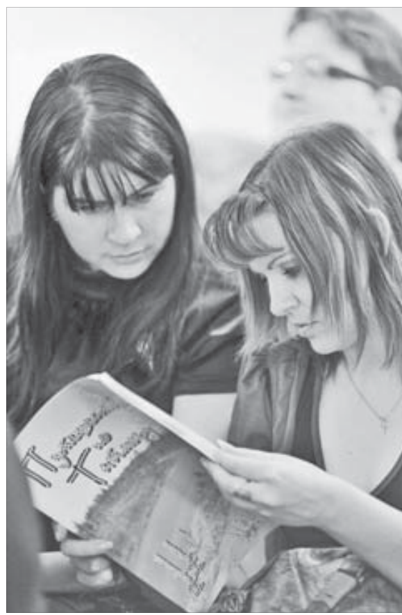
"Неизвестный Норильск" – почти настоящее издание