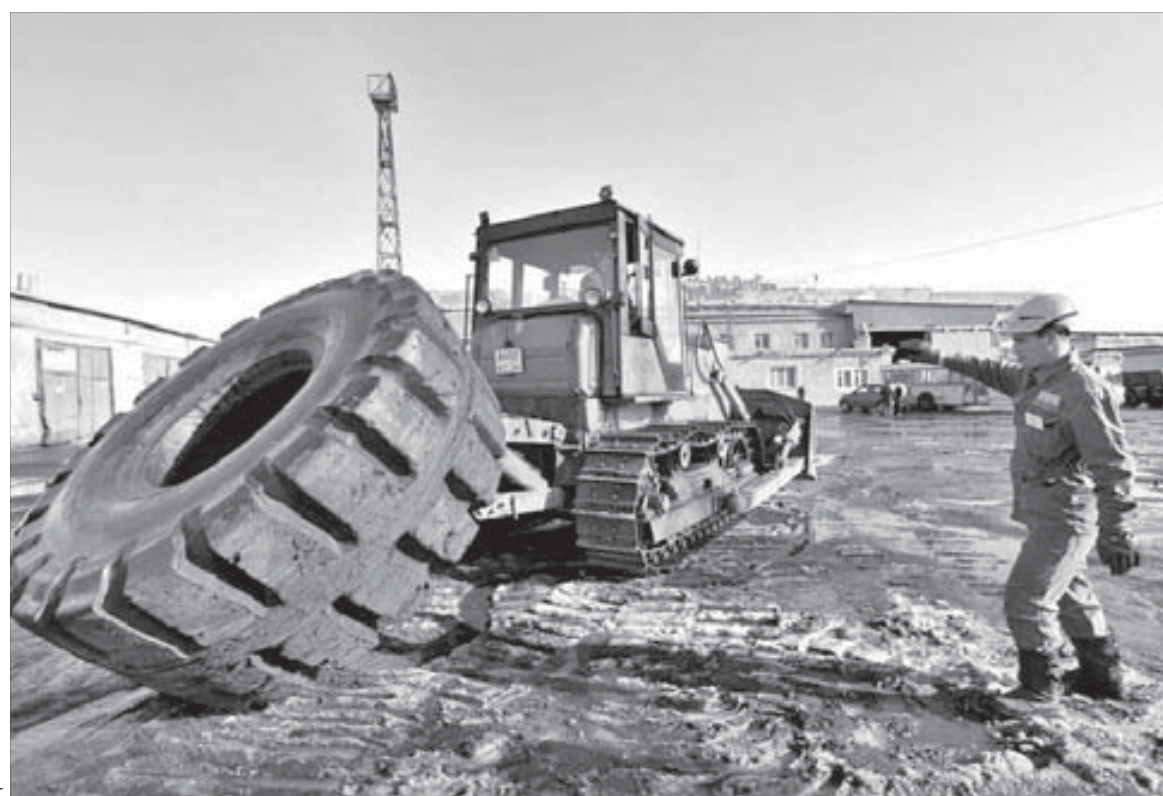
Бульдозер играет с огромным колесом, как с мячиком