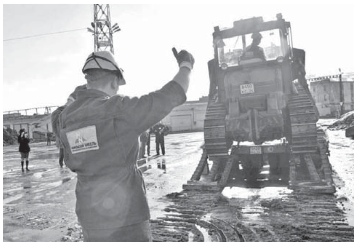
Стажеры тоже при деле – подсказывают наставнику верный путь

– Красивую работу показали бульдозеристы. И шли достаточно ровно. Участник под третьим номером прошел полосу препятствий за 5 минут 50 секунд, а участник под вторым номером – за 6 минут 20 секунд.