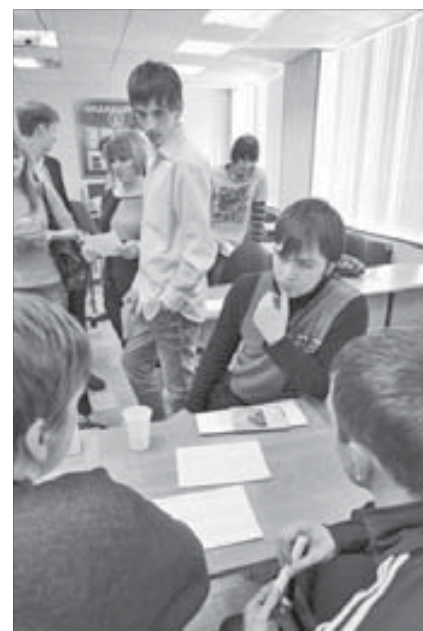
...Студенты оценивают перспективы

Более подробную информацию о подготовке студентов, списке профессий и условиях обучения можно узнать по адресу: улица 50 лет Октября, 10, или по телефонам 42-16-86, 42-17-03, 42-16-88, 42-17-07.