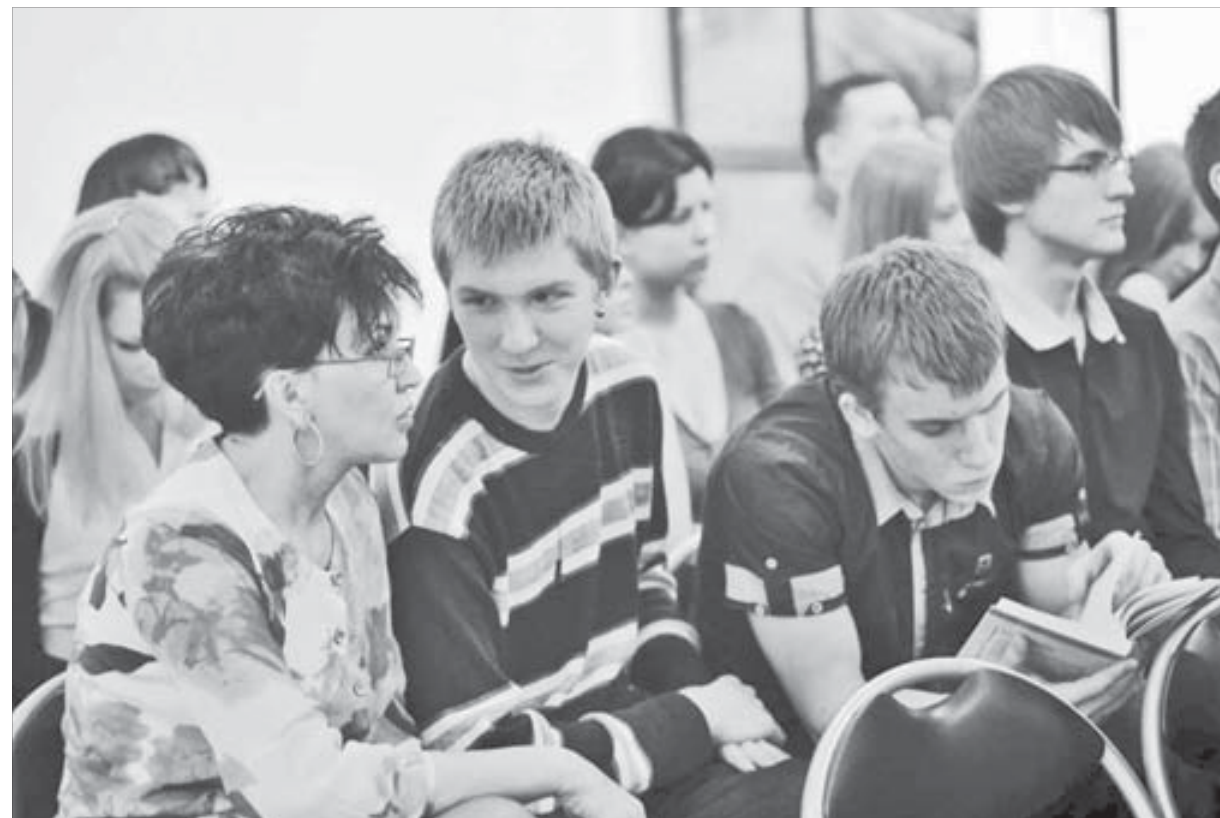
Юное поколение исследователей

В решении первой городской конференции записали, что подобные собрания в Норильске станут ежегодными. Что необходимо составить каталог исследователей территории (КИТ). Некоторые горожане в ходе конференции записывали адреса, например, школьных музеев, которые хотелось бы посетить. Так что КИТ непременно будет востребован. Не зря же он к нам заплыл.