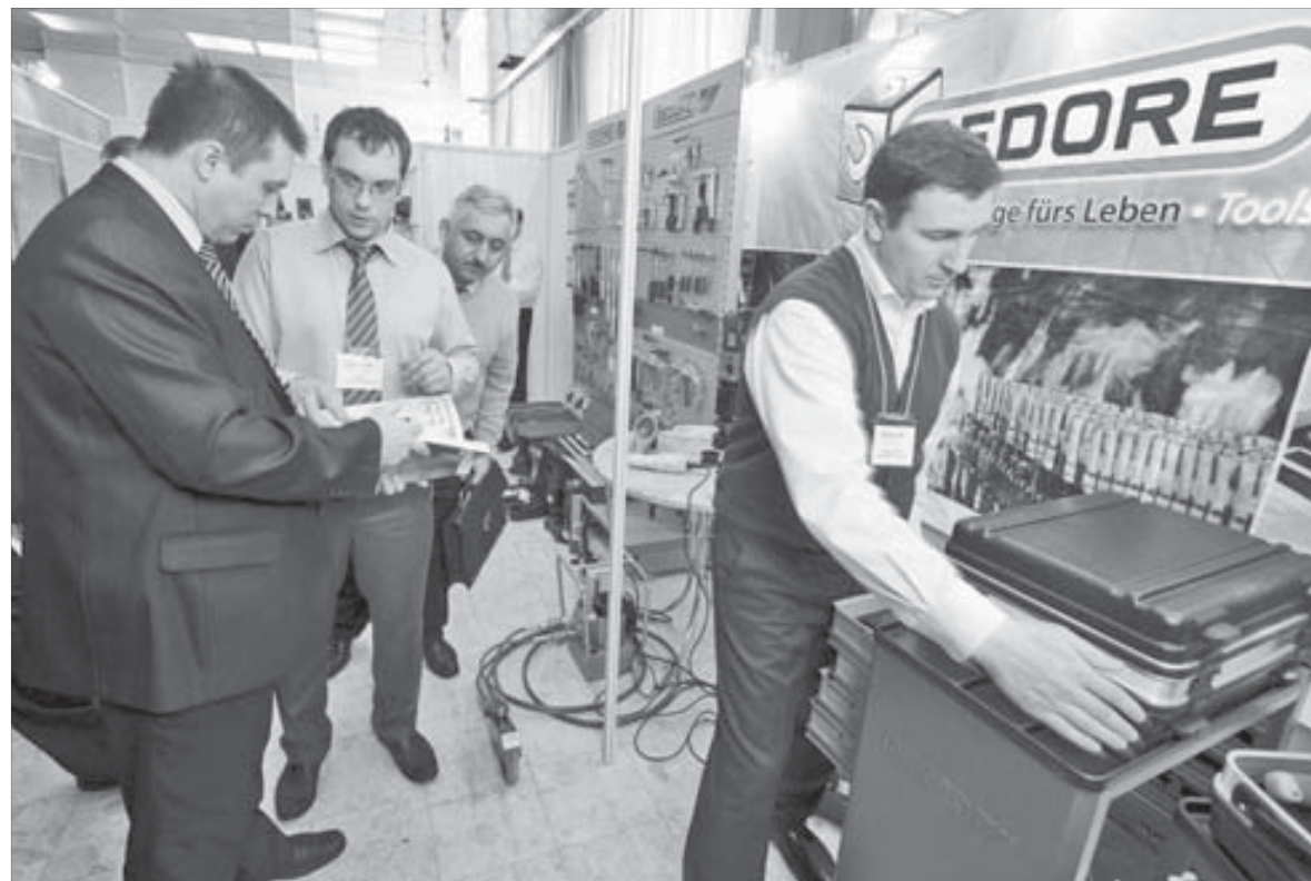
Все образцы можно было не только увидеть и подержать в руках...

В соответствии с транспортно-эксплуатационным состоянием автомобильных дорог предельно допустимая нагрузка на оси транспортного средства составляет пять тонн. Для движения транспортных средств, нагрузка на оси которых превышает предельно допустимую норму, нужно получить специальное разрешение. В случае его отсутствия к нарушителям будут применяться меры, предусмотренные действующим законодательством.