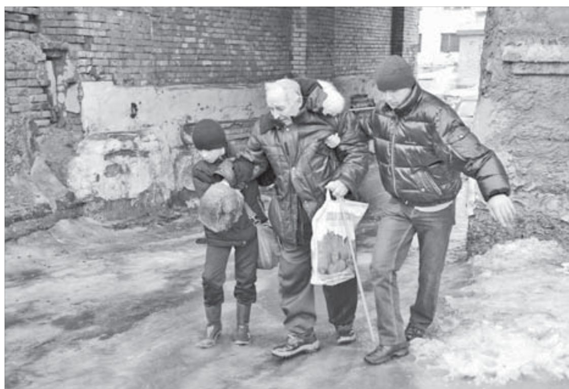
Без помощи трудно совладать с распутицей

На самые интересные вопросы глава города ответит в прямом эфире программы "Город" телекомпании "Норильск" и в специальной рубрике газеты "Заполярная правда". Кроме того, все вопросы и ответы будут размещены на сайте www.norilsk-city.ru .