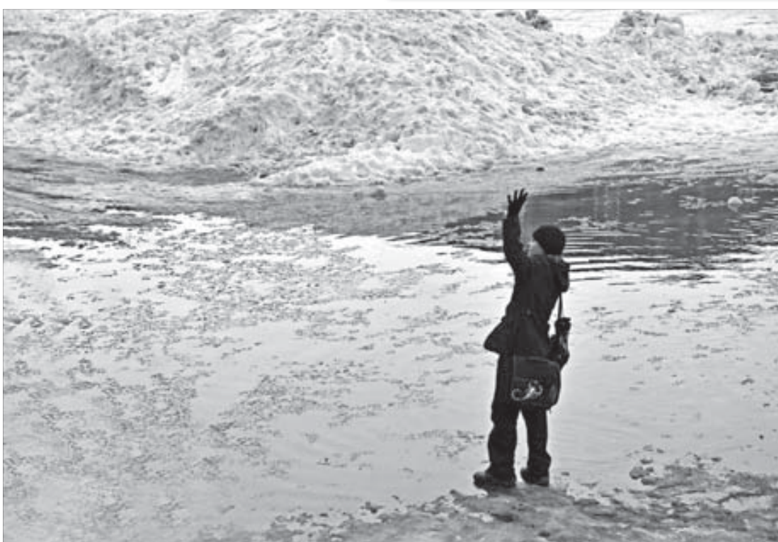
А я стою на берегу, не видно краю...

Управление социальной политики администрации города Норильска в рамках долгосрочной муниципальной целевой программы "Социальная поддержка жителей муниципального образования "Город Норильск" на 2011 год продолжает прием документов на оказание материальной помощи одиноким женщинам, впервые родившим ребенка и находящимся в трудной жизненной ситуации