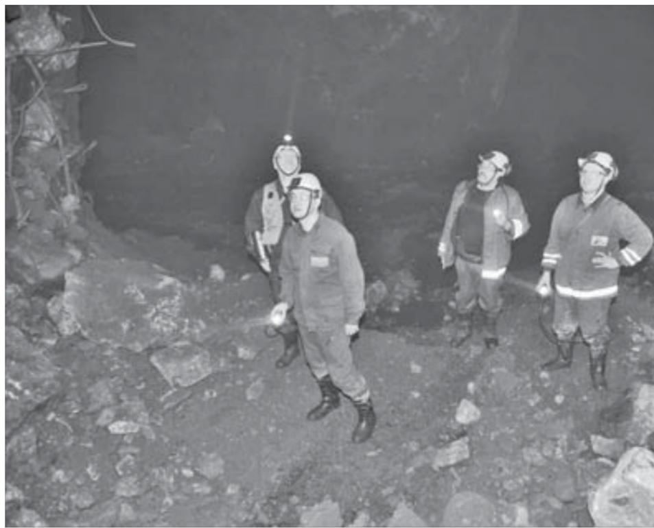
Кровля в большеобъемных камерах терается далеко вверх

Расчеты бурения веерных скважин проводит маркшейдерский отдел. Разрабатывается план бурения – специальная схема, на которой обозначается точная глубина, до сантиметра, и точный угол – до сотой доли градуса. Маркшейдеры делают визуальную разметку выработки и вводят схему бурения в компьютер буровой установки Atlas Copco Simba M7S. Только после этого к делу приступают бурильщики.