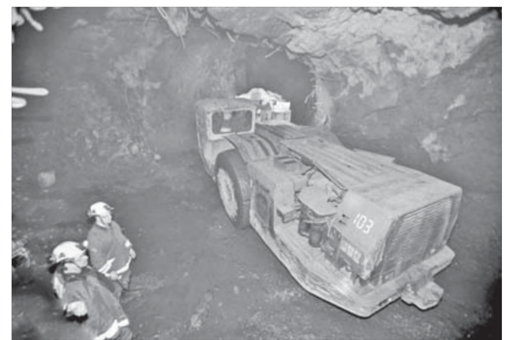
Отгрузка руды производится ПДМ с дистанционным управлением