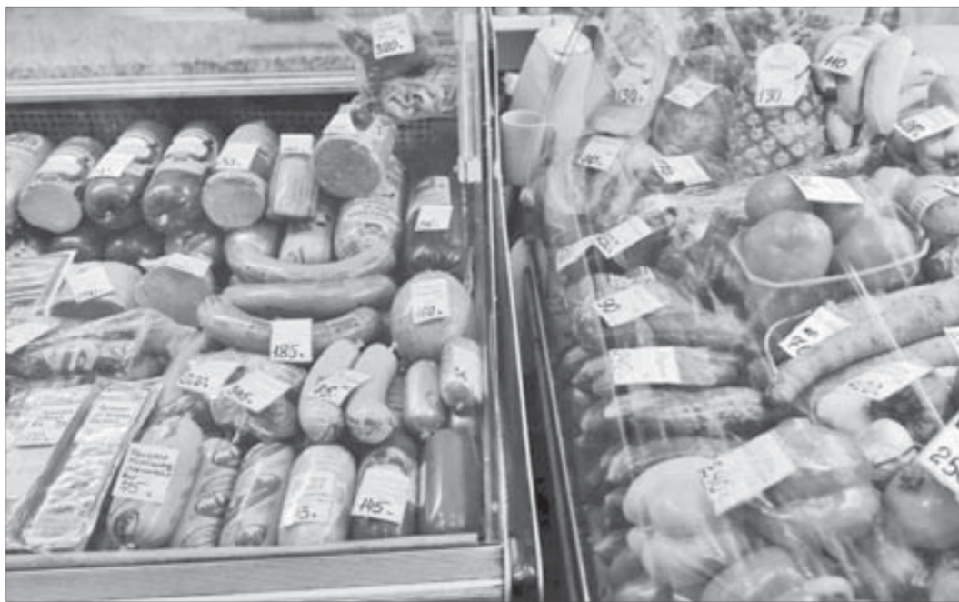
Как хорошо питаться и не оставлять всю зарплату в магазинах?