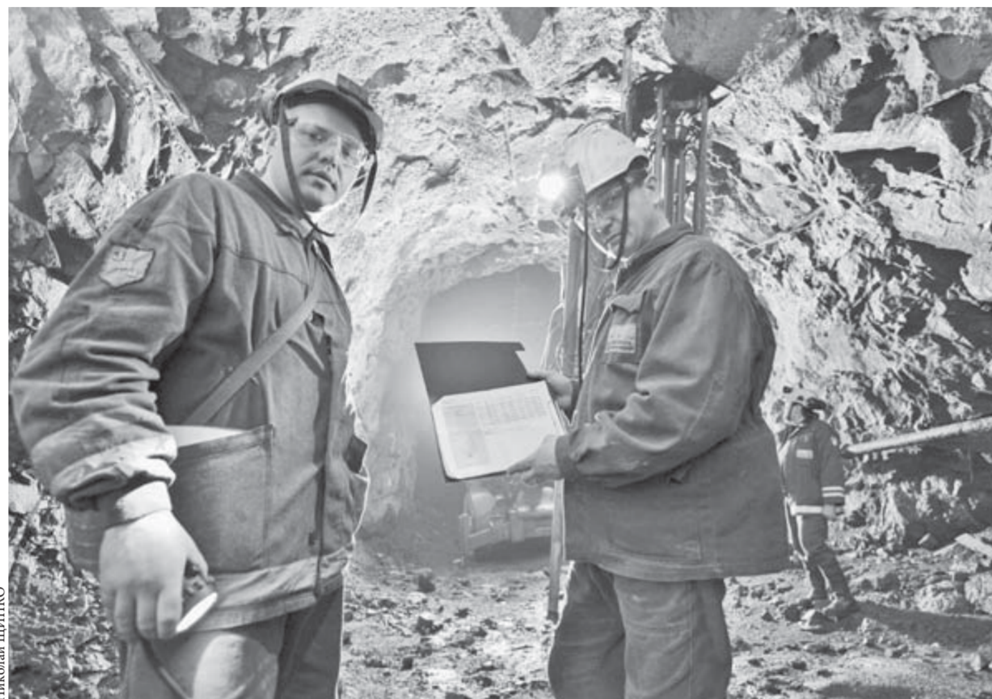
Верное бурение ведется по точной, рассчитанной на компьютере схеме

Центробанк РФ выпустил в обращение монету из медно-никелевого сплава номиналом в 25 рублей. Монета, украшенная символикой зимней Олимпиады в Сочи 2014 года, пока выпущена тиражом 10 млн экземпляров, а в будущем, если спрос будет высоким, Гознак предполагает увеличить тираж до 30 млн. На данных монетах впервые в современной истории России на лицевой стороне будет изображен государственный герб. Также в ходе монетной программы “Сочи-2014” с 2011-го по 2014 год будет выпущено 46 видов памятных и инвестиционных монет из золота, серебра и цветных металлов суммарным тиражом более 36 млн штук.