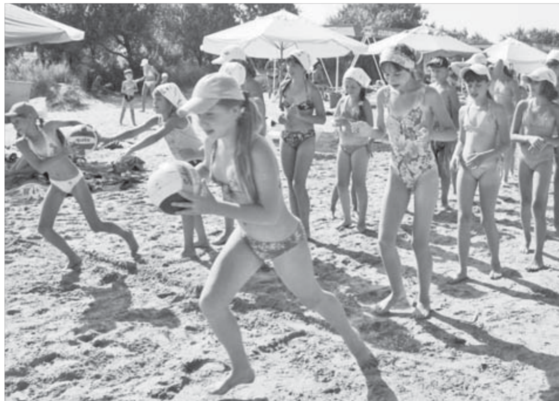
Чтобы дети хорошо провели лето, взрослые стараются весь год