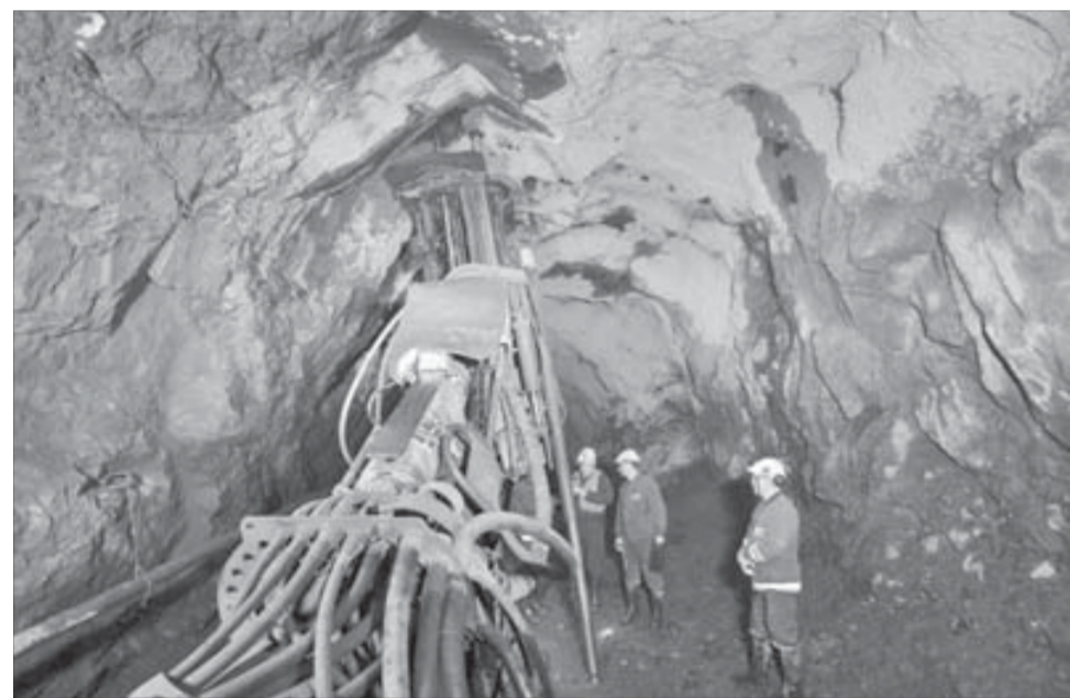
Современная техника открывает новые горизонты