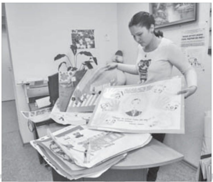
Автор каждого рисунка получит диплом на память

Как обещают организаторы, каждый участник конкурса, независимо от его результатов, получит дипломы от проекта "Папа, подумай обо мне!". Оценка работ продлится до 25 апреля, а 30-го победителей ждет торжественная и веселая церемония награждения.