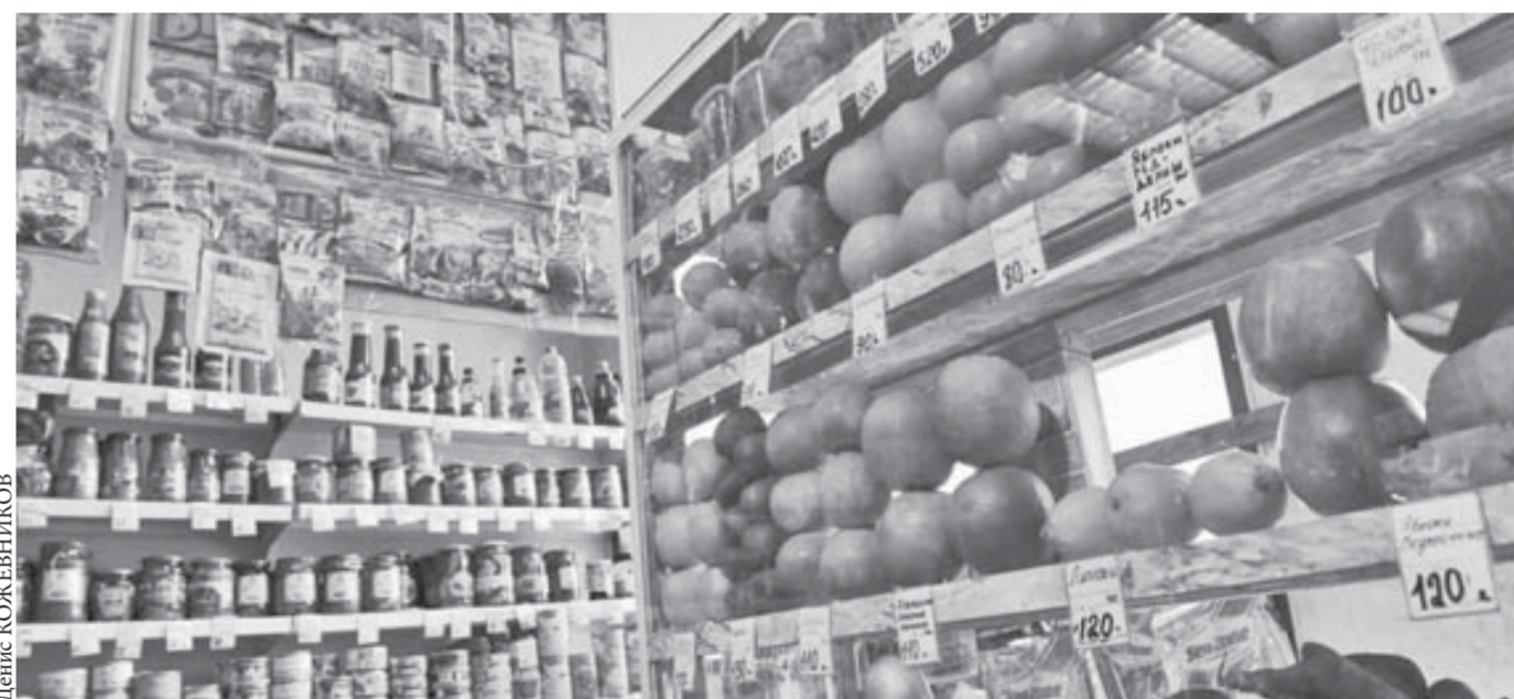
Ассортимент богат, цены растут