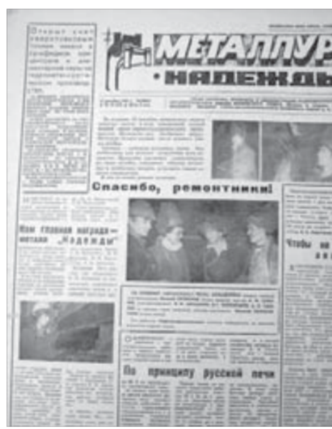
Страницы заводской летописи