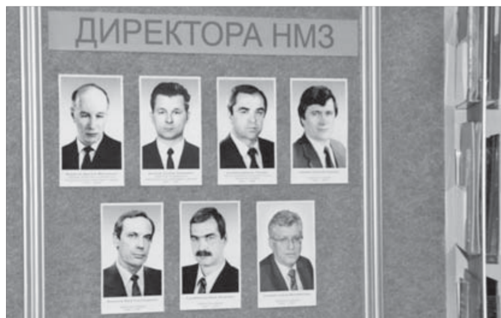
"Надежде" везло на директоров