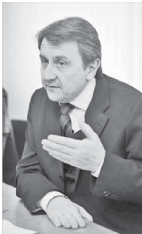
Директору вручили персональный пропуск

Выкладки по разведке и освоению сырьевой базы, технологиям и модернизации производства, из которых следует реализация экологических программ, приводят к выводу, что работы в Норильске хватит