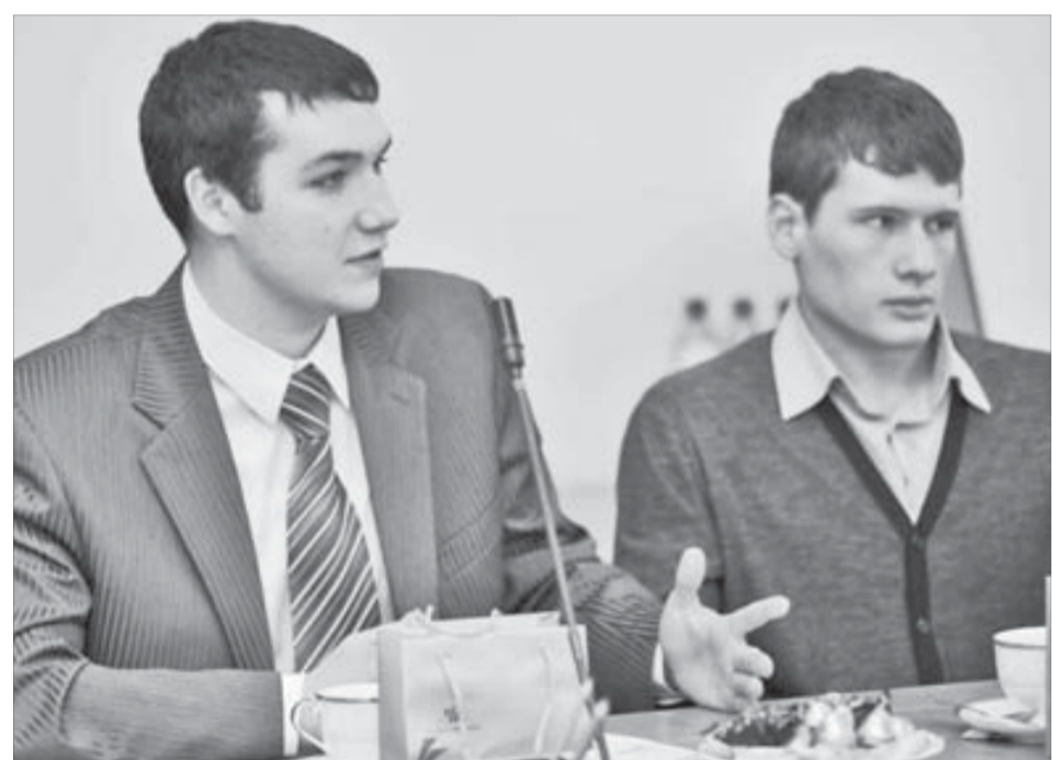
В Норильске для студентов хорошие перспективы