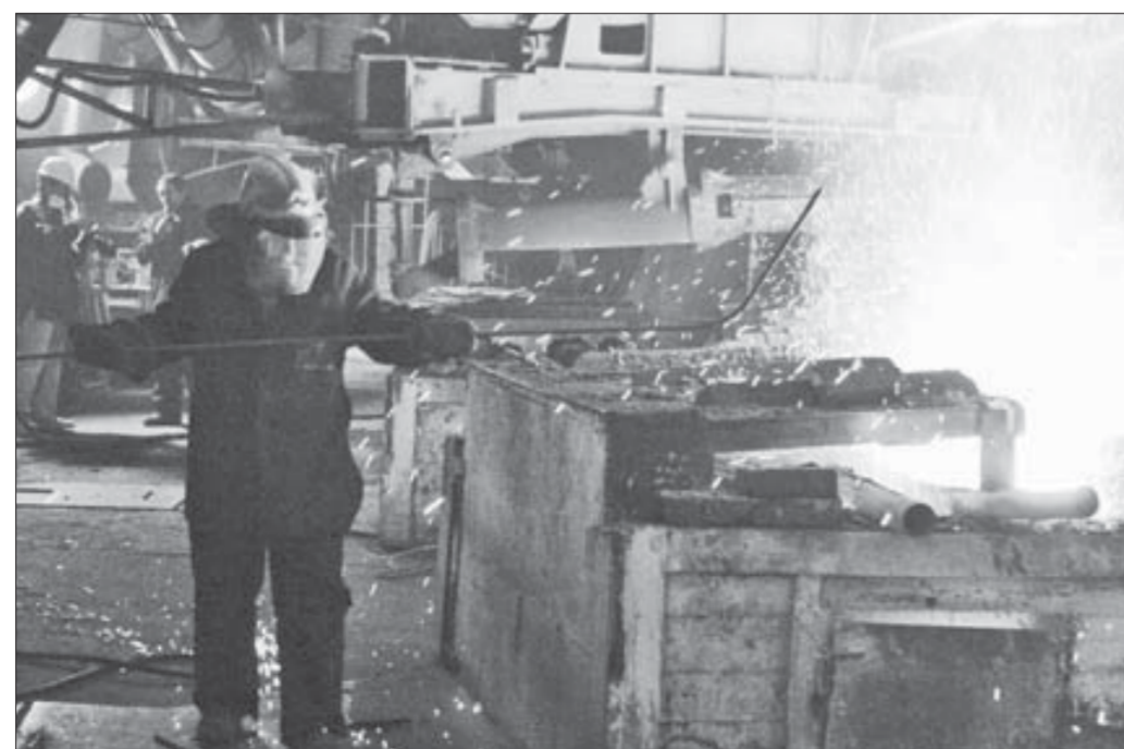
История пишется в буднях

Как мы уже сообщали, этот год для Надеждинского металлургического завода имени Б.И.Колесникова знаковый. 8 июля его коллектив отметит 30-летие пуска в эксплуатацию второй очереди предприятия. Продолжаем рассказывать об истории завода, его людях, настоящем и будущем.