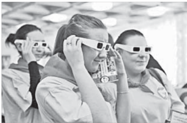
На технику безопасности – новым взглядом

Цель мероприятия – развитие активности и творческой инициативы молодых специалистов компании и знакомство школьников