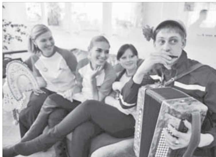
Частушки и гармонь – хорошие средства для решения проблем

– Отборочные туры, а их было шесть, прошли в школах Нориль-