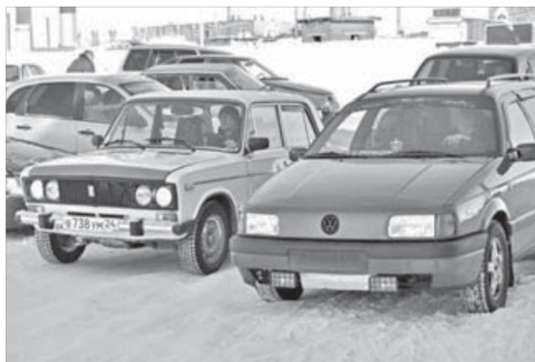
При перепродаже автомобиля можно оставить старые знаки