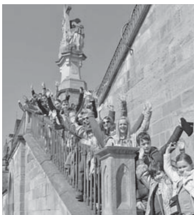
Прага подарила чудесные впечатления

Самые интересные подробности о поездке в Прагу, которую “Норильский никель” подарил победителям конкурса, и впечатления ребят читайте в ближайших номерах “Заполярного вестника”.