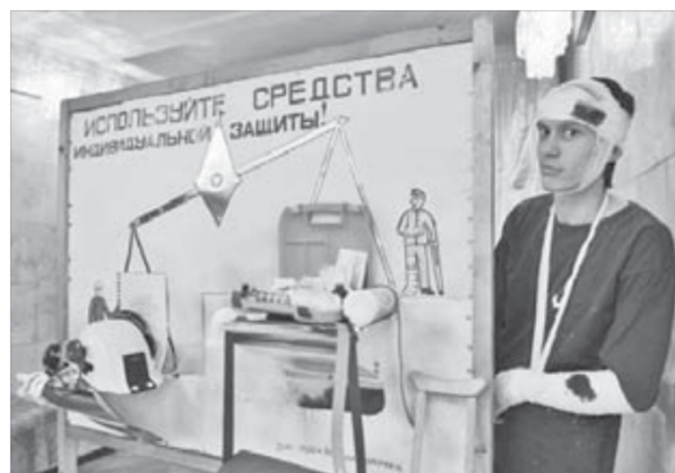
Интерактивные модули – отличный наглядный пример

По итогам конкурса на лучший кабинет профориентации первое место поделили школа №42 и лицей №3, второе место заняла школа №20, третье – центр образования №1. Они получили ценные подарки – ноутбуки. Также руководством Заполярного филиала “Норильского никеля” отмечено восемь лучших школьных профориентаторов по итогам 2010 года.