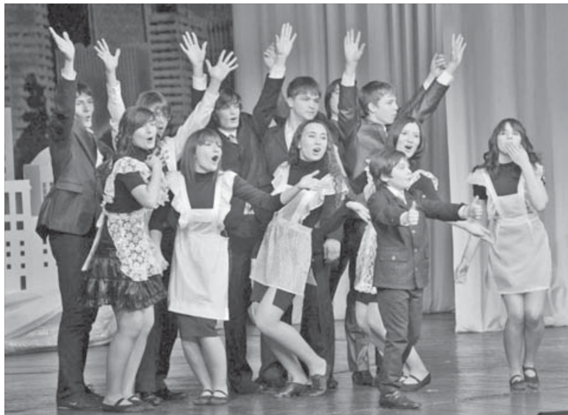
Школьники – кадровый потенциал для предприятий “Норильского никеля”