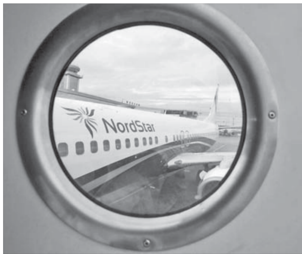
NordStar стал доступнее

Обычно этот песенный праздник проходил в Норильске в феврале, но нынче из-за эпидемии гриппа его пришлось перенести на апрель. Что не сказалось на количестве участников фестиваля – более трехсот детей. В музыкальном конкурсе выступят 17 солистов, семь ансамблей и 10 хоровых коллективов детских школ искусств, норильской музыкальной школы, колледжа искусств и центра внешкольной работы. Фестиваль продлится два дня, 16-го и 17 апреля.