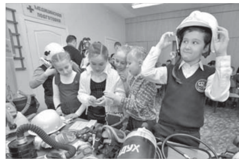
Впечатления подсказку ребятам темы рисунков

— Эти малыши очень сообразительны, — поделились впечатлениями спасатели после беседы с ребятами. — Например, они знают, что такое тем-