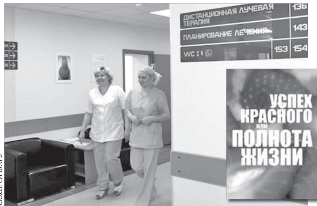
Лицензия получена, логистика взаимодействия с пациентами продумана

По замыслу автора и организаторов выставки, Норильской художественной галереи и благотворительного фонда "Территория добра", лечение искусством способно помочь больному справиться с жизненными трудностями и чувствовать себя полноценным человеком.