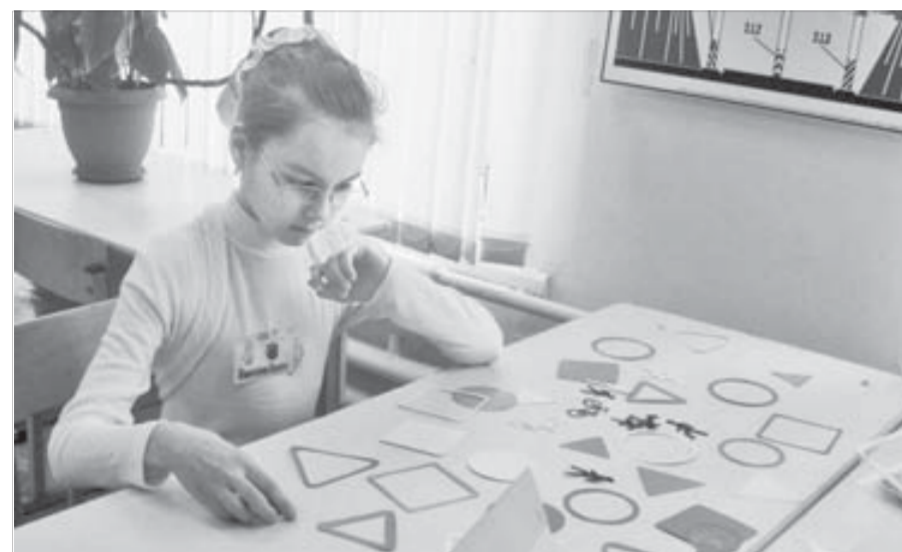
В дорожных знаках дети доки

Цель у "Безопасного колеса" уже на протяжении более 10 лет одна – предупреждение детского дорожно-транспортного травматизма, привлечение школьников к изучению правил до-