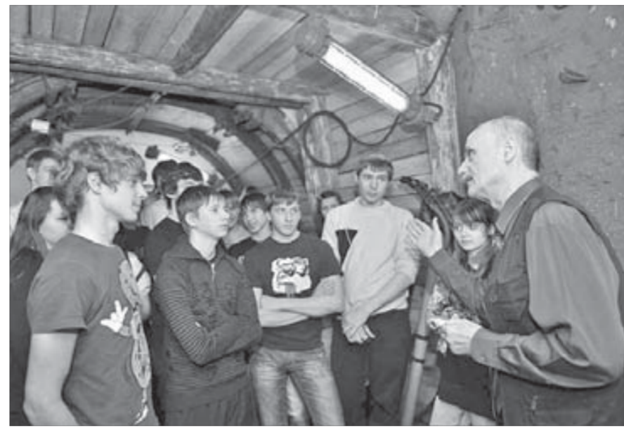
В учебной шахте — особый интерес

Напомним, для совершенствования учебного процесса, приобретения специального оборудования, компьютерной и периферийной техники и программного обеспечения для реализации инновационной образовательной программы «Модернизация содержания образовательных программ подготовки высококвалифицированных рабочих по направлению «горнодобывающая и металлургическая промышленность» для кадрового обеспечения предприятий группы «Норильский никель» профессиональному училищу №105 выделены средства в размере 60 миллионов рублей. Многие наглядные