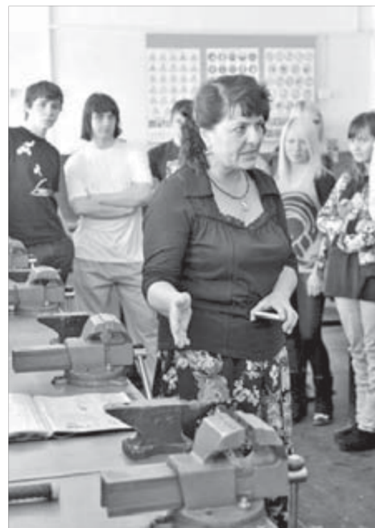
Здесь учат изготавливать инструменты

В профессиональном училище №105 стартовали дни открытых дверей. Первые экскурсии настолько впечатлили школьников, что многие из них тут же определились с будущей профессией.