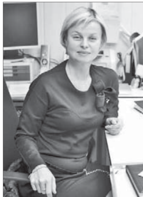
"ФГОС не повод для волнений"