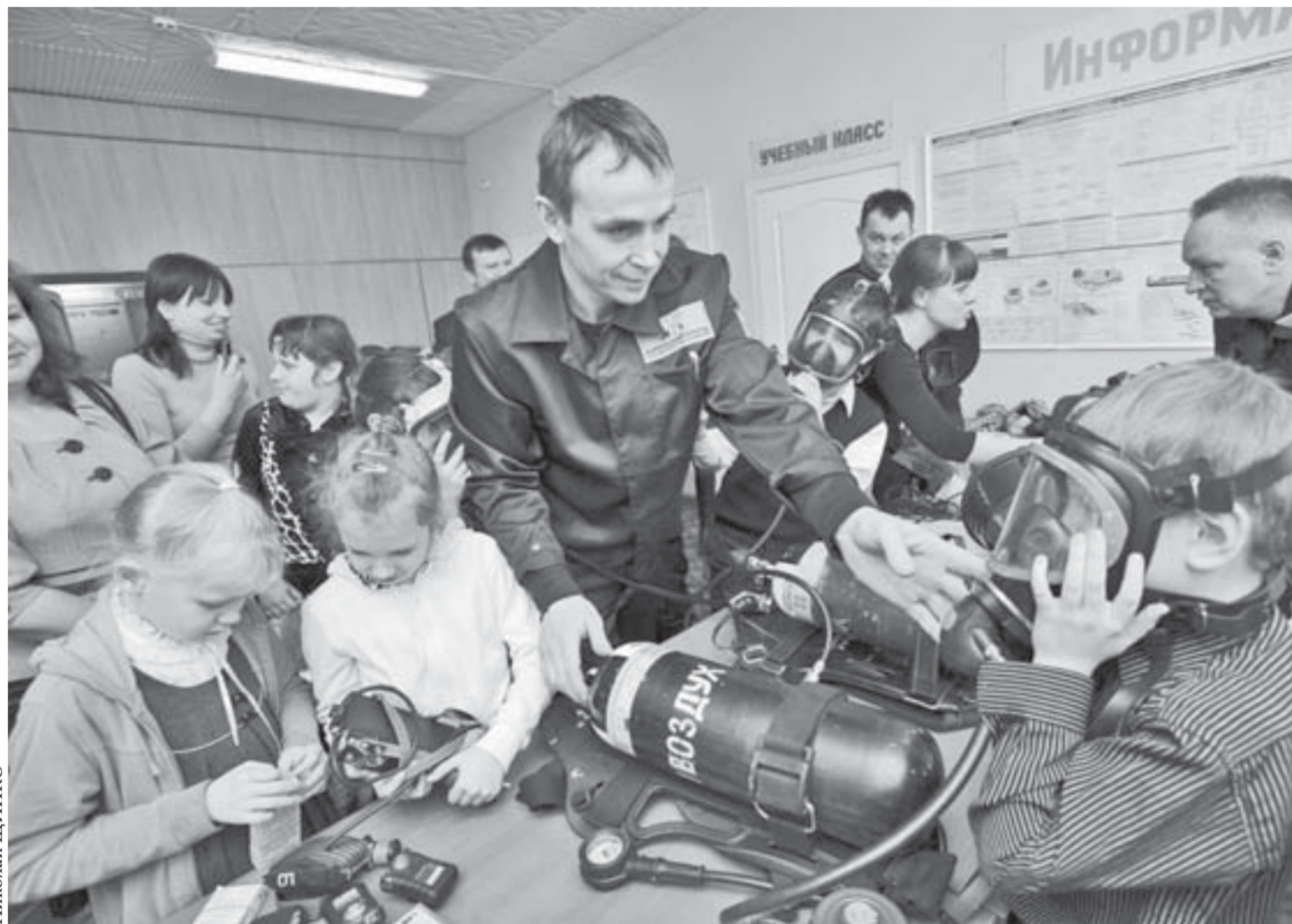
В газоспасательной службе есть на что посмотреть

В течение 15 минут на перемене учащиеся 6–11-х классов должны были подготовить выпуск стеногазет. Команды 6–8-х классов делали плакаты в форме звезд, вырезанных из ватмана. Темы выпусков самые разные, например "Первый человек в космосе". Фотографии, рисунки, вырезки из профессиональных газет и журналов и все, что могло пригодиться для оформления, ребята заготавливали в выходные. Старшеклассники также из ватмана делали космические корабли. "Звездные" плакаты и корабли сразу же размещались в рекреации четвертого этажа гимназии. – Мы сегодня не выпускаем стандартные стеногазеты к праздникам, как это было в советские времена, потому что школьникам это не очень интересно. Но вот такой подход, в форме флешмоба, оказался востребован учащимися, и все ребята получили большое удовольствие от проделанной работы, – отметила Яна Кутелева, заместитель директора гимназии по воспитательной работе. Участники флешмоба будут награждены в пятницу на торжественной линейке.