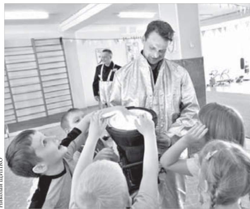
Малыши теперь знают о ТБ не понаслышке