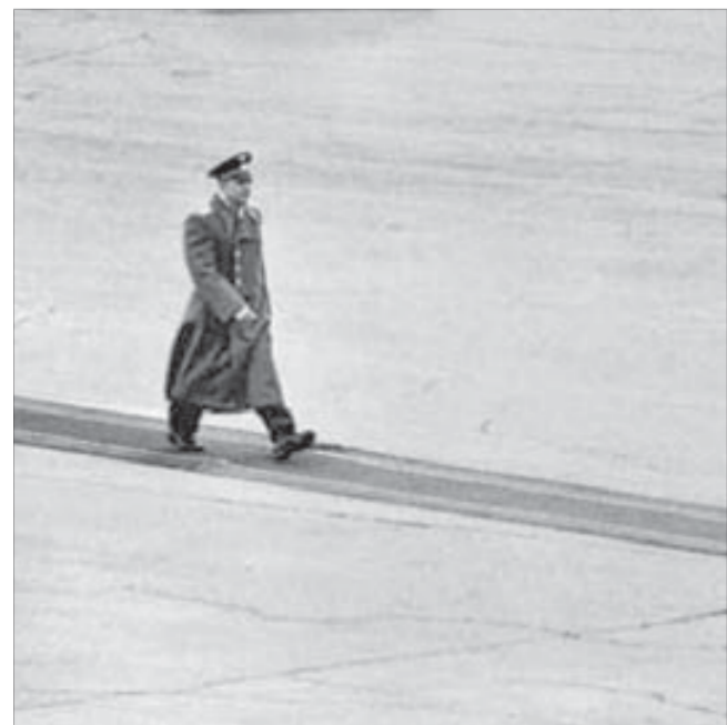
Встреча Гагарина во Внуково транслировалась на весь мир

Уже давно я не слушаю музыку в наушниках на улице. Потому что однажды из-за них не услышал сигнала автомобиля, к счастью, все же сумел затормозить в сантиметре от меня. Реакцию водителя легко представить. Он интересовался: если я так не хочу жить, зачем же заставлять его решать эту проблему? Причем на глазах у других. Мне нечего было возразить в ответ.