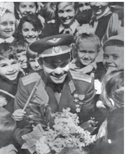
Им улыбался первый космонавт