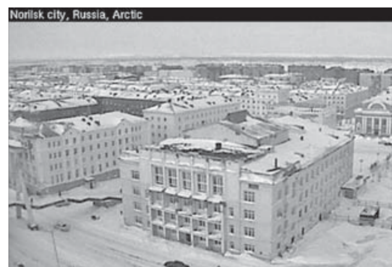
Норильск онлайн на сайте "ЗВ"

— Это очень удобно тем, кто сейчас живет в других городах и странах и не имеет возможности побывать в северном