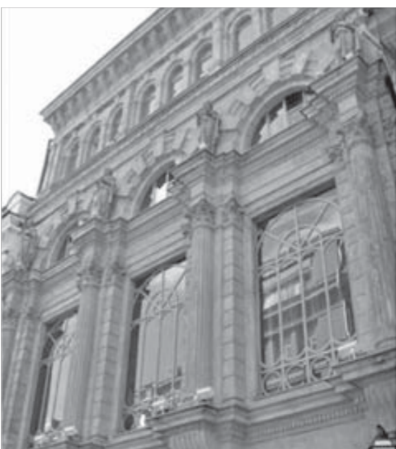
А аптеки Феррейна больше нет