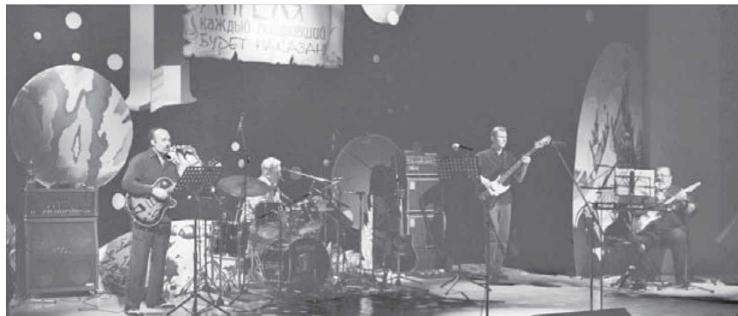
Концерт оказался богат на ансамбли

От такого количества поющих начальников настроение зрителей было на высоте. Те, кто впервые попал на "Планерку", решили постоянно ее посещать в будущем.