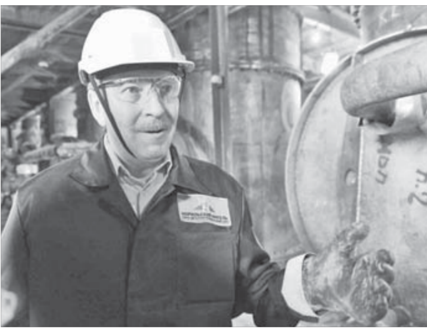
Работа у гидрометаллурга не пыльная, но... влажная