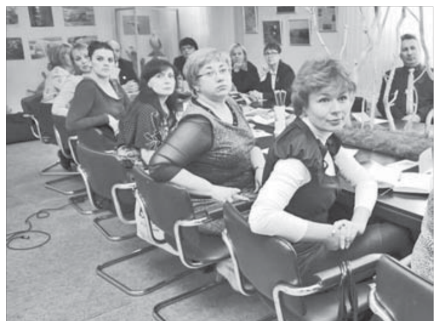
Проект заинтересовал представителей школ