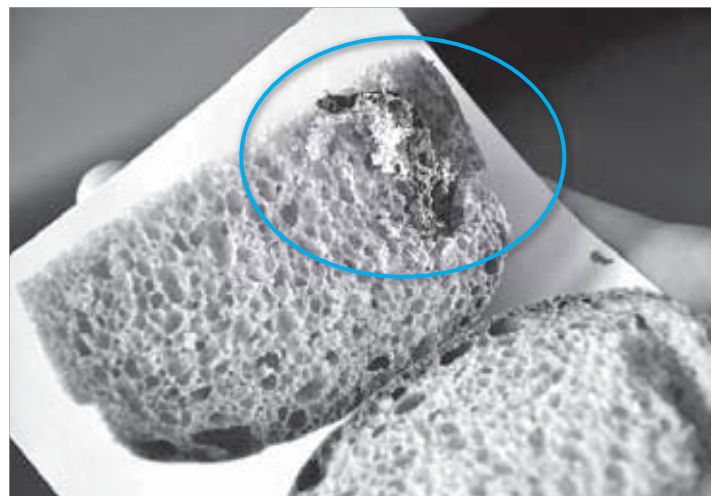
Металлический сюрприз от производителя