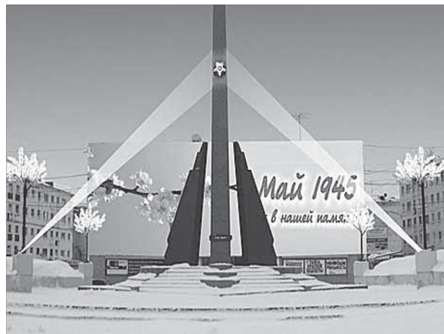
Такой проект актуален лишь для темного времени суток