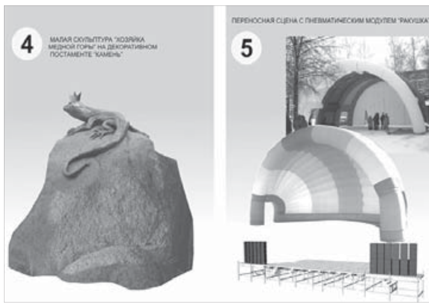
Малые архитектурные формы и мобильная сцена преобразят площадь Горняков

Стоимость работ составит около 12,5 млн рублей на каждое здание. Использование энергосберегающих материалов позволит не только значительно увеличить теплоизоляцию здания, но и продлить срок его