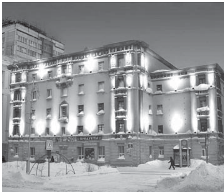
Проект подсветки этого фасада требует доработки