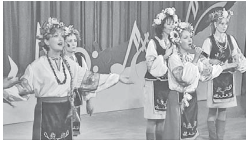
Вот такие они, "Весняночки"!