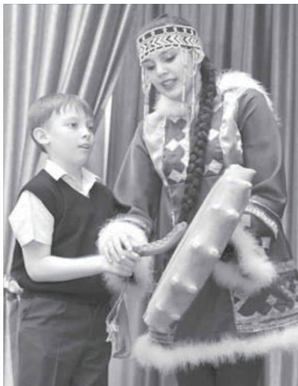
Награда за хорошие отметки

– Концерт получился на славу. К сожалению, мы не имеем возможности разместить в зале одновременно всех школьников. Поэтому посмотреть выступление “Хэйро” пришли только те ребята, которые хорошо