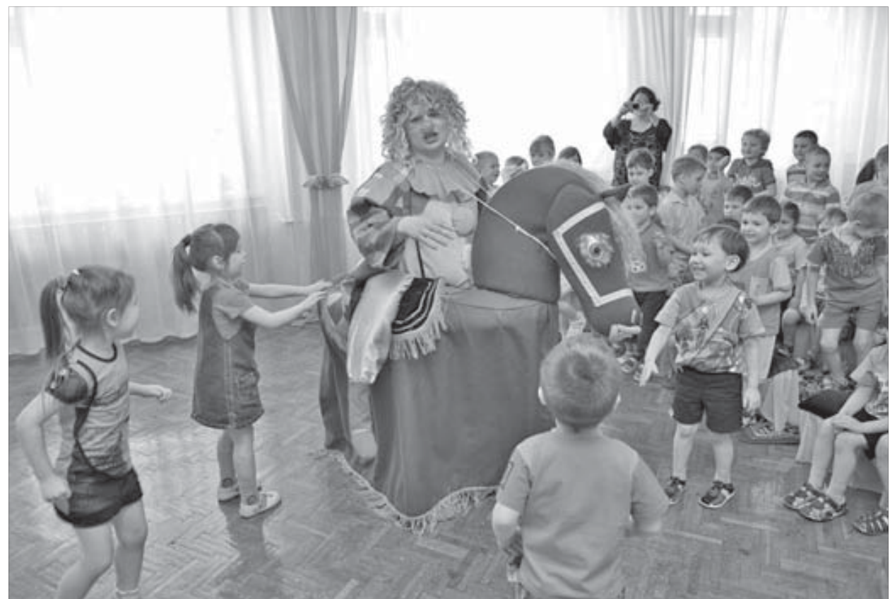
Дети в восторге от дудинских гостей

О том, что дудинский Дворец культуры, в котором работает “Хэйро”, тоже относится к подшефным учреждениям НЖД, в школе №31 узнали в день юбилея предприятия. Тогда дудинцы поздравляли шефов на сцене Заполярного театра драмы. Норильчане надеются, что визиты “Хэйро” к подшефным будут организовывать чаще.