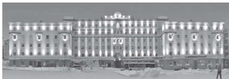
Фасад этого дома будут освещать 115 светильников

Члены градостроительного совета утвердили проект подсветки фасада и торцов дома №3 на Ленинском проспекте. А в Талнахе появится долгожданный фонтан.