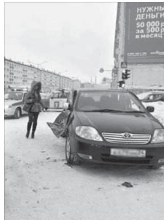
Несоблюдение ПДД приводит к беде

Подушка безопасности рассчитана на рост и вес взрослого человека. Она также может быть опасна, если вы не пристегнуты.