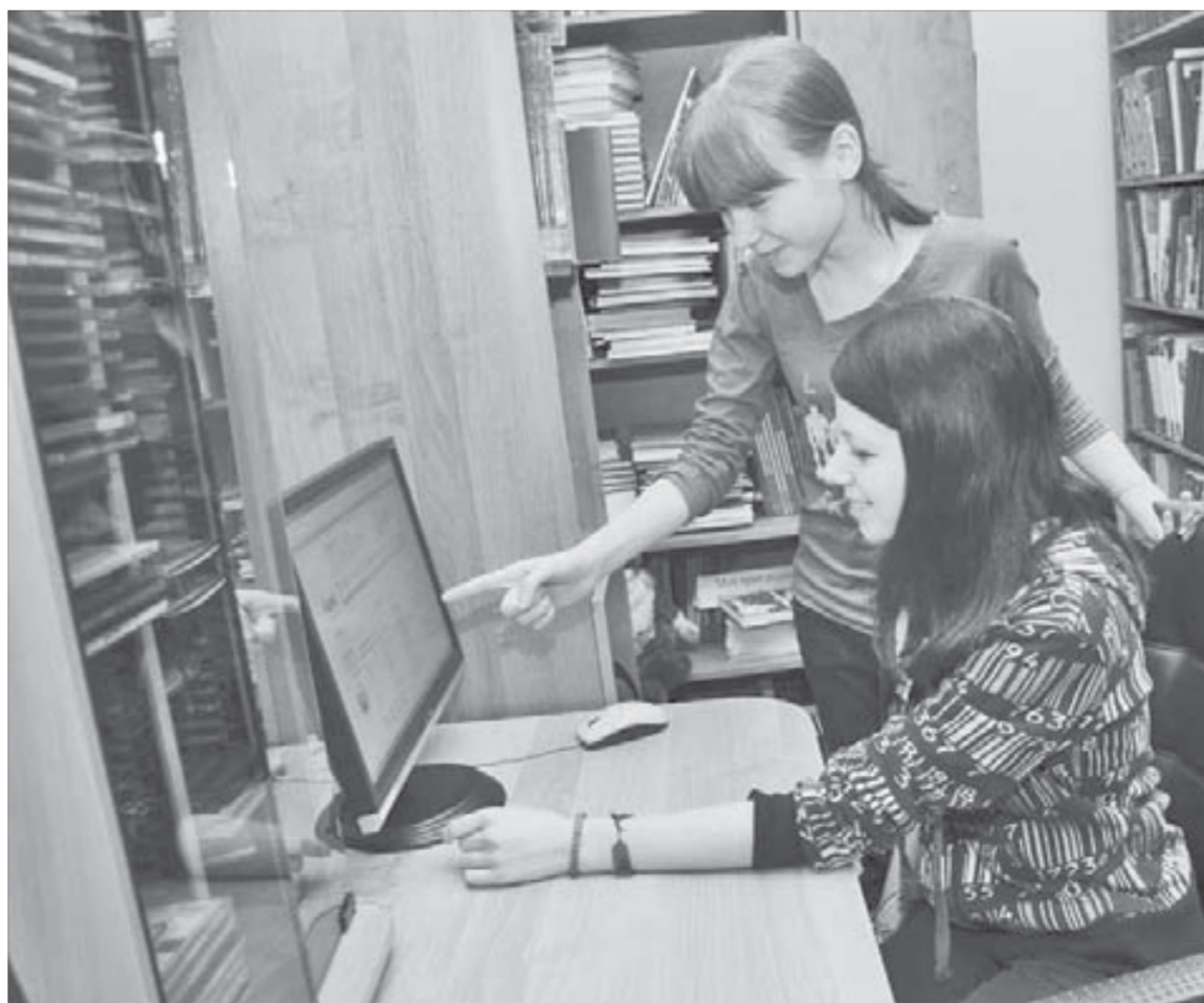
Все новости школы можно узнать на ее сайте

Пока интернат №2 имеет такого помощника, как Андрей Прокопенко, материалы сайта www.internat-2.ru своевременно обновляются, корректируются, и выглядит он все более стильно.