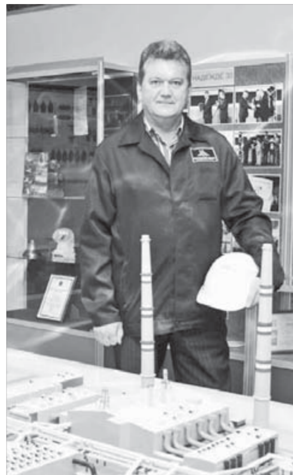
Он помнит прошлое, ценит настоящее, смотрит в будущее