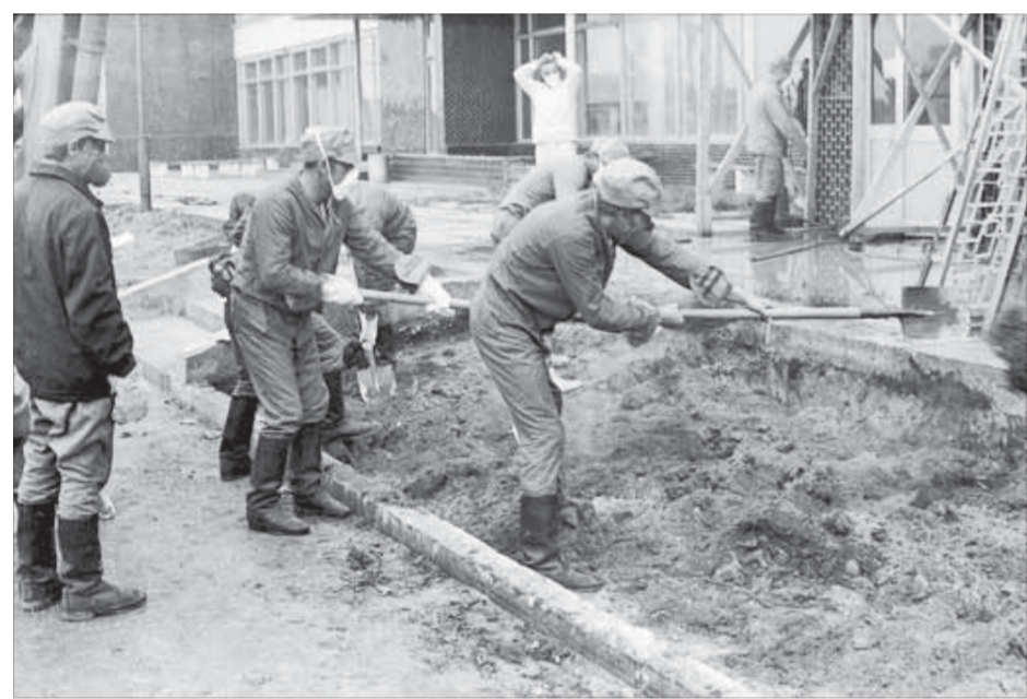
Ликвидаторы. Лето 1986-го

В кинотеатре “Родина” в прокат выходит уже напумевший фильм Александра Миндадзе “В субботу”, посвященный чернобыльской трагедии, самой крупной техногенной катастрофе в мире. – Мне давно хотелось сделать фильм-метафору по поводу чернобыльских событий. Меня интересовало, как человек от катастрофы не убежит, а наоборот: не может сдвинуться с места, живет бездумно, увлекается мелочами жизни, которые ему все дороже и дороже, – говорит Александр Миндадзе, режиссер-постановщик картины.