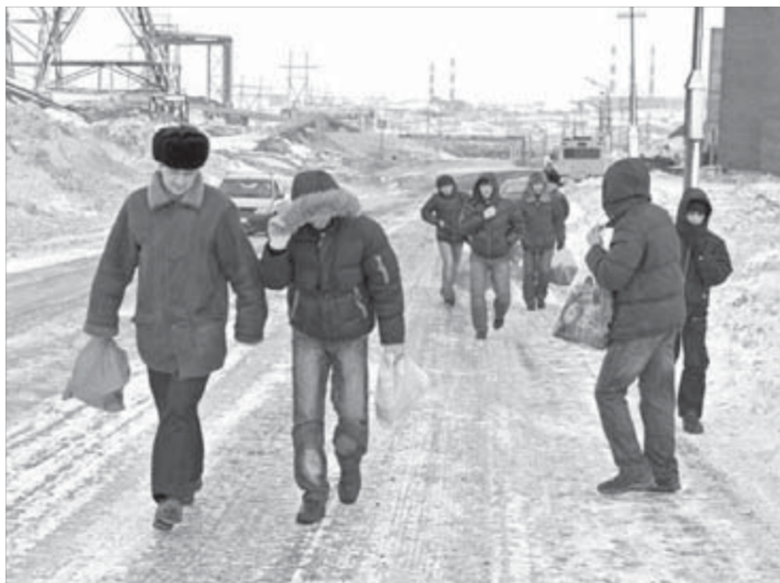
Путешествие — неприятный сюрприз