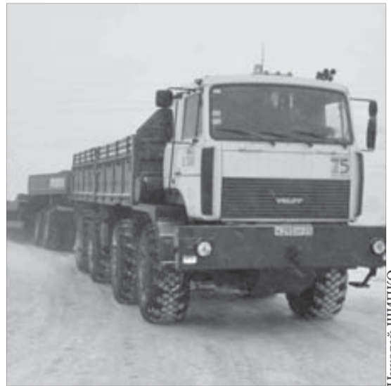
Балластный тягач из автоколонны №6

В 2010 году в автоколонну поступила новая техника — пять седельных тягачей СуперМАЗ, один КамАЗ и десять полуприцепов-бочек для перевозки цемента.