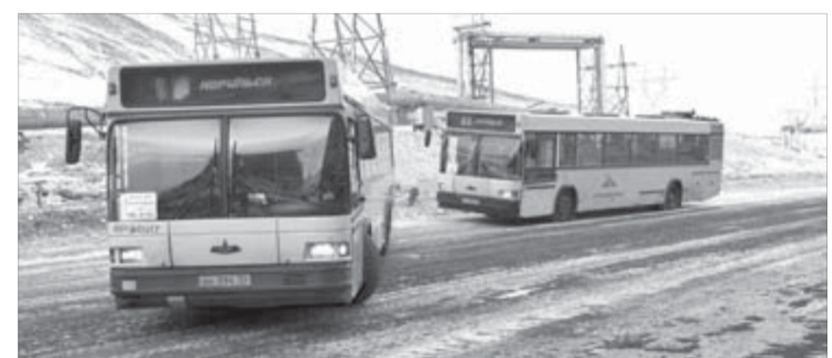
Водители вынуждены прервать маршрут — ехать дальше опасно