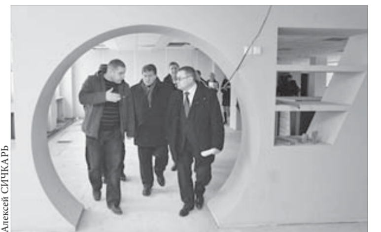
Ремонт в детском саду в разгаре

— Будем надеяться, что сроки выполнения работ на всех этих объектах будут соблюдены, — подытожил глава администрации. — Во всяком случае, город все свои обязательства перед подрядчиками выполняет.