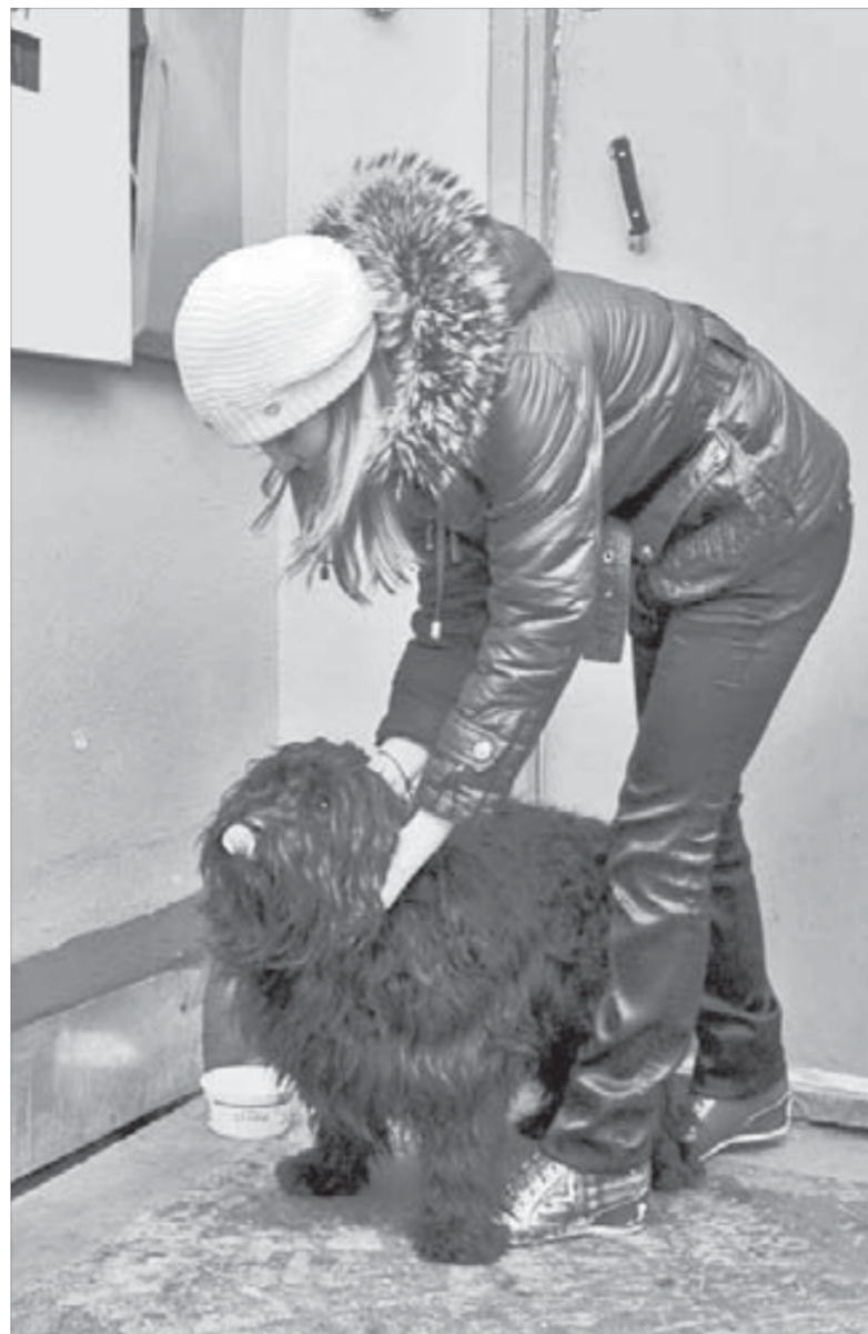
Собака чувствует, кому можно довериться