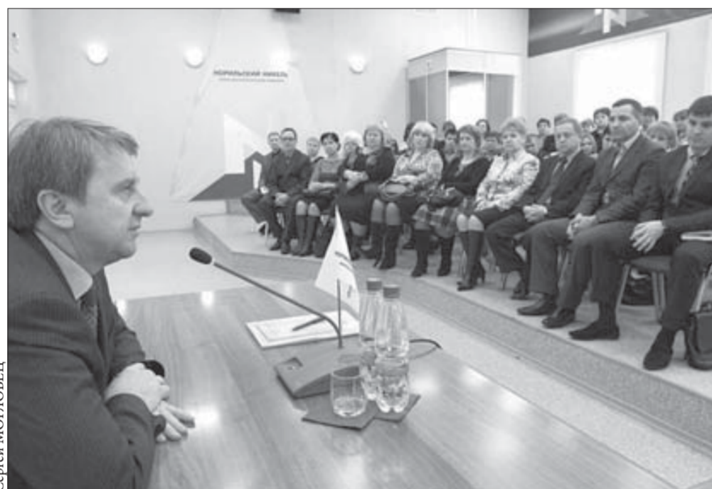
Объединение НТПО позволит решать масштабные задачи