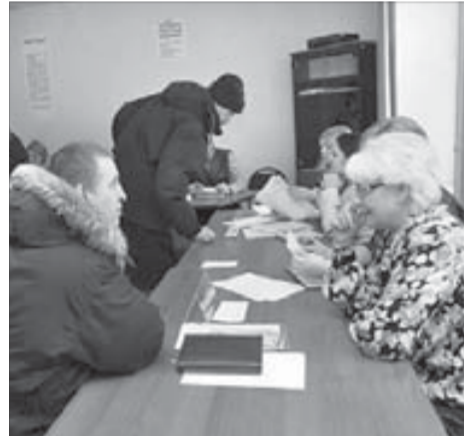
Место есть, а кадров не хватает