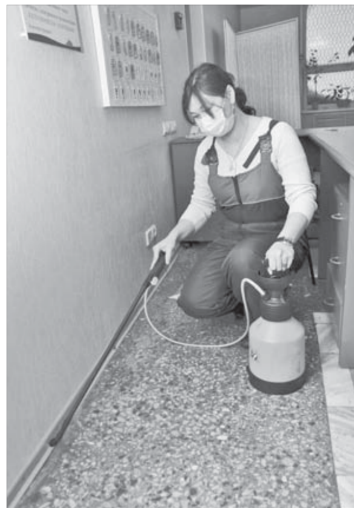
Дезинфекторы обрабатывают помещения современными препаратами