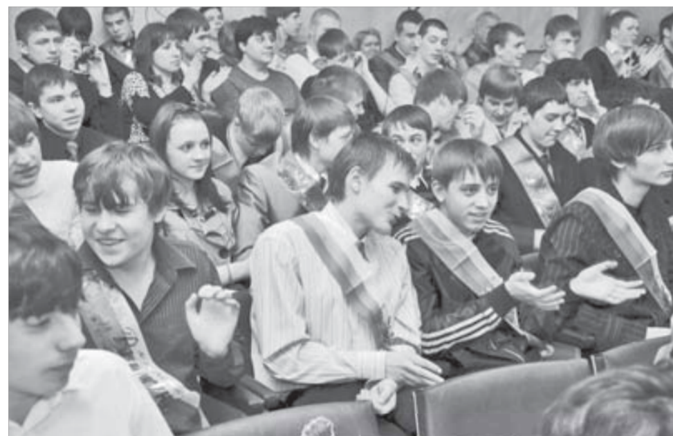
Счастливые выпускники ПУ-105