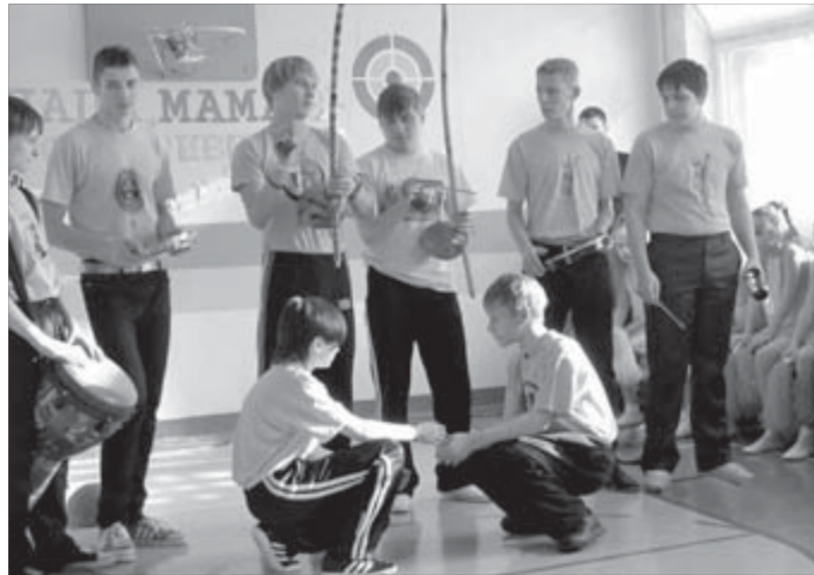
Капозйра не танец, а боевое единоборство

Поддержать юных спортсменов пришли и творческие коллективы города. Ансамбль народного танца "Оганер" известен далеко за пределами