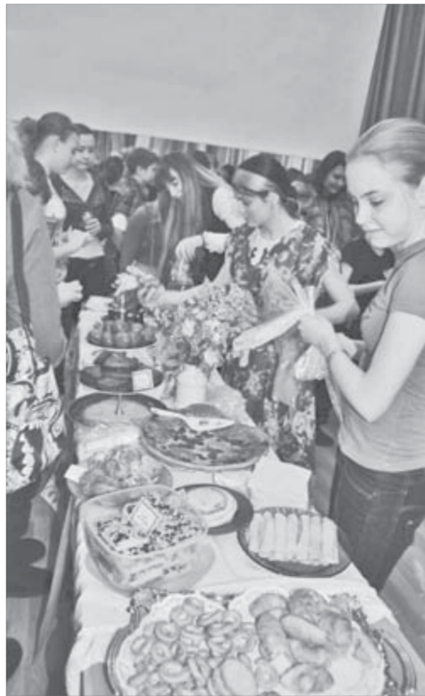
Ярмарка представила богатый выбор яств

Деятельность учащихся объединения "Калейдоскоп" можно увидеть на школьных и городских мероприятиях, где они являются бессменными участниками.