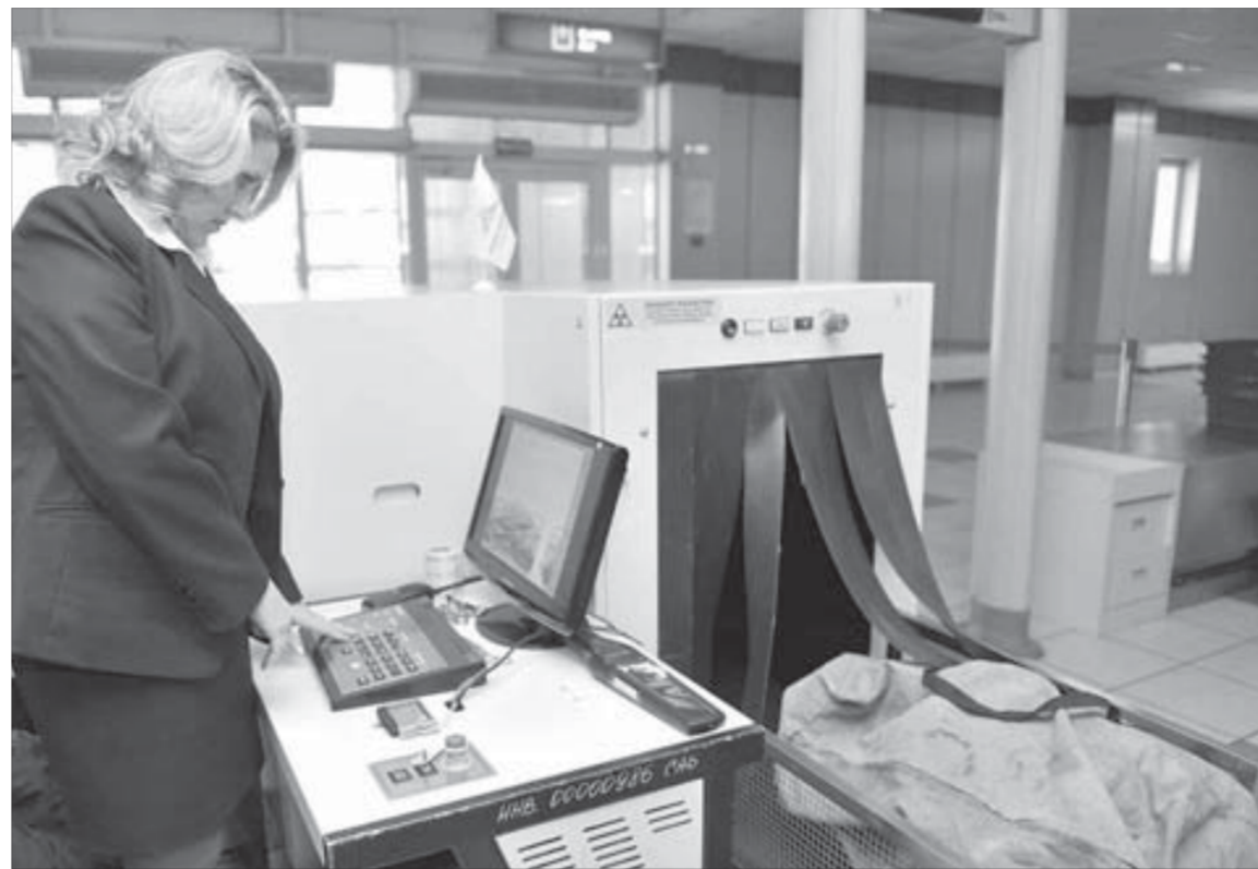
Бдительность и еще раз бдительность!

Норильчане знают эти правила и тем не менее периодически нарушают их. Сотрудники службы авиационной безопасности вспоминают случаи, когда пассажиры пытались провезти с собой в ручной клади ракетницы,