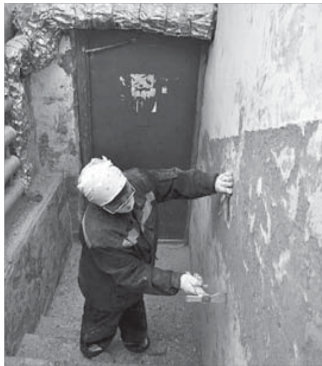
Подъезды ремонтируют, вандалы их портят