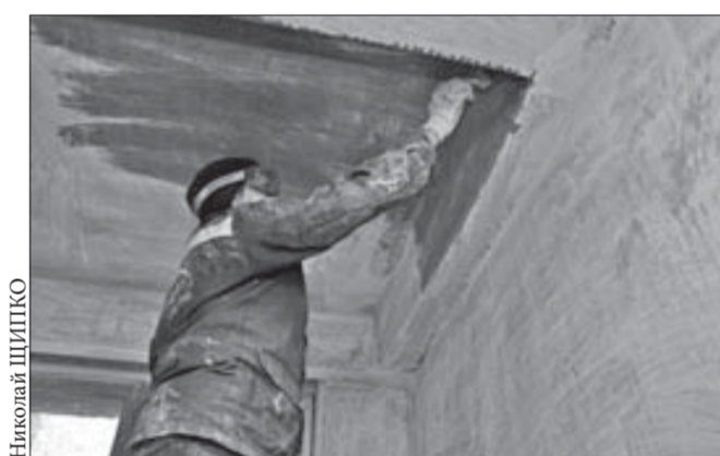
НЖЭК уже отремонтировал 14 подъездов

Коммунальщики Кайеркана столкнулись с проблемой: в отремонтированных подъездах домов хозяйничали вандалы.