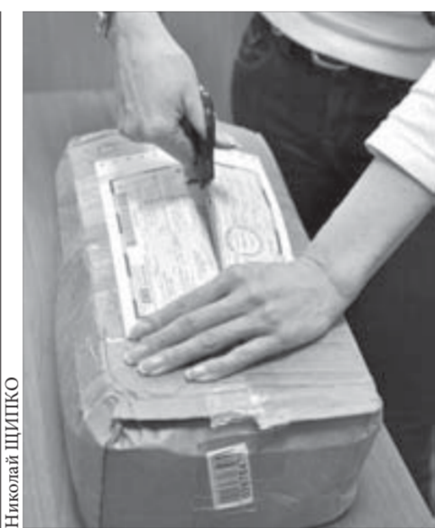
Это EMS-отправление шло 18 дней

Больше всего их в Минусинске, Ачинске, Дивногорске. Доля женщин с высшим образованием среди населения региона значительно превышает мужской показатель – 15% против 6%. Активность их участия в малом и среднем бизнесе возросла в среднем на 3%. Однако благодаря росту доходов мужчин гораздо больше представительниц прекрасной половины сегодня могут позволить себе стать домохозяйками – 10%. Годами раньше этот показатель не превышал в крае 1,5%. Организуя собственный бизнес, женщины также стали больше открывать предприятий, связанных с воспитанием детей.