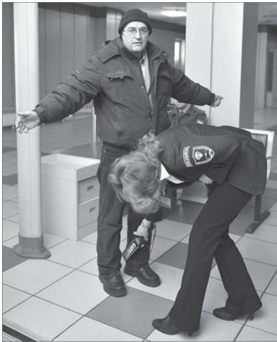
В Норильске действует тотальный досмотр всех входящих в здание аэровокзала