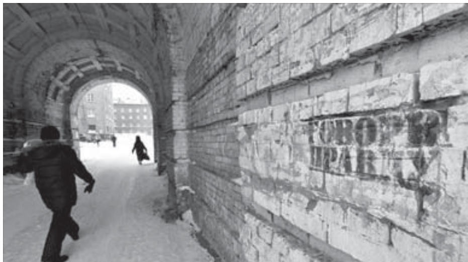
Подворотня – та же пещера