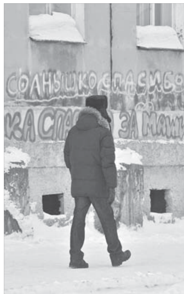
Палитра красок и слов

Выходит, настенную пропаганду все-таки кто-то отслеживает. Чувства ответственности и здорового юмора этому славному человеку, ибо еще присутствуют на стенах здоровые всплески души типа “Зайка, улыбнись!”.