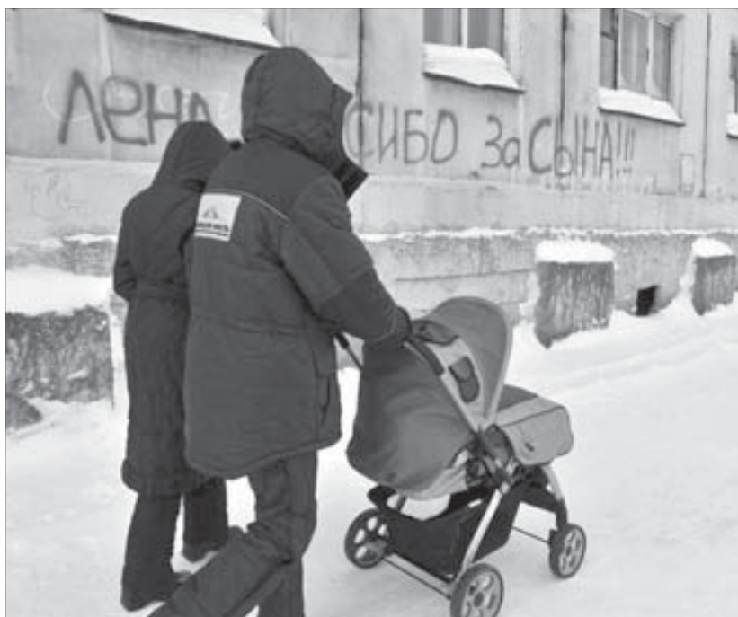
“Спасибо за сына, спасибо за дочь...”