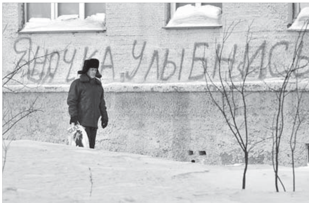
Словами все не передать