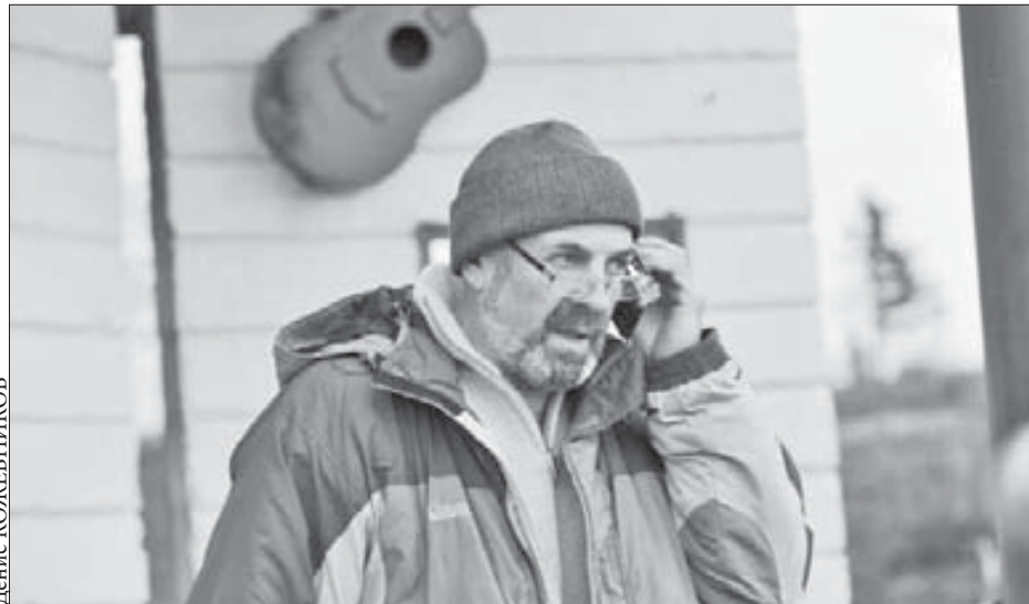
И сам не скушает, и другим не дает