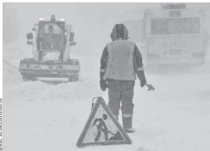
В снегу люди и лошадиные силы

Курс акций ОАО «ГМК «Норильский никель» – 7078 рублей. ОАО «Полюс Золото» – 1711 рублей.