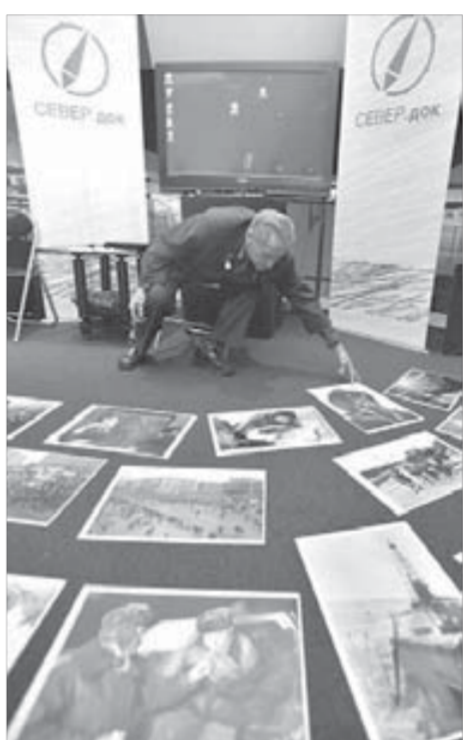
Мэтр делится секретами