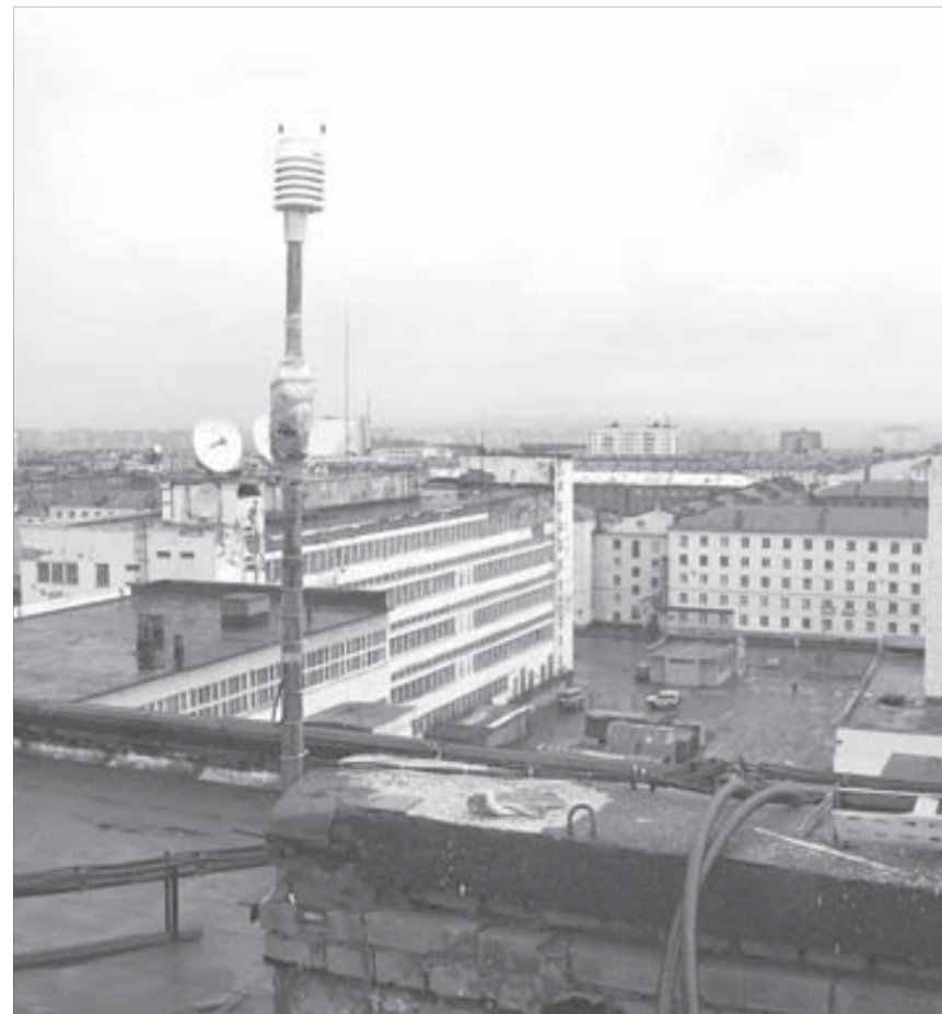
Одна из четырех метеостанций установлена на крыше "Норильск-Телекома"

"Норильск-Телеком" приобрел четыре современные метеостанции финского концерна VAISALA и теперь может самостоятельно получать информацию о фактической погоде.