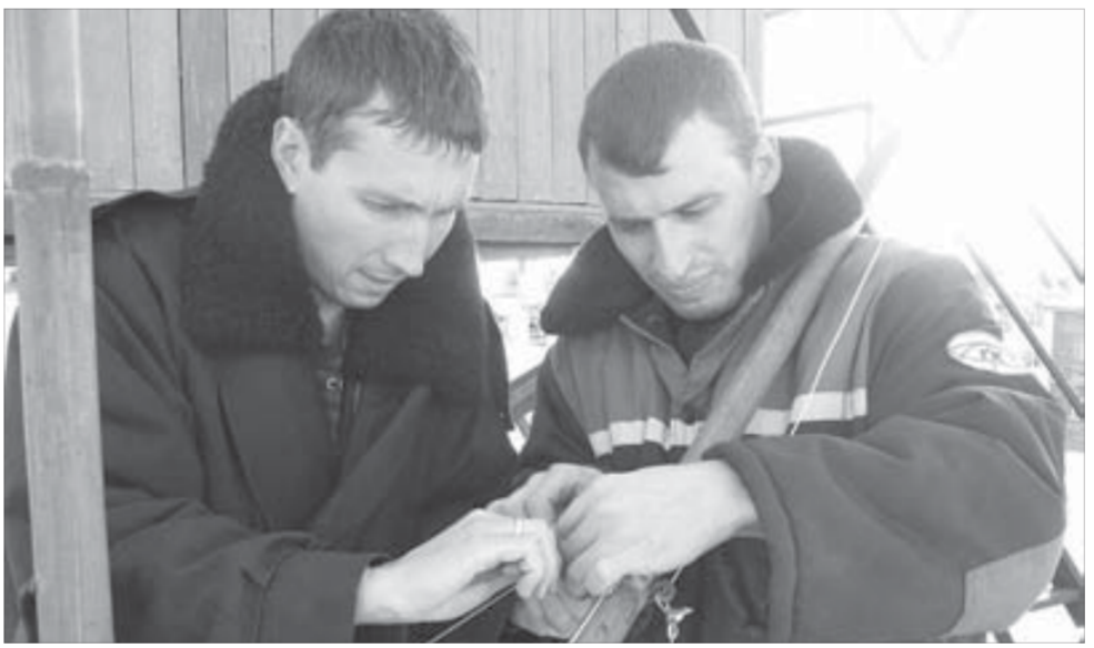
Специалисты отдела информационных систем ответственно подходят к монтажу конструкций

В-третьих, "Норильск-Телеком" – социально ориентированная компания, активно реализующая программы, важные для бе-