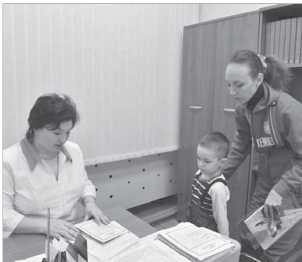
Утро начинается с проверки