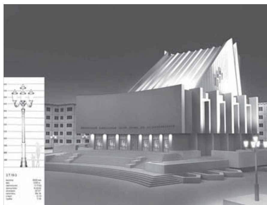
Театр и площадь засияют новыми огнями

Совет также обсудил предложения муниципального управления архитектуры и градостроительства по архитектурной подсветке Заполярного театра драмы. В управлении разработано три варианта подсветки. Главным образом эти варианты различаются количеством