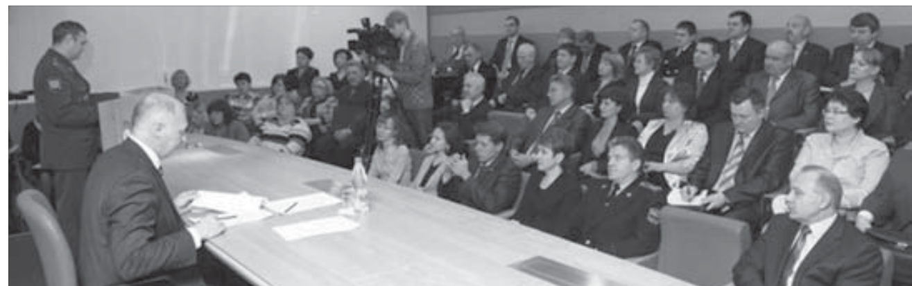
На общегородских планерках обсуждают многое и достается многим