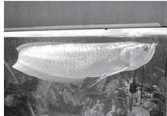
В натуральную величину – 70 см

вотных этому есть и другое объяснение: редкая авиакомпания пойдет на то, чтобы разрешить к перевозке в самолете заводных грызунов. То ли дело – террариумные животные: лягушки, хамелеоны, ящерицы... Или, к примеру, жуки-многоножки. Несмотря на то что сорок ножек мы разглядеть у них не смогли – скарабеи свернулись в черные тьюквообразные шарики, – зрелище на взгляд непрофессионала показалось не слишком приятным. Хотя покупатели другого мнения.