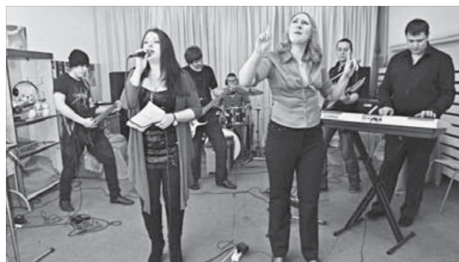
Репетиции идут полным ходом

Выпустить бы такую “рыбку” не в аквариум, а в декоративный дачный прудик... Чем не деревенская идиллия?