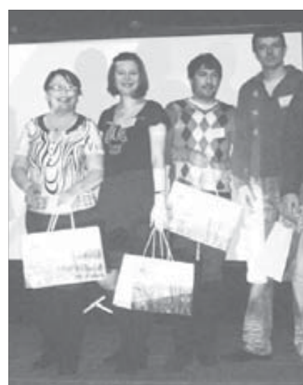
Один за всех, и все за одного

Не хлебом единым, то есть не только производственными заботами, живы работники Норильско-Таймырской энергетической компании. Свидетельством этого стала игра “Сто к одному”, на которую в гимназии №1 собрались команды молодых специалистов “Лидер” и руководителей ОАО “НТЭК”.