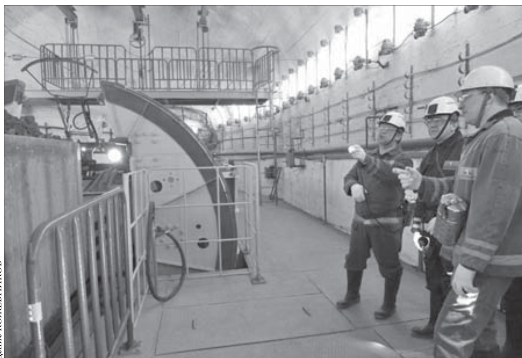
Завершен еще один этап модернизации минерально-сырьевого комплекса

С грохотом уносясь по вертикальной двухсотметровой выработке, первые тонны руды ушли с нового опрокидывателя РТ-ВПС рудника "Таймырский" по тальфу что сданному рудоспуску на горизонт - 1321 метр. Новая цепочка рудоподачи заработала.