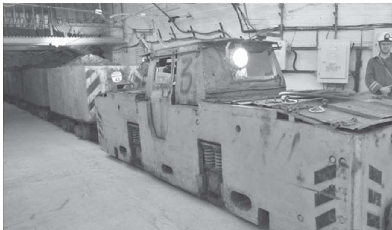
Разгрузка руды на новом опрокидывателе полностью автоматизирована