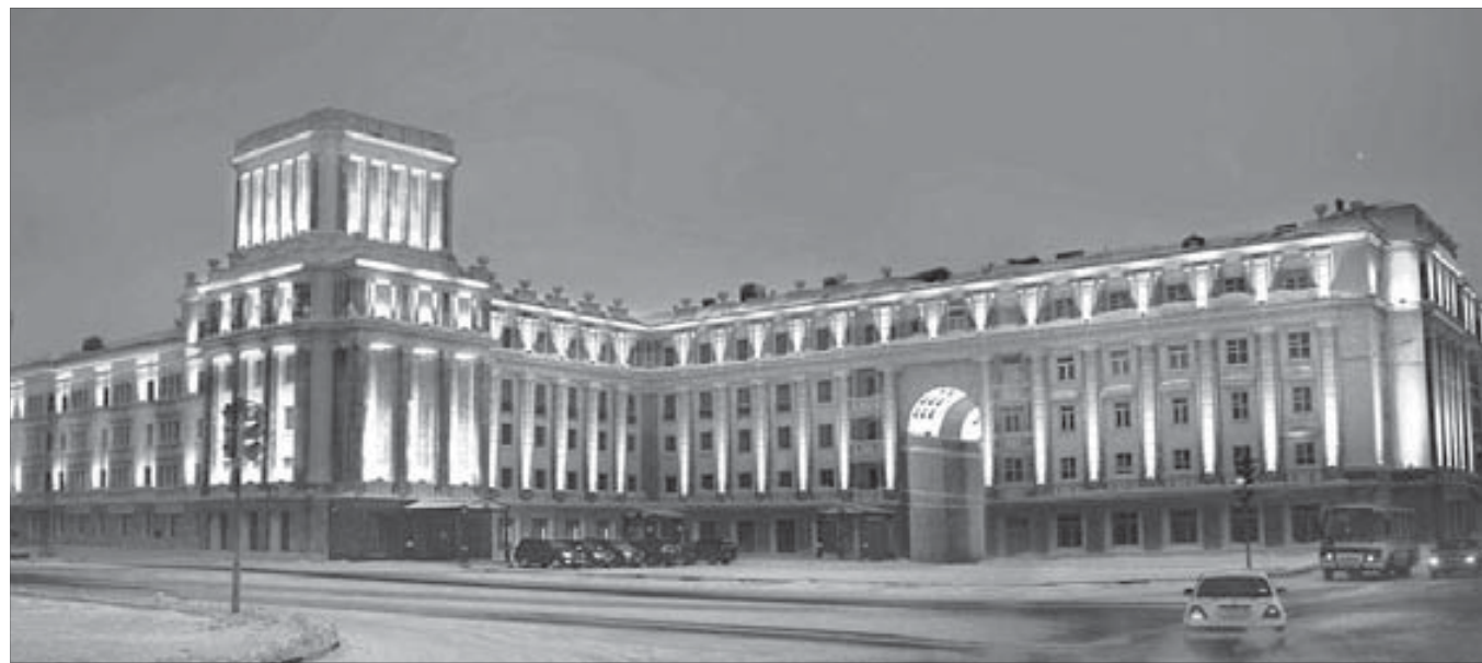
Подсветка исторического дома обойдется в 3,5 миллиона рублей