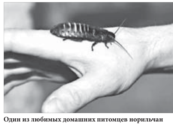
Один из любимых домашних питомцев норильчан

Нынешняя “деревенская” направленность для зоомагазина не случайна. Во-первых, как и все нормальные люди, норильчане хотят быть ближе к природе. А во-вторых, кого сегодня можно удивить крокодилами, обезьянами и попутаями с размахом крыльев в полтора метра? Скунсов, енотов и прочую экзотическую живность тоже стали реже привозить в Норильск. Помимо моды на определенных домашних жи-