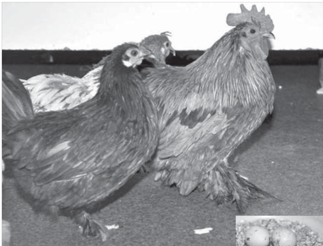
На первый взгляд ничем не отличаются от деревенских кур