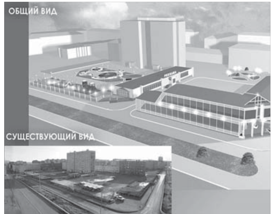
Новый комплекс обещают построить за три года