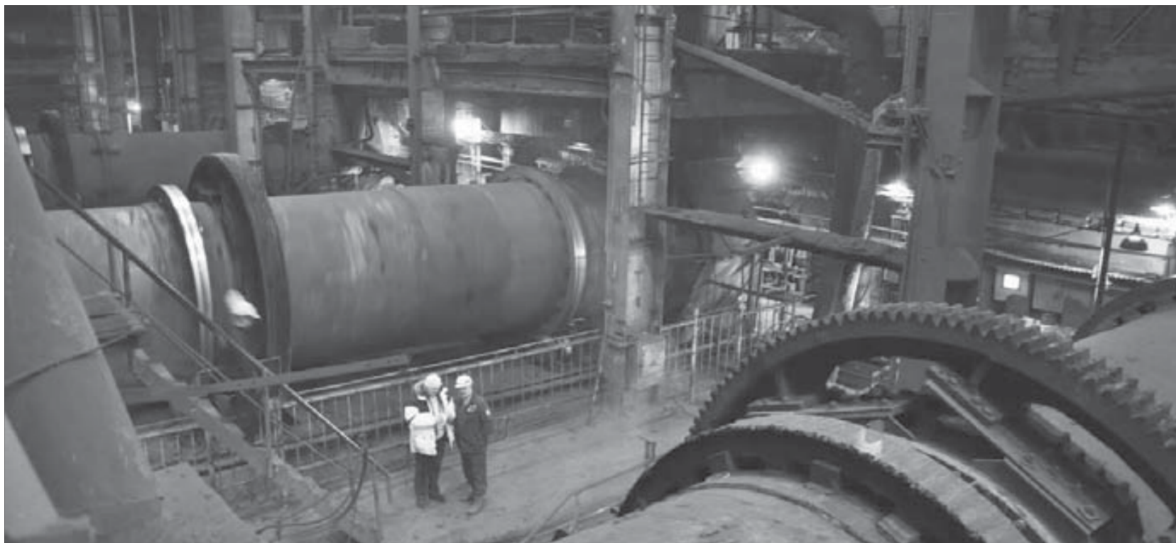
Установка огромного оборудования требует миллиметровой точности