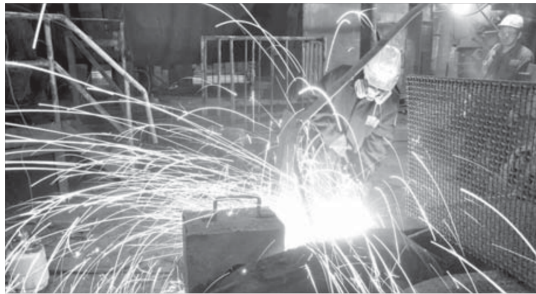
Работают специалисты высокой квалификации

На ремонте цепочки агломашин №6 было задействовано более 150 человек. Работали по 45–50 человек в смену. Оборудование в агломерационном цехе громоздкое, масштабное. Снятие бандажей и цилиндров осуществлялось стационарными грузоподъемными механизмами. Потом детали доставлялись на механический завод.