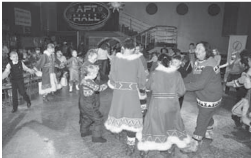
Праздник завершился общим хороводом

показ фильмов шведских и норвежских авторов – на этот раз зрители увидели короткое игровое кино. А буквально через дорогу, в Музее истории освоения и развития НПР, горожанам представлены две заме-