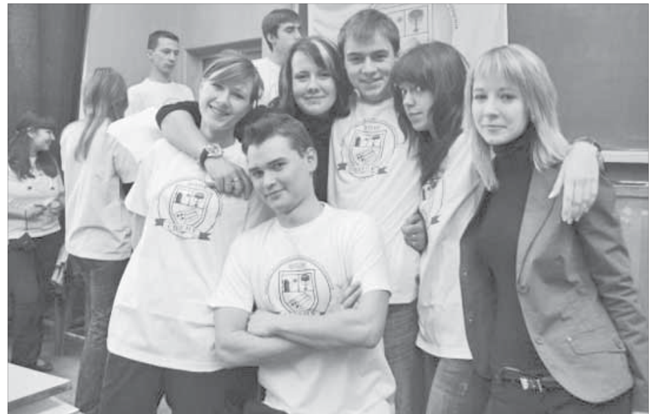
На факультете технологии и исследования материалов

Студенты изучают интереснейшие и такие нужные будущим профессионалам курсы, как плавка руды и концентратов в различных агрегатах, конвертирование, окислительный и восстановительный обжиг, автоклавное и атмосферное вы-