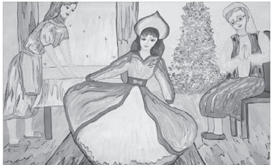
Рисунок Ани Безчаснюк, 10 лет (творческое объединение “Страна красок”, Талнах)