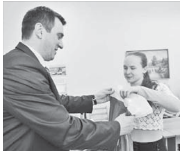
Победа в конкурсе для многих стала неожиданностью

– Очень почетно получить награду на таком масштабном конкурсе. Буду следить за ним и дальше. У меня уже есть задумки для новых работ.