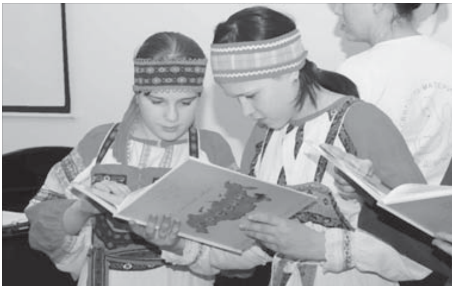
Сборники, наполненные добротой

Познакомиться с условиями конкурсов можно на сайте Красноярского филиала ЦНС www.kfnsr.ru .