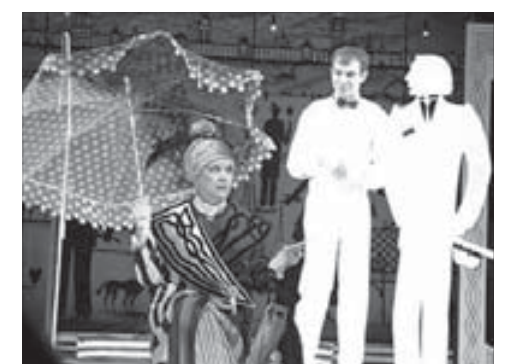
Миссис Уотсон в моэмовской “Пенелопе”