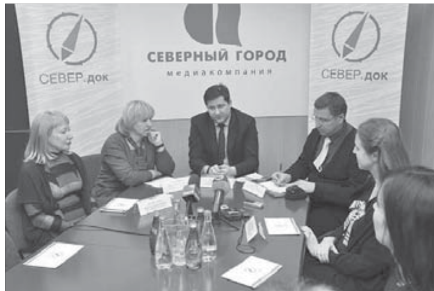
Фестиваль собирает единомышленников

Надо сказать, проекту “СЕВЕР.ДОК” это удастся.