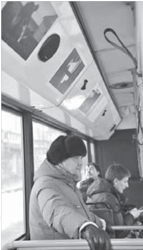
“СЕВЕР.ДОК” идет к вам