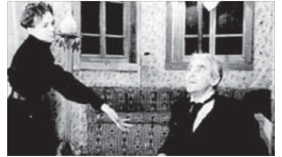
В театре на улице Горной начинался творческий путь гениального Смоктуновского. Сцена из спектакля “Дети Ванюшина”. 1947 г.

колаем Сличенко. Режиссер Владимир Гурфинкель, в эти дни репетирующий новый спектакль в Норильске, много ставил на Мокиенко и с Мокиенко в краевой драме. Именно он слетал на юбилейные торжества в Красноярск, чтобы поздравить юбиляршу от себя и Норильского Заполярного театра.