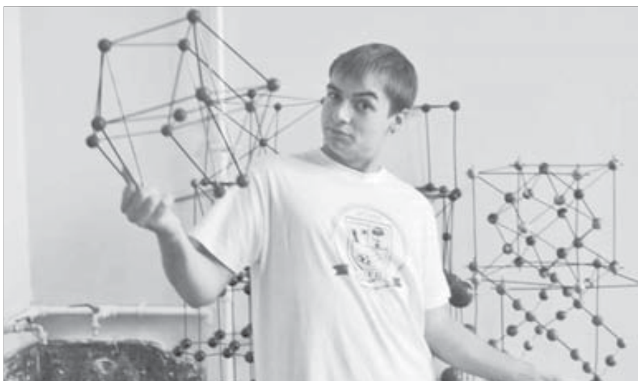
Кристаллографию в политехе изучают наглядно

Очень важный момент: при выборе данного профессионального направления следует учитывать склонность к таким школьным предметам, как физика и химия. Для поступления на кафедру обязательно нужно иметь в составе сданных ЕГЭ один из этих предметов. В общем, успешно сдавайте экзамены – и вперед, к будущей профессии. Будет очень интересно и, что немаловажно, весело. При известной настойчивости и целеустремленности есть все шансы вернуться в Норильск уважаемыми людьми и достичь профессиональных высот.