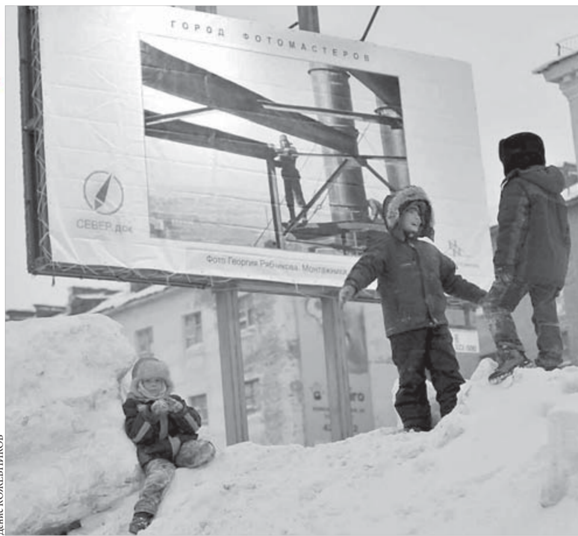
Выставка "Город фотомастеров" стала частью городского пространства

Например, на одном из автобусных маршрутов можно увидеть фоторепортаж Вадима Кирпиченко "Чем дальше живу среди людей, тем все больше люблю собак" – это история из жизни известного