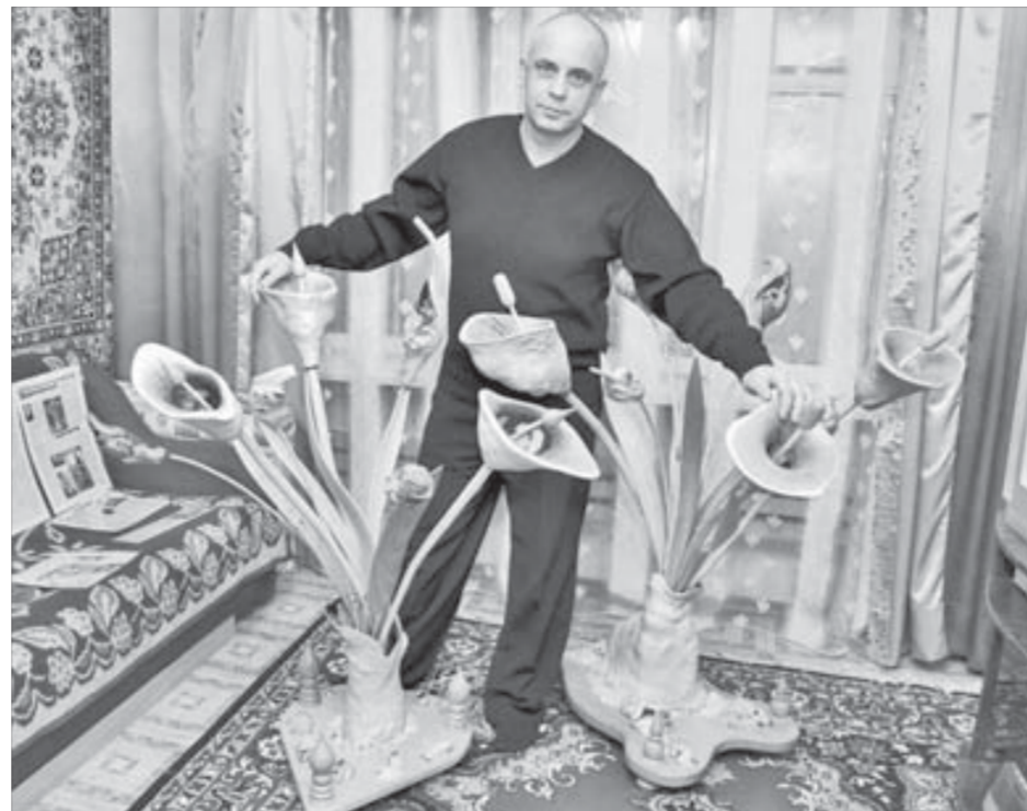
Комната-сад в обычной квартире

– До моря далеко, и с одного берега на другой два троса были натянуты, по ним же мы передвигались, как канато-