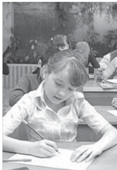
Начали с начальной школы

Министерство образования Красноярского края берет на себя обеспечение учебниками всех первоклассников из малообеспеченных и многодетных семей, а также детей,