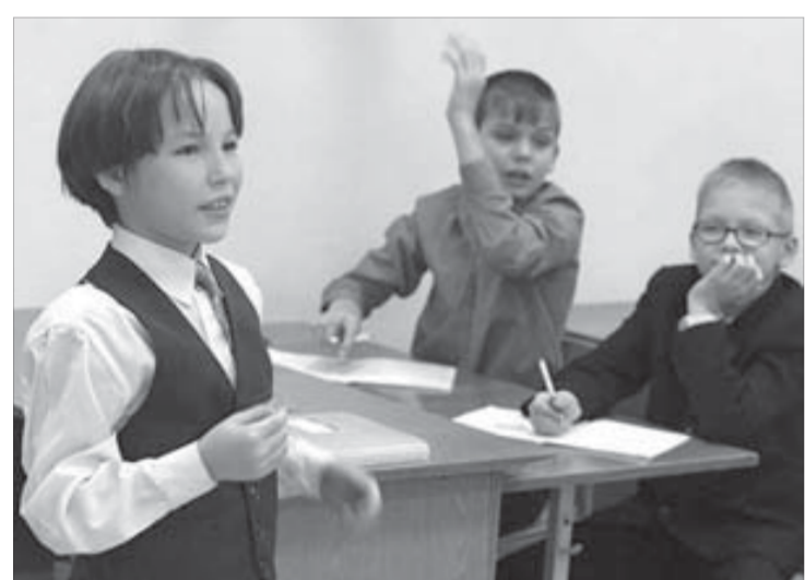
Школьников приучают к самостоятельности

Также в программу включено новое мероприятие, требующее дополнительного финансирования в размере 8,8 млн рублей. Это приобретение, доставка и установка двух футбольных полей. В рамках реализации программы предусмотрено и участие федерального бюджета: средства, которые выделят Норильску, будут отражены в бюджете территории после заключения соглашения между краевым Министерством ЖКХ и Минрегионразвития.