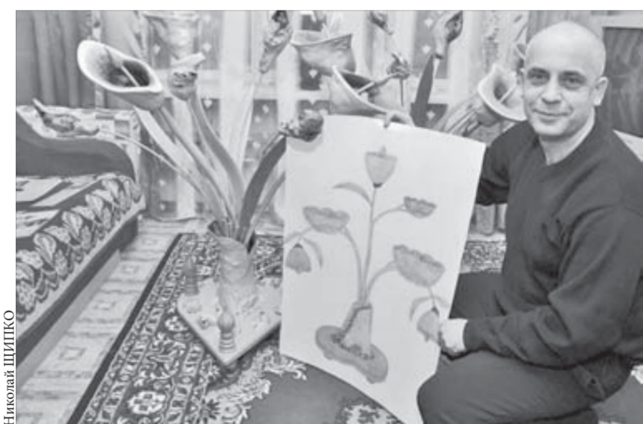
Цветы кропотливой работы