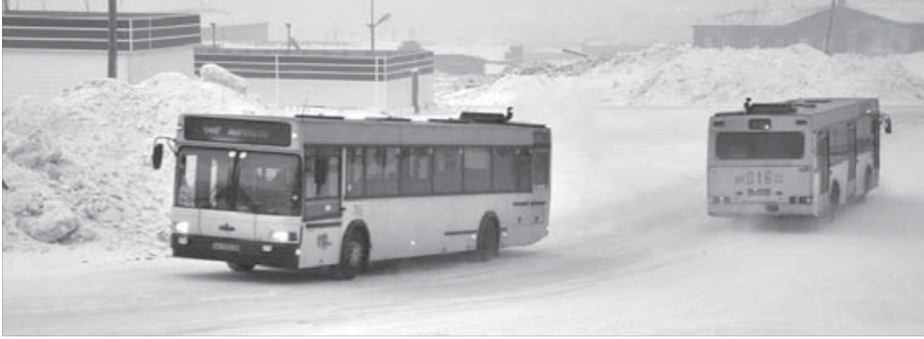
НПОПАТ – крупнейшее транспортное предприятие Красноярского края