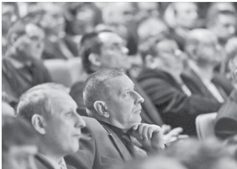
Форум собрал все предприятия "Норникеля"