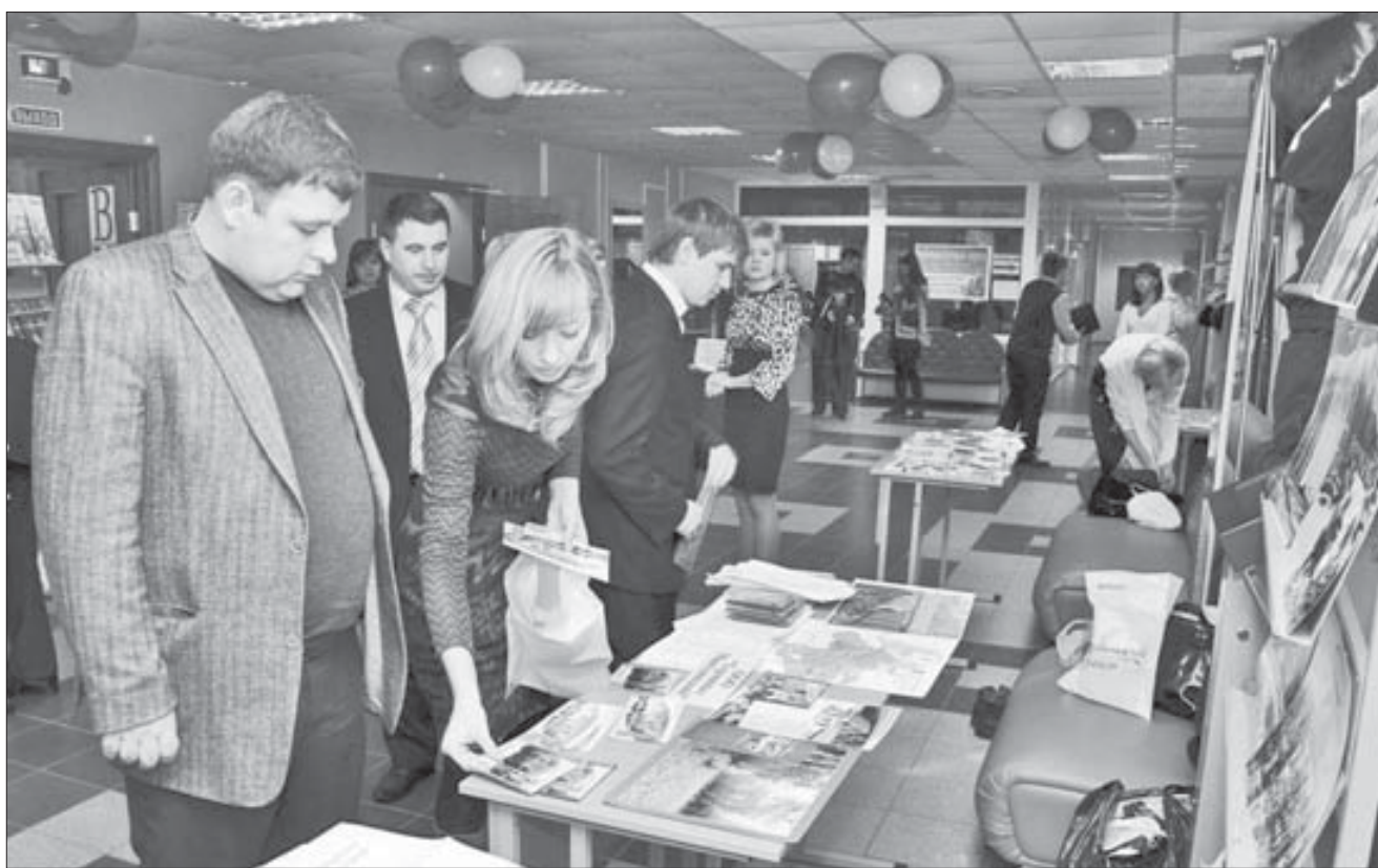
Застройщики старались показать себя