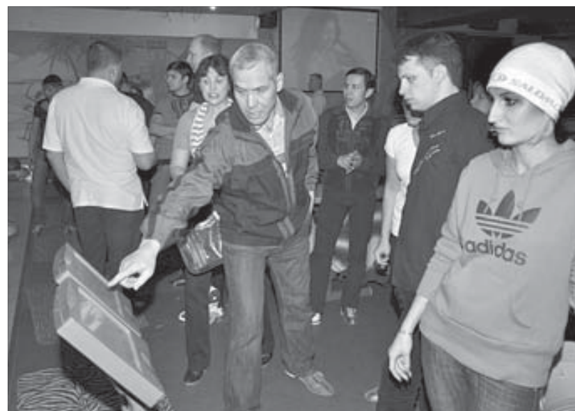
Спортивные результаты – часть производственных успехов