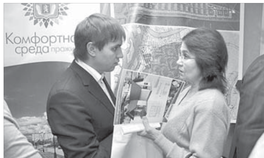
На все вопросы хочется получить ответы