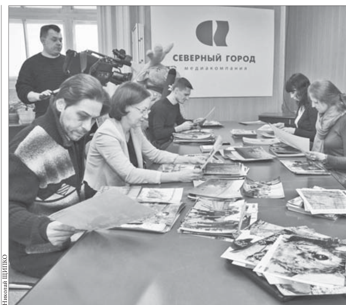
Жюри оценивало оригинальность идеи и соответствие теме

По причине отсутствия связи остаются неработающими банкоматы Росбанка, расположенные на Ленинском проспекте: в аптеке №122, в дополнительном офисе банка, торговом центре “Горняк” и универсаме “Талнах”. Может быть временное прерывание связи по причине восстановительных работ, проводимых сотрудниками “Норильск-Телекома”. Кроме того, банкомат отключается, если клиенты дважды забывают взять снятые деньги. И включается только после проведения инкассации. Человеку же, забывшему средства, необходимо обратиться в офис Росбанка и заполнить заявление.