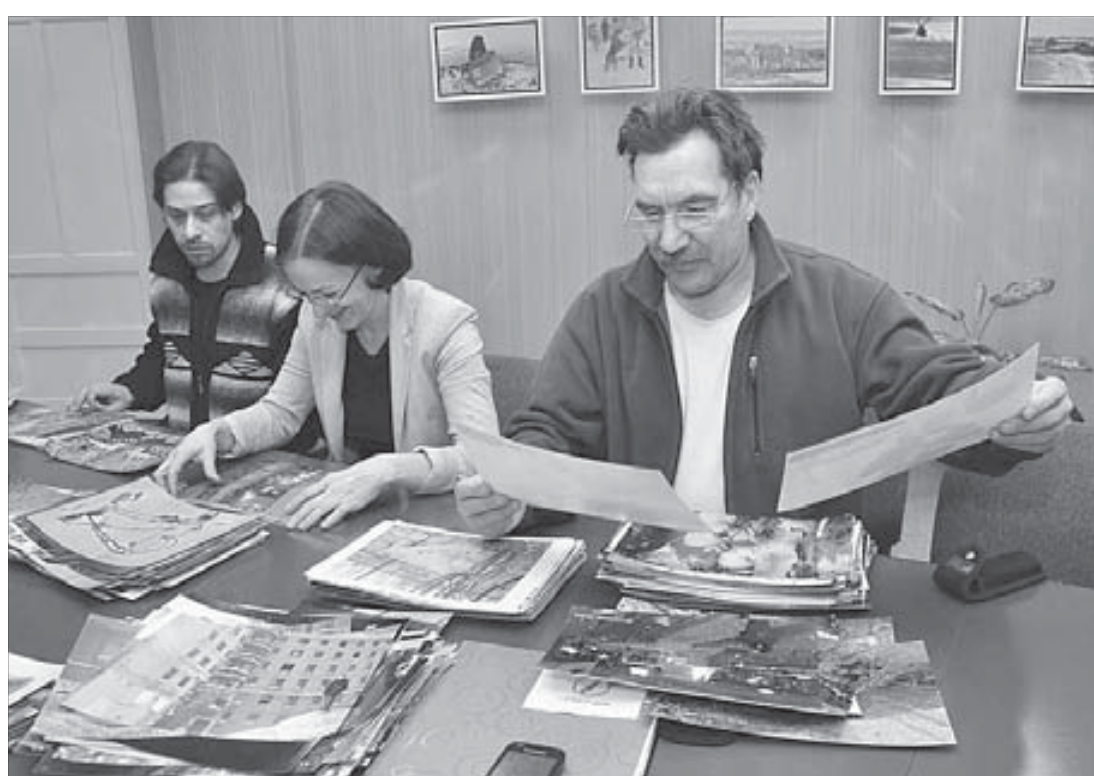
Отбор был жесткий даже в полуфинале